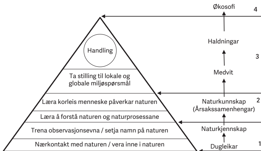
Figur 1 Miljøtrappa i det økosentriske friluftspedagogiske perspektivet vårt (Nerland, 2021).

til natur kultivert, og forståinga av naturen vert til i ein interaksjon med evnene deira. Dugleikar og kjennskap til natur vert erverva gjennom leikprega aktivitet, opplevingar og erfaringsbaserte læreprosessar. Tumling og fumlung inneber nærkontakt med natur, og gjennom kombinasjonen med menneske i rørsle i natur fører dette til ei kjenslemessig aktivisering knytt til det ein kallar naturopplevingar. Naturopplevingar er ein av dei andre styrkane til friluftsliv i eit miljøperspektiv. Wilson (1984) hevdar at kjenslene knytte til naturopplevingar er sjølve kjernen i å forstå menneske sin motivasjon for å ta vare på natur. Menneske bryr seg om det dei assosierer med positive kjensler, og viktigheita av det emosjonelle perspektivet vert òg støtta av internasjonal forskning (Ampuero et al., 2015; Green et al., 2015). Bandet mellom student og natur må på dette stadiet av progresjonen utviklast vidare til eit forhold med gjensidig tillit. Barratt et al. (2014) meiner at utviklinga av eit slikt tillitsforhold til natur er avgjerande for progresjonen mot miljømedvit. Viktigheita av å vera i natur for å kunna utvikla miljømedvit vert støtta av Green et al. (2015, s. 10), som skriv: