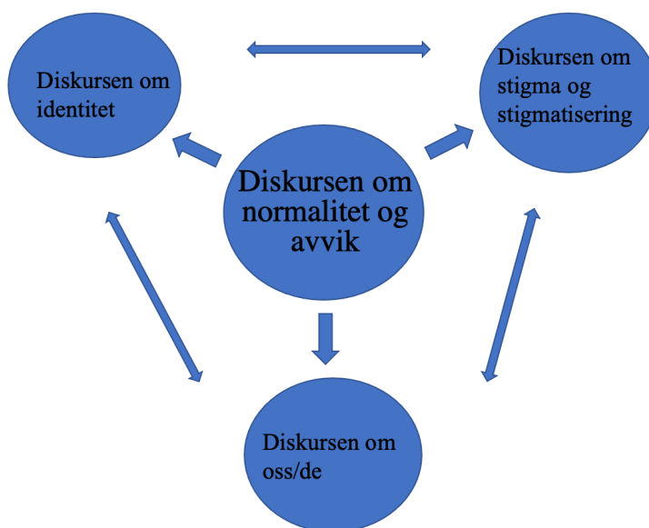
Figur 3: Fire identifiserte diskurser.

En kan forstå sammenhengen mellom disse diskursene ved å se på at de kan påvirke hverandre på komplekse måter. Diskursen om normalitet og avvik er med på å bestemme hva som ansees som normalt og unormalt i samfunnet. Dette kan føre til stigmatisering av personer som ikke passer inn i normen. Diskursen om identitet kan også påvirkes av dette og føre til at personer blir tildelt en identitet eller at de definerer sin egen identitet ut ifra hvor de passer inn. Diskursen om oss/de er også med på å dele samfunnet inn i grupper, og kan føre til stigmatisering og fordommer mot de som avviker fra normen. Alle disse diskursene er med på å påvirke hverandre og de spiller en stor rolle i hvordan en oppfatter seg selv, samt hvordan en blir oppfattet av samfunnet.