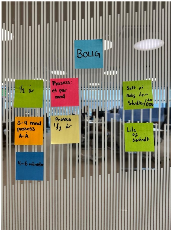
Figur 4.2. Kategori Bolig.