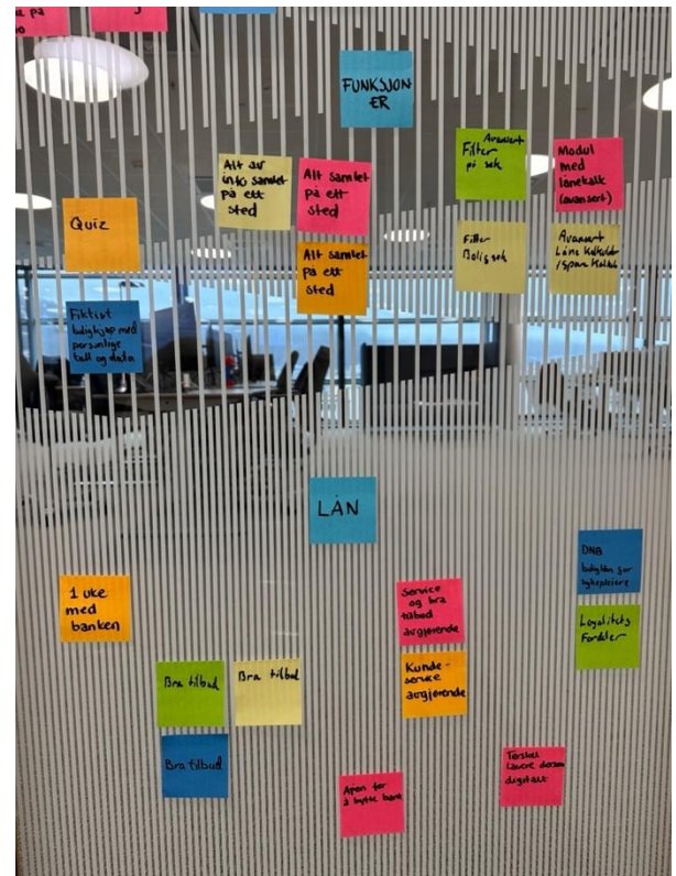
Figur 4.5. Kategori Funksjoner og Lån