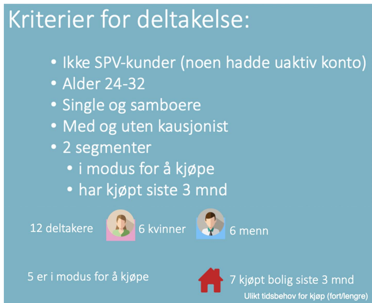
Figur 8.1. Viser til hvem som intervjues.

Det ble gjennomført brukerintervju av 12 personer i alderen 24-32, der syv hadde kjøpt sin første bolig i løpet av de siste 3 månedene og 5 var i modus for å kjøpe sin første bolig. Ingen av intervjuobjektene var nåværende kunder i Sparebanken Vest. Figur 8.1 viser til et skjermbilde fra testleders presentasjon om hvem intervjuobjektene er.