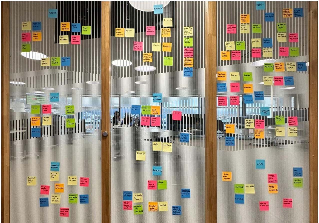
Figur 4.1. Kategorisering av intervjudata.

Dette kapittelet inkluderer bilder, figur 4.1 til 4.9, tatt fra prosessen med å kategorisere intervjudata i et affinitetsdiagram etter brukerintervjuene.