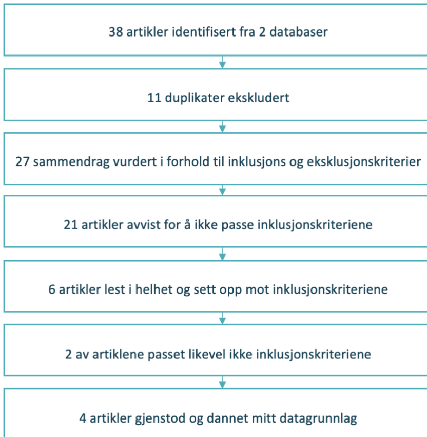
Figur 1: Flytdiagram (Aveyard, 2019, s. 93)

inklusions- og eksklusjonskriteriene, og jeg satt igjen med 6 fagfellevurderte artikler som tilsynelatende var innunder inklusjonskriteriene. For å være sikker på dette var neste steg å lese de i fulltekst. Etter en enda grundigere gjennomgang ble to av artiklene avvist da de ikke lengre samsvarte med inklusjonskriteriene. Prosessen visualiserer i flytdiagrammet under: