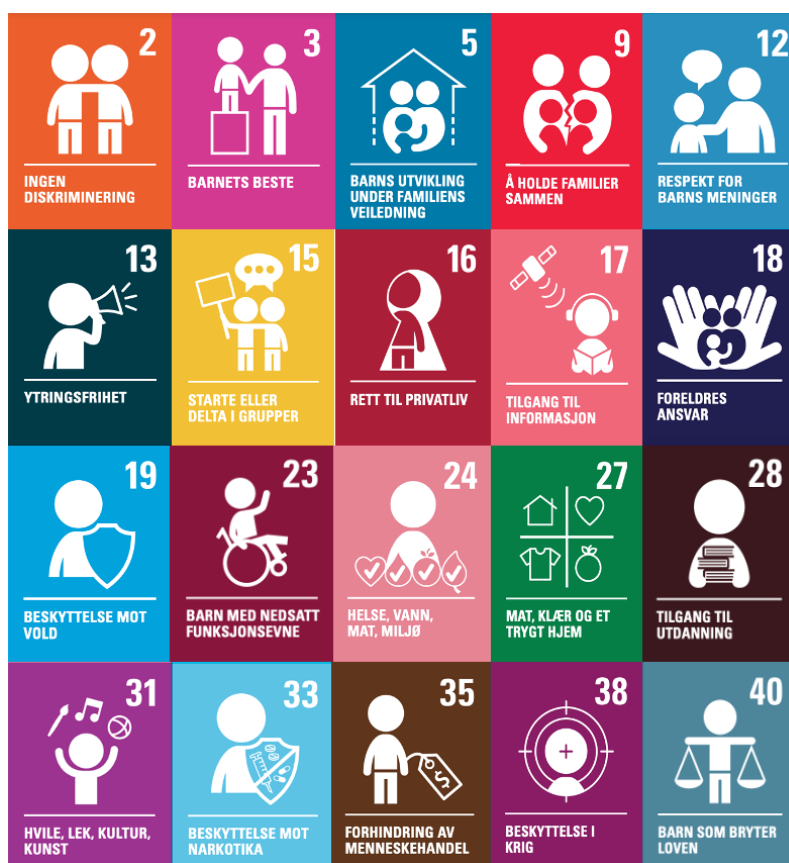
Figur 2. Utdrag fra plakativersjon av artiklene jeg finner aktualisert i bøkene (Barne- og familiedepartementet, u.å)

For å utdype funnene i tabellen, følger en gjennomgang av hver bok der jeg først presenterer bokens handling og fortellerperspektiv, før jeg presenterer hvordan rettighetene viser seg å være aktualisert i den gitte boka. Rekkefølgen bøkene presenteres på er tilfeldig, og har ingen betydning for funnene. Ettersom det er noe ulikt i hvor fremtredende rettighetene er, vil hver bok presenteres med de mest sentrale rettighetene først, for så å utfylles med mindre fremtredende rettigheter som preger boka i mindre grad. Til slutt følger en oppsummering av funnene, der jeg legger frem hvilke rettigheter som viser seg å være mest aktualisert.