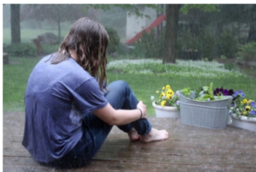
Figur 1: Fra «Healing is not linear: Using photography to describe the day-to-day healing journeys of undergraduate women survivors of sexual violence.» av Sinko et al., 2019, Journal of Community Psychology , 48(3), 658-674. https://doi.org/10.1002/jcop.22280 . Copyright 2019 John Wiley and Sons.