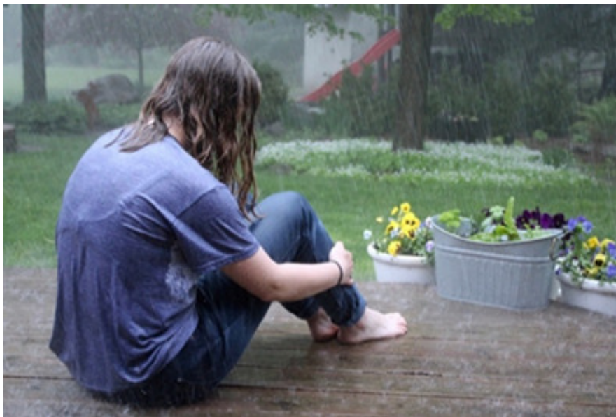
Figur 1: Fra «Healing is not linear: Using photography to describe the day-to-day healing journeys of undergraduate women survivors of sexual violence.» av Sinko et al., 2019, Journal of Community Psychology , 48(3), 658-674. https://doi.org/10.1002/jcop.22280 . Copyright 2019 John Wiley and Sons.

Fotografiet over (Figur 1) har tittelen «Inside Out», og viser en kvinne som sitter sammenkrøket i regnet uten jakke og sko. Hun sitter rettet mot blomstene fremfor seg, med hodet bøyet mot knærne. Ifølge Sinko et al. (2019, s. 665) hadde mange av