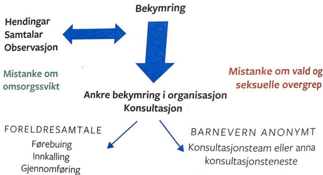
Figur 1: Bekymringsplan (Nordhaug, 2018, s. 68).

man skal gjøre noe med, består av flere faser: observasjon, konsultasjon og samtale med leder og barn (Nordhaug, 2018, s. 69). Slik det kommer frem i figur 1, finnes det tydelige retningslinjer for hvordan man skal gå frem ved bekymring. Når man har tilstrekkelig dokumentasjon, skal man ut ifra alvorlighetsgraden av bekymringssaken, enten arrangere foreldresamtale eller kontakte barnevernet.