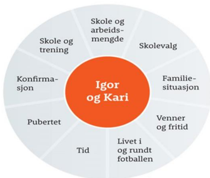
Figur 2: Arenamodellen og ungdommen (Larsen, 2011, s.33).

Arenamodellen, figur 2 syner eit utval faktorar som kan påverke ungdommen i- og utanfor fotballen. Trenarar har mykje av ansvaret for spelarane i ein treningskvardag, og det er viktig å ha ei heilheitsforståing av ungdommen (Larsen, 2011). Ikkje-idrettslege faktorar er noko som kan ta mykje tid og vere utfordrande, til dømes kan kombinasjonen mellom skule, fritid og fotballen føre til eit tidspress. Familie og hendingar eller utfordringar i nære relasjonar kan påverke ungdommen, i tillegg til personlege utfordringar (Larsen, 2011). Sjølv om kvar spelar har ei individuell livsverd er det nokre likskapar blant ungdommane (Seippel, Sisjord & Strandbu, 2016). Med støtte frå andre studiar kan arenamodellen hjelpe oss til å forstå kva som påverkar ungdommane. Og ved at klubbar og trenarar er merksame på dette, og nyttar det for å legge til rette for eit godt tilbod tilpassa ungdommen sine interesser, ynskjer kanskje fleire å vere med lenger.