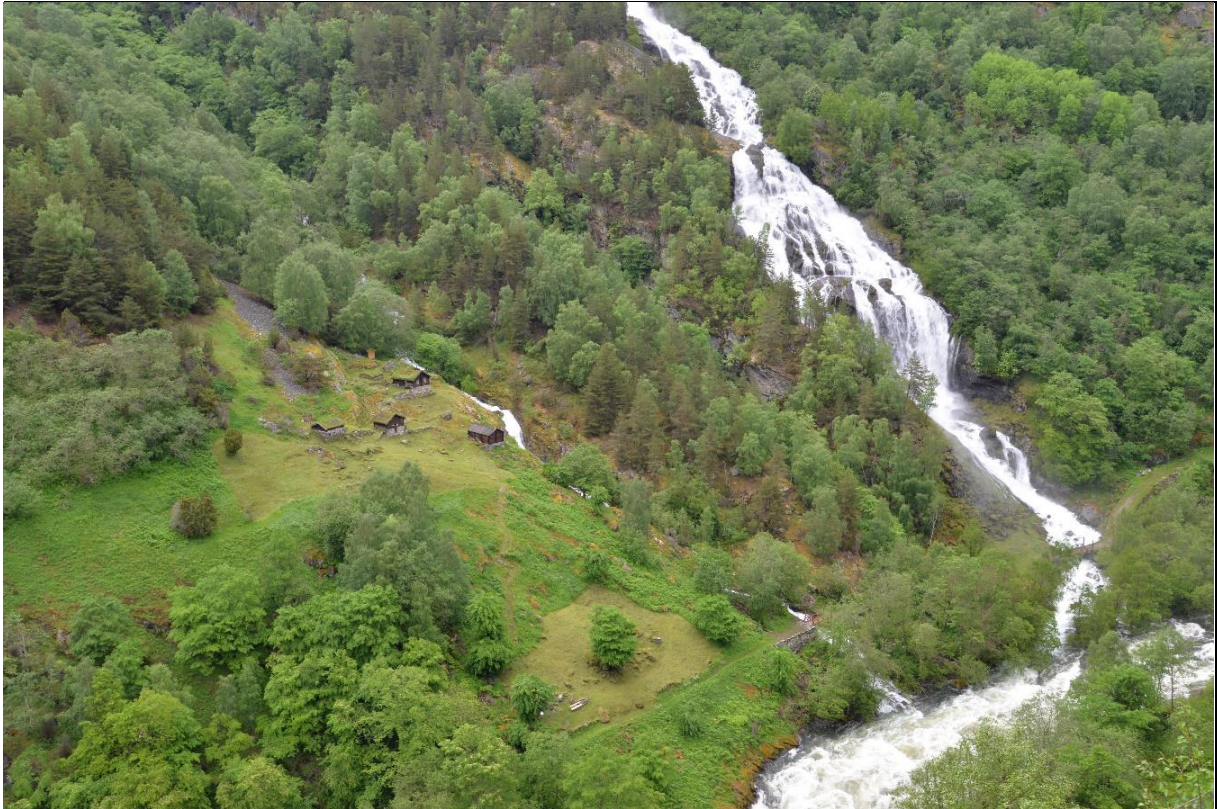
Fig. 41. Husmannsplassen Galdane som ligger ved den gamle Kongevegen utgjør et autentisk og helhetlig kulturmiljø. Innmarka skjøttes og bygningene holdes ved like av Lærdal kommune.

som egner seg for det kunne stelles med maskinelt redskap dersom slått utføres til riktig tidspunkt. Ny redskapsbruk kan da kombineres med bruk av tradisjonelle redskap som langorv (bratte bakker) og stutturv (inntil steiner, bygningsmurer, rydningsrøyser og andre tekniske anlegg). Meningen er å gjøre skjøtselen så enkel som mulig, men basert på historiske føringer og økologisk kunnskap.