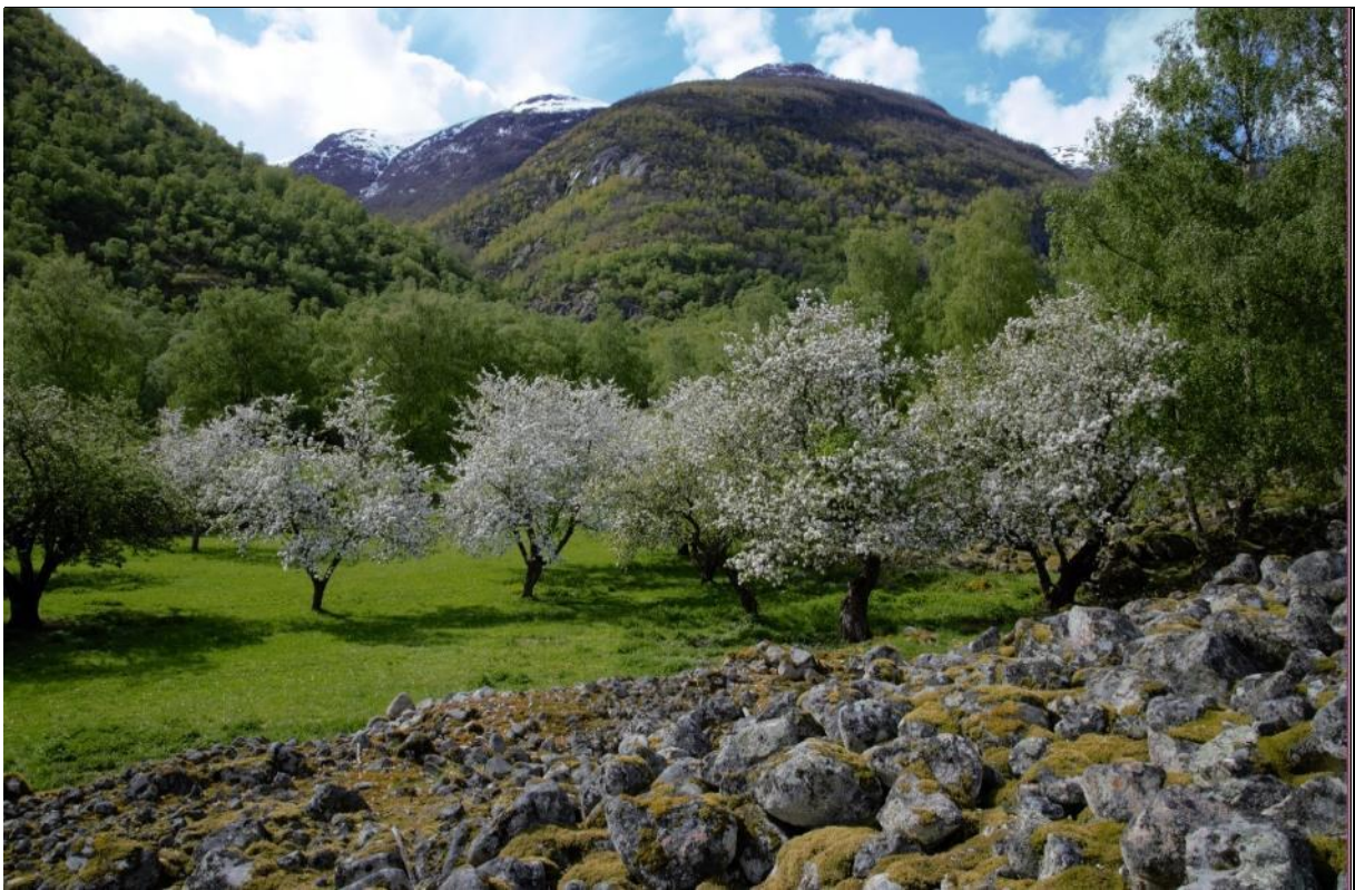
Fig. 46. Gamle frukthager kan være viktige genbanker.

Einer Einer har lange tradisjoner som nytteplante og har mange ulike vekstformer (se Austad & Hauge 1990) og har hatt en omfattende og allsidig bruk opp gjennom tiden. Einer er en av våre mest vanlige viltvoksende arter og trives under de fleste klimaforhold og på ulike typer av jordsmonn. Den er imidlertid svært lyskrevende og trives dårlig i tett skog. Avhengig av vekstform har den vært mye brukt til staur og gjerdemateriale (Høeg 1974). Det sies at einerstolper varer i 100 år. Greiner med bar har vært brukt til risgard og stikkagard (Austad et al. 1993). Samlet medførte dette til at eineren ble sterkt beskattet. Selv om einer i uår også har vært brukt til fôr, beiter dyrene den ugjerne, dvs. planten er beiteprefererende, og kommer tidlig inn på beitemarker dersom omfattende oppslag ikke blir ryddet eller andre skjøtselstiltak ikke blir gjennomført. Beitearealene vil da reduseres og beitekvaliteten forringes enten ved at det blir for tette oppslag av einer og ved at lauvtrær gradvis vil invadere beitemarka. Der en ønsker en naturbeitemark med einer og hvor einer utgjør et problem,- er det beste, men mest arbeidskrevende tiltaket å tynne ut eineren manuelt med håndsag/motorsag, frakte vekk materialet for så å brenne det på dertil egnet sted. Der hvor eineren ønskes bevart er det også svært viktig å rydde/tynde ut andre lauvtrær som gir for mye skygge.