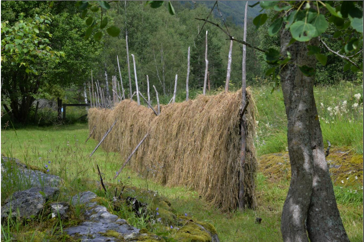
Fig. 26. Styvingstrær og hesjer var tidligere en vanlig kombinasjon i lauvengene. Dette har blitt stadig sjeldnere. Her fra Nese.

Visuelle karaktertrekk: Lauvengene har et spesielt uttrykk og skiller seg ut fra omgivende skog og beitemark. Feltsjiktet er gjerne ryddet for stein og har en jevn markoverflate, og trærne har styvingsspor. Lauvengen har en struktur som kan minne om parkområder, blant annet er feltsjiktet grasrikt, tråkktålende og slitasjesterkt. En lysåpen struktur med et spredt tresjikt gjerne med skulpturelle enkeltrær er med på å forsterke en særegen kulturmark. I tillegg har lauvenga gjerne et høgt biologisk mangfold.