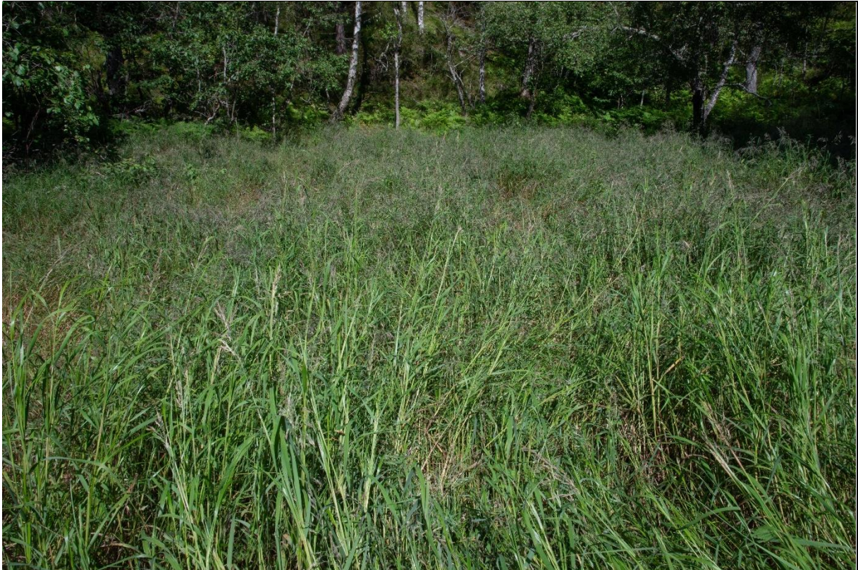
Fig. 16. Opparbeidet slåttemark/myr på Tråve dominert av skogrørkvein.