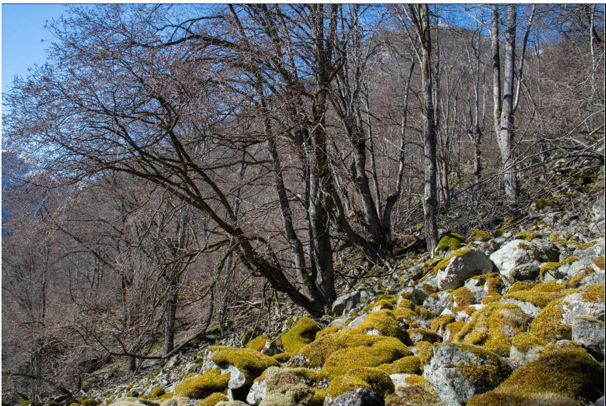
Fig. 35. Navskog med styvingstrær av alm og lind er sjeldne i Lærdal. Her er imidlertid et område med tidligere høstingsskog på Saue.

Definisjoner: I NiN (Miljødirektoratet 2018) vedr. kartleggingsinstruks av viktige naturtyper for naturmangfold finner vi høstingsskog under «Fastmarksskogsmark». Høstingsskog kan være en tilstandskategori under flere ulike skogstyper. Den blir beskrevet på følgende måte: «Høstingsskog er områder der trærne jevnlig har blitt høstet ved styving eller stubbehøsting til husdyrfôr, produksjon av bast/reip eller emnevirke samt til ved. Høstingsskog er dominert av lauvtrær og kan være beitet og ha mindre partier med spor etter tidligere slått. Den typiske høstingsskogen finnes på grov ur i bratte fjordlier og i sør- og vestvendte hellinger på noe finere substrat med et spredt feltsjikt som dekker <50% av arealet».