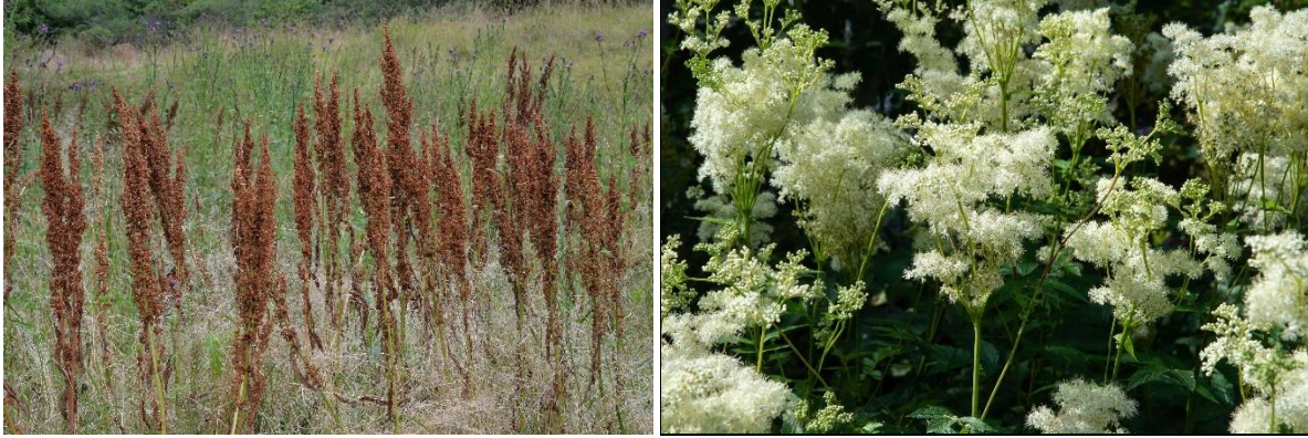
Fig. 47ab. Høymol tv. og mjødurt th. Høymol er en næringskrevende plante som fort kan bli dominerende på slåttemark og naturbeitemark som ikke slås eller beites. Den er kraftig og konkurransesterk og påvirker det biologiske mangfoldet på en uheldig måte. Mjødurt er en kiselholdig urt som er dårlig likt av beitedyr. Den formerer seg både ved frø og vegetativt. Der den først etablerer seg er den vanskelig å bli kvitt.

Vanlig høymol (fig. 47a) har mange steder blitt et problem både på innmarksenger som beites, men særlig på åkerareal som blir liggende brakk. Høymolartene er kraftige, flerårige urter med stor frøproduksjon. Frøet kan ligge lenge i jorda uten å miste spireevnen. Planten sprer seg også vegetativt. Høymol er dårlig likt av beitedyr og blir stående igjen på beitemark hvor den kan utvikle seg videre. Høymol har tidligere vært brukt som nytteplante, både som droge (til medisinsk bruk) og som matplante. Høymol trives helst på fulldyrka, næringsrik, frisk, nitrogenholdig jord. Planten danner en mengde frø, opp til 9000 frø per plante (Korsmo 1954). Høymol er uønsket på engarealene. Den gir også dårlig fôr. For å redusere oppslaget av høymol er det viktig at den blir slått før den setter frø. Ellers er oppløying, alternativt brakking nødvendig der hvor planten har blitt dominerende. Mekanisk rydding/opprykking av planten, et tiltak som mange bønder bruker, er problematisk da små rotdeleler kan overleve og danne nye planter. Det er viktig å redusere spredningskjerner av høymol slik at den ikke sprer seg til nærliggende enger. Forskning om bekjemping pågår.