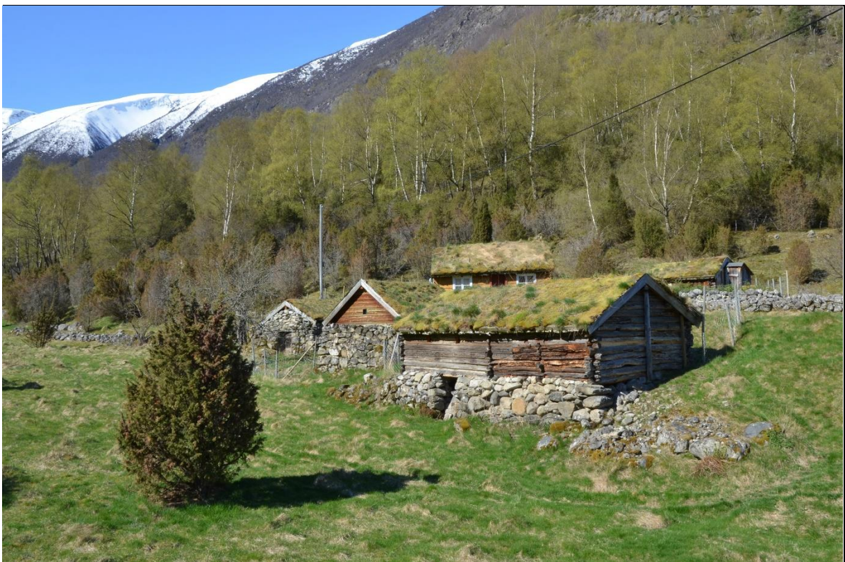
Fig. 3. Førindustrielle kulturlandskap kan ha bevart strukturer og kulturminner som er svært sentrale for å kunne forstå forhistorien og utviklingen i landbruket. På husmannsplassen Halabrekka er sporene etter tradisjonelle element og driftsteknikker ennå tydelige i landskapet.

Kulturlandskaps-strukturen kom slik til å bestå av en mosaikk av åker og eng på innmark, av utmarksslåtter, havnehager, lauvings- og risingskoger i liene, og av stølskvier, fjellbeiter og myrslåtter i fjernere utmark og på fjellet. En satsning på flere matkilder og på ulike fôrtyper var vanlig. Lauvtrærne ble gjerne sterkt utnyttet; til brensel, til emnevirke og til fôr (fig.3.).