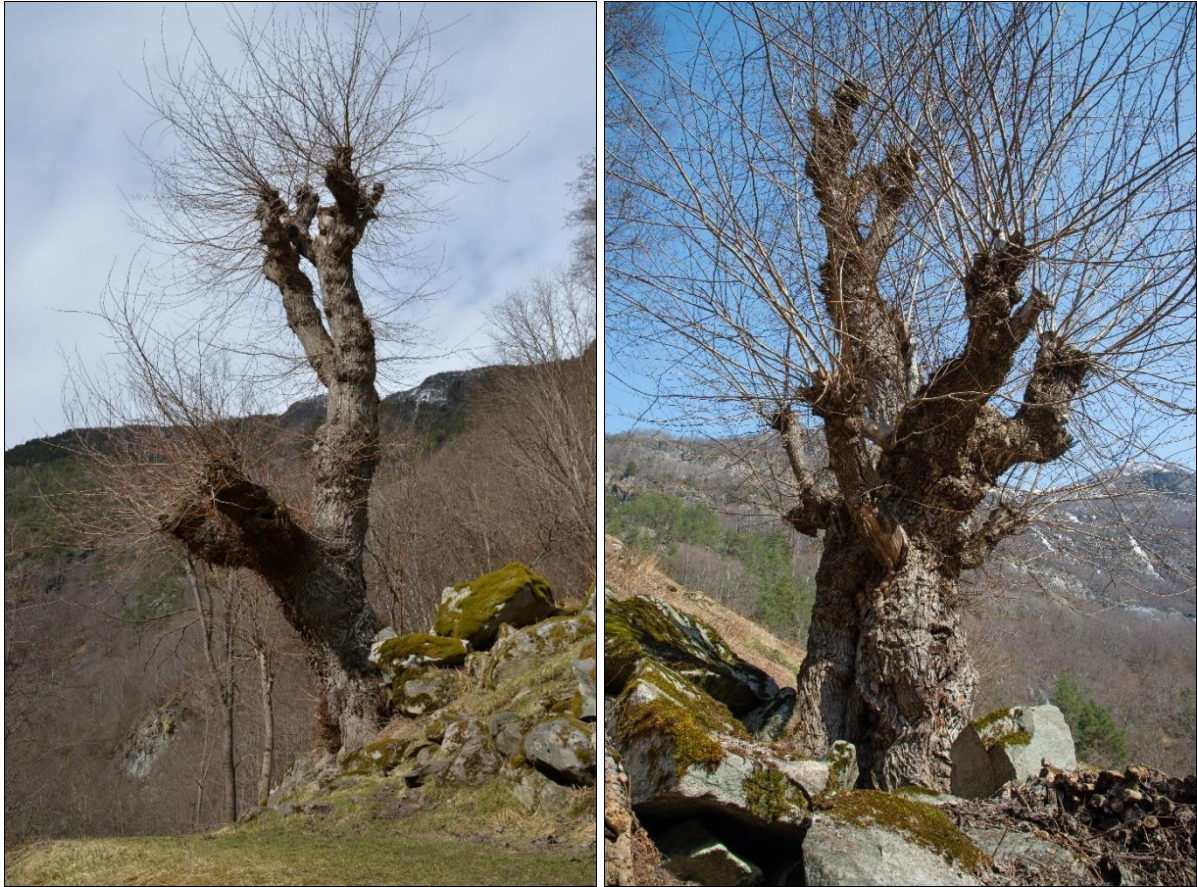
Fig. 20ab. Styvingstrær av alm ved Galdane.

Stift brugelige Maade » (Schübeler 1886: 470). Både høstingsskoger og hagemarker dominert av styvingstrær av bjørk er ennå et vanlig syn mange steder i Lærdal.