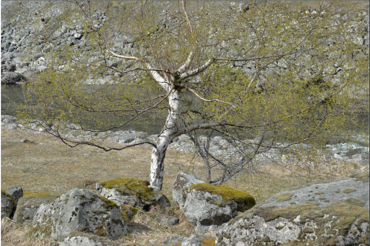
Fig. 45. Rekruttering av nye styvingstrær er viktig for å sikre kontinuiteten i tresatte kulturmarker.

Restaurering og skjøtsel av alm: Beskjæringsstedet på treet må være minimum over beitehøgden til husdyrene. Vanligvis blir dette målt etter storfé, ca. 2-2,5 m over markoverflaten. Almen ble tradisjonelt beskåret slik at det utviklet seg en hovedstamme etterhvert med flere større sidegrener. Slik kunne trærne få ulike etasjer og almenstuvener kunne med årene bli ganske høge. Alm kan styves med intervall på 7-10 år dersom tiltaket bare er av bevarende karakter. Beskjæring i bladløs tilstand (vinter) forenkler arbeidet, og fører også til mindre slitasje og skade på underlaget. Alm kan styves fram mot april måned og tåler full tilbakeskjæring av alle greinene i alle fall i ung alder. En kan kappe et par cm ovenfor forrige beskjæring (styving). En bør unngå for store kappflater. Skråskjæring vil sikre at regnvatn renner av. Det er viktig å etablere en form med et greinsystem som danner ulike nivå i treet. Almtrær kan med årene bli svært gamle og innhule. En må derfor være forsiktig dersom det er aktuelt å restaurere gamle styvingstrær av alm.