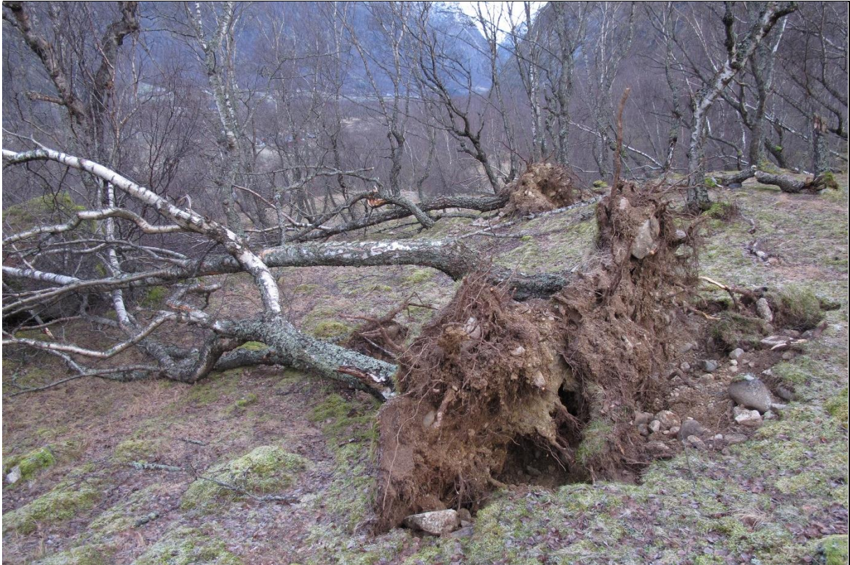
Fig. 31. Styvingen fører til at treet utvikler mange greiner og en vid krone. Uten jevnlig tilbakeskjæring vil trekronene bli svært vide og rotvelt kan oppstå i kraftig vind.

Utvikling og trusler: Bjørkehagene har i dag liten økonomisk verdi som landbruksareal og de fleste trues av gjengroing og forfall. Mangel på husdyrbeiting fører til endring i feltsjiktvegetasjonen. Uten jevnlig høsting (lauving og rising) blir trekronen på frittstående gamle styvingstrær svært vid og tung og ved sterk vind får vi ofte rotvelt (fig. 31). Uttak av grus og sand særlig i forbindelse med vegutbygging er en stor trussel for bjørkehagene i tillegg til treslagsskifte.