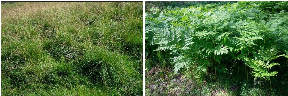
Fig. 48 ab. Sølvbunke er en kraftig grasart som danner mange sterile bladskudd og tette tuer. Einstape og andre storbregner er problematiske gjengroingsarter på nedlagt kulturmark. Særlig blir einstape fort dominerende og konkurrerer ut andre arter. Da bregnene formerer seg med underjordiske rotutløpere (rhizomer) er det også vanskelig å bli kvitt dem når de først har etablert seg.

Det er i første rekke einstape som utgjør et stort problem på gamle kulturmarker (fig. 48b). Denne storbregnen kan raskt utvikle seg på tidligere slåttemark og på naturbeitemark, men trives ellers i ur, på berg og på marginal mark. Jordstenglene/rhizomene (underjordiske utløpere som bregnene formerer seg med), ligger forholdsvis grunt og nesten vannrett i jordlaget. Selv om biomassen fjernes ved slått eller andre skjøtselstiltak, vil planten overleve under jorda. Da bregnen også produserer «alleopatiske» kjemikalier fra rhizomet hindrer den kolonisering, spiring og vekst av andre planter (Barber 1990). Ellers vrakes einstape av beitedyr og planten får raskt overtak på beitemark og annen grasmark som ikke slås. Bregnen er egentlig giftig og kreftfremkallende for beitedyr ifølge Jarrett (1982). Slått i vekstsesongen et par ganger hvert år i 3-4 påløpende år kan være et aktuelt tiltak (Korsmo 1954). Dette er også tilrådd skjøtselstiltak mot einstape i dag. Forsøk med bekjemping av einstape er ellers utprøvd i kystlyngheiene hvor planten har blitt et stort problem. Det henvises til Ekelund & Måren (2003), Måren & Ekelund (2005), Måren et al. (2005), og til Norderhaug et al. (1999) for mer informasjon.