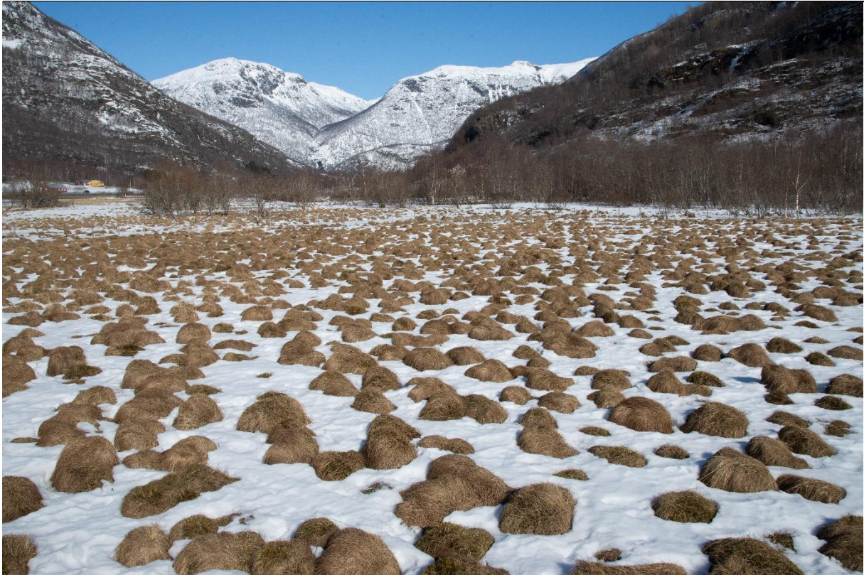
Fig. 14. Stolpestarr i karakteristiske tuer på våtmark som tidligere ble slått. Våtmarka er vanskelig å skjøtte.

Typer: I Lærdal kan bare en våtengtype defineres. Imidlertid kan våtengen ha ulikt uttrykk alt etter bruk og suksesjon. Ved elvebreddene er våtengen generelt treløs og med et høgt innslag av starr- og sivarter, mens områder mot dyrka mark kan ha kantsoner med busk- og trevegetasjon. Feltsjiktvegetasjonen kan også være anderledes her.