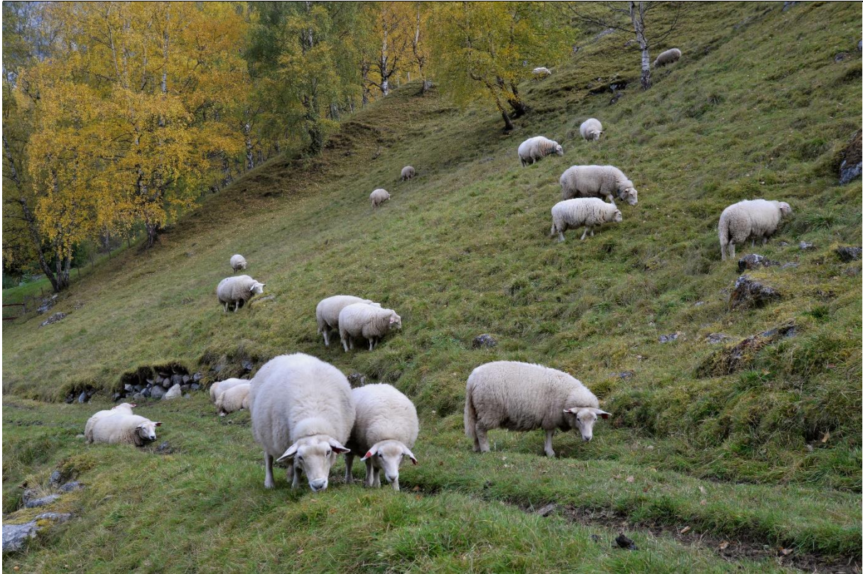
Fig. 42. Naturbeitemark er en karakteristisk kulturmarkstype i Lærdal som vi vanligvis finner på tørkeutsatt mark i skråninger. Småfé er viktige for å hindre gjengroing og vedlikeholde marka og artsinventaret.

Det er også viktig at en tar hensyn til kulturminnene ved skjøtselen av kulturmarkene. Ved bruk av tungt maskinelt redskap kan både gamle veger og steinstrukturer i kulturmarkene bli utsatt. Spesielt gjelder dette vegfundament, klopper og bakkemurer som ikke er dimensjonerte for slike belastninger. En må kontrollere fundamentet i murene og legge på plass igjen utraste steiner. Det er også viktig å rydde/slå helt inntil steinoppleggene. Her har det lett for å etablere seg kraftige gras og urter, og etter hvert også storbregner, busker og trær.