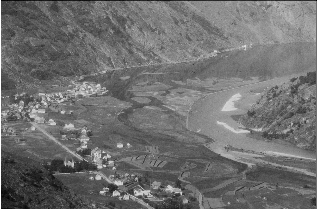
Fig. 12. Gammelt foto av Lærdalsøyri, Lærdalselvi og Grandane fra ca. år 1900 før de store kanaliseringssprosjektene og utfyllingene startet.

Bruk og historie: Både strandenger og deltasletter har gjennom lang tid vært utnyttet til slåtteland og husdyrbeiting (fig. 12). Jevnlig slått var nødvendig for å opprettholde slette slåtteareal uten tuedanning. Tuets underlag skjemte lett ut ljåen. Dessuten er flere av de tuedannende artene som f.eks. sølvbunke, stive og dårlige beite- og fôrgras i frisk tilstand, men er godt fôr tørket.