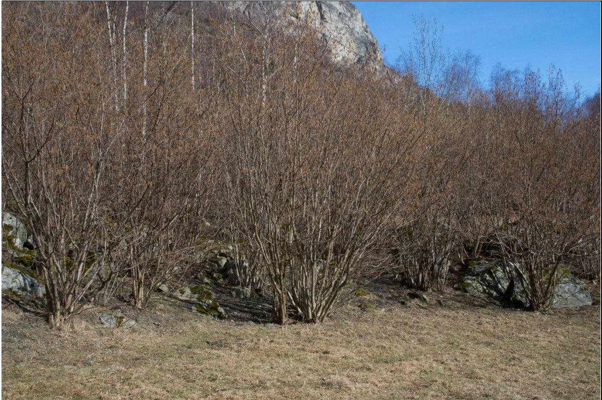
Fig. 40. Hassel var et viktig treslag og kunne brukes både til nøtteproduksjon og tønnebånd. Trærne ble stubbehogget for å få opp så mange stammer fra basis som mulig. Dette har gitt hasselen et karakteristisk utseende.

Utbredelse/lokalisering: Områder hvor en tidligere har høstet gråor som «snelskog» er i randsonene mot utmark på Hauge (figur 39) på elveøyrene ved Galdane, og ellers på raskjegler oppover i hoveddalen. Hasselbestand er spesielt godt utviklet i lisisiden ved Saue, ved Husum og også i overkant av mange raskjegler for eksempel ved Hunderi, Molde og Ljøsne.