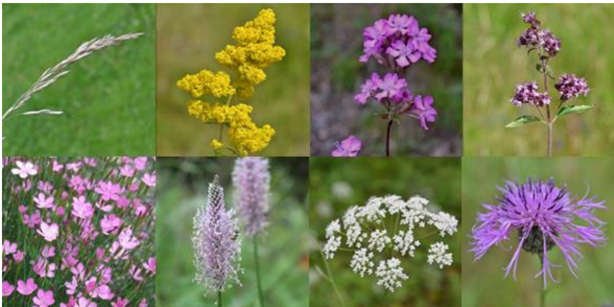
Fig. 9. Arter som er spesielle for tørr baserik slåttemark i Lærdal: dunhavre, gulmaure, engtjæreblom, bergmynte, engnellik, dunkjempe, gjeldkarve og fagerknoppurt.

Utvikling og trusler : Gjennom historien har slåttemark vært, og vil fremdeles være, om vi tar vare på dem, viktige «levende genbanker». I tillegg er de bærekraftige økosystem som har vært et nøkkelelement i norsk landbruk i flere tusen år. I løpet av 1900-tallet har de likevel endt opp som en av de mest truede naturtypene våre (Direktoratet for naturforvaltning 2009). Nedenfor er beskrevet noen av de mest vanlige truslene som slåttemarkene er utsatt for.