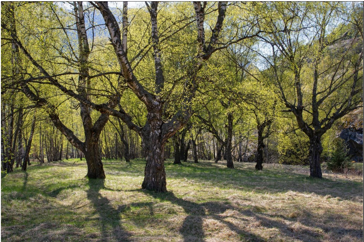
Fig. 25. Lauvengene har et spredt tresjikt helst av edellauvtrær, men også av bjørk. Et jevnt feltsjikt gir gode forhold for slått. Jevnlig tilbakeskjæring av trekronene sikrer gode lysforhold for feltsjiktet.

Definisjoner: I NiN (Miljødirektoratet 2018) vedr. kartleggingsinstruks av viktige naturtyper for naturmangfold finner vi ikke lauveng nevnt hverken under slåttemark eller under hagemark. I Norderhaug et al. (1999), brukes lauveng om slåttemark med spredte lauvtrær karakterisert av flerbruk (høsting av både feltsjikt og tresjikt). Også i «Handlingsplan for slåttemarker» inkludert lauveng (Direktoratet for Naturforvaltning 2009), er lauveng definert som tresatte arealer som blir regelmessig slått. På fakta-ark utarbeidet til DN-håndboken (Svalheim 2014), blir lauveng definert som semi-naturlig eng med slått som grunnleggende hevdform sammen med beskrivelser av tre- og busksjiktet. I ny rødliste for naturtyper 2018 vurderes naturtypen slåttemark (inkludert lauveng) som kritisk truet (critical threatened CR).