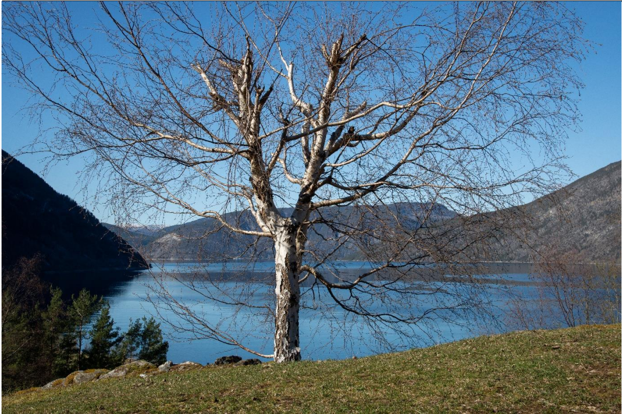
Fig. 22. Nystyvet bjørketre i Erdal. Her har man sikret gjenvekst ved å la store deler av kronen være igjen til senere år. Greinene høstes over 2-4 år.