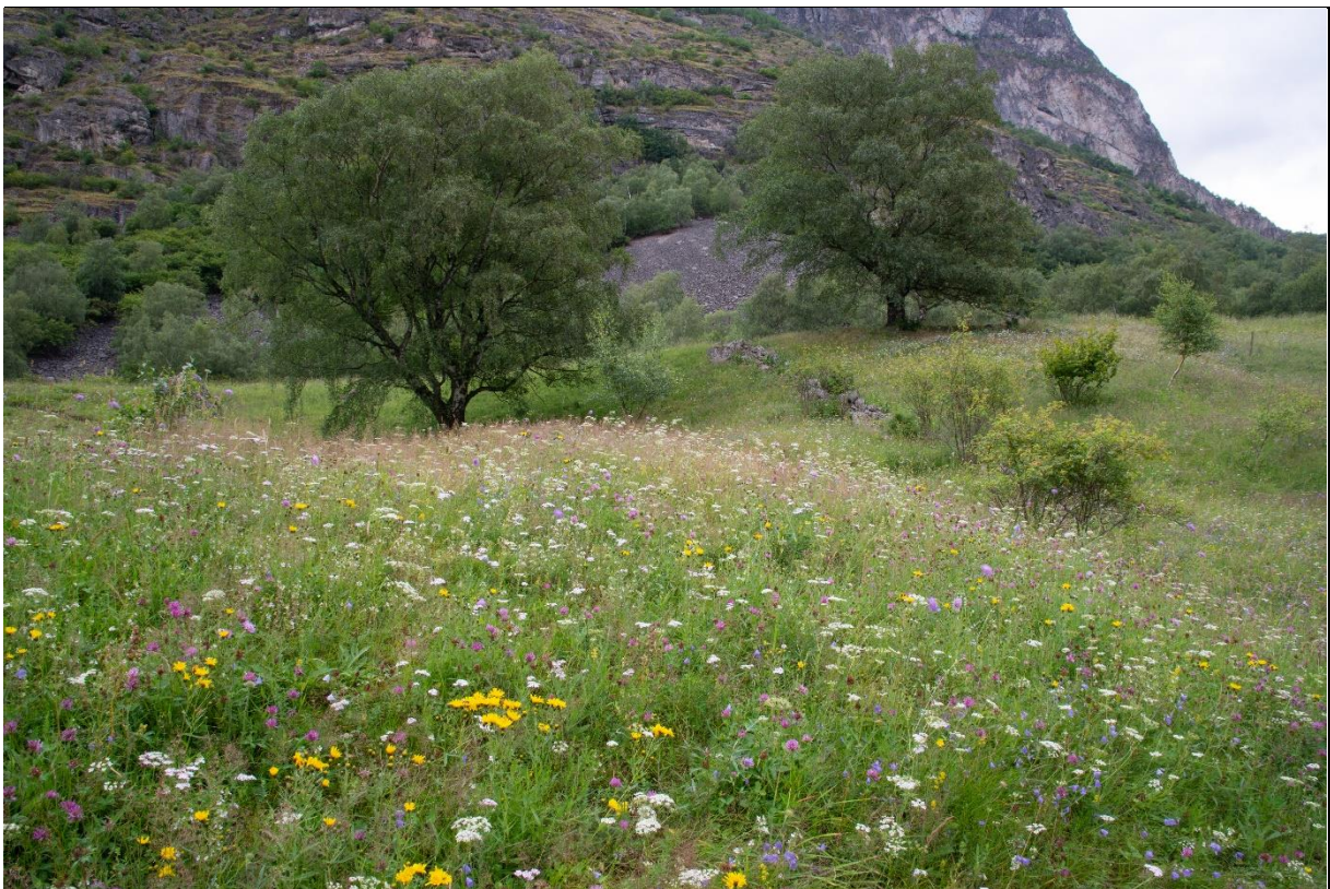
Fig. 24. Lauvengene har gjerne en høy produksjon og slått med vår og høstbeiting kombinert med lauveng hvert 5-6 år. Artsdiversitetene kan være stor. Her fra Molde.

Å ha bærende trær (for produksjon av fôr, nøtter eller emneved) på slåttemarka, ga bonden en god avkastning, samtidig som fôrproduksjonen kunne sikres også i vanskelige år. Sviktet grasavlingen, var det alltid lauv å høste. I tillegg til lauvfôr var det også mye ved som en fikk fra styvingstrærne. I tillegg blir jordsmonnet tilført næringsstoffer gjennom lauvfall de årene trærne ikke blir høstet, noe som kommer vegetasjonen i feltsjiktet til nytte, og styvingen fører også til interessante økologiske prosesser (Austad et al 2003b).