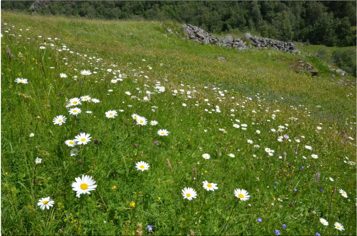
Fig. 4. Artsrike slåtteenger finner vi blant annet på Nevlo i Borgund. Her vokser prestekrage, gulmaure, firkantperikum, blåklukke, dunkjempe, engsoleie og rødkløver.