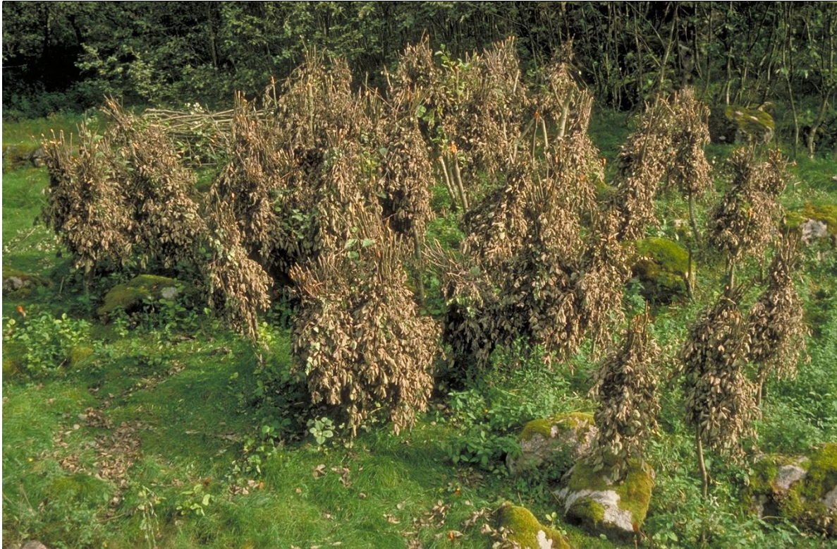
Fig. 39. Gråor var et av de vanligste treslagene i Lærdal og ble mye brukt til husdyrfôr. Ofte ble lauvkjervene hengt opp på avkuttede stammer til tørk.

byer som for eksempel Bergen. Vi har også en tredje type av høstingsskog som tidligere var svært vanlig; skavskog eller morkaskog. Skav ble tidligere mye brukt som husdyrfôr. Det var særlig ung selje, ask og rogn som ble brukt som skavved som måtte hentes fra bratte lier og utmark. Skaving ble ellers gjerne kombinert med vedhogst.