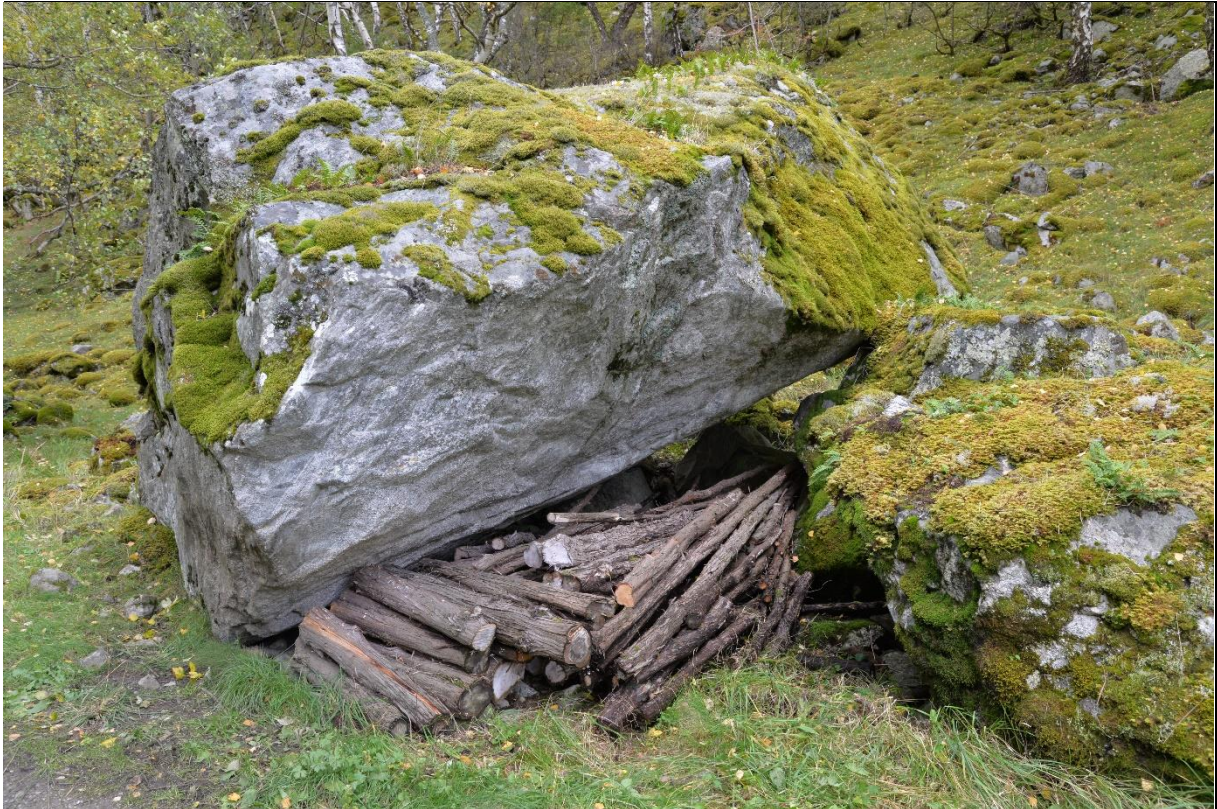
Fig. 33. Einermateriale ble brukt til gjerdestolper og hesjestaur på grunn av god bestandighet mot råte og lang levetid. Under hellere og steiner og i gamle utløper kan en ofte treffe på større eller mindre lagre av einerstaur.

Bruk og historie: Einerveden er hard og inneholder eteriske oljer. Dette gjør at ved og kvister har sterk duft og er bestandig mot råte og sopp-angrep. Einervirke og einerbar har derfor vært brukt til ulike formål opp gjennom historien, utførlig dokumentert av flere (Bugge 1921, Vreim 1937, Høeg 1981, Gjærder 1977, Skre 1984). Den viktigste bruken var likevel anvendelsen av stammene til gjerdevirke og staur (fig. 33). I de gamle lovene (Frostatingsloven, Gulatingsloven og Landsloven, ca. 1270) finner vi opplysninger om ulike gjerdetyper basert på einervirke. På 1500-tallet var einerstaur en viktig eksportartikkel (Bugge 1925-1932), og fremdeles på 1970-tallet var det mye salg av einervirke fra Sogn. Det var særlig den rettvokste søyleeiner-formen som var mest verdifull. Det var derfor vanlig at bøndene lot søyle-einere få stå på beitemarka, mens krypende og buskformede einere ble fjernet. I tillegg ble gjerne de laveste greinene fjernet av gårdbrukeren, dersom ikke beitedyrene alt hadde gjort det, en praksis som var vanlig til langt ut på 1980-tallet (Austad & Hauge 1990). Slik ble veksten til eineren konsentrert til høgden og gårdbrukeren fikk hurtigere produsert egnet gjerdevirke, mens beitemarka fikk godt med sollys og nedbør.