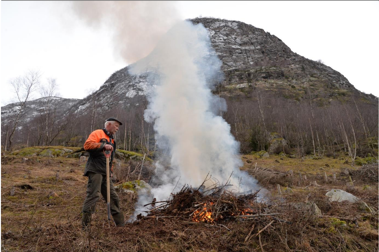
Fig. 44. Rydding av lauvkratt med oppsamling av kvistmateriale må fjernes fra kulturmarkene. Vanlig er det å lage til steder hvor dette kan brennes. Her må man passe på at brannfleckene ikke ødelegger verdifull vegetasjon.

Slåttemarkene må slås til vanlig (tradisjonelt) tidspunkt og naturbeitemarkene beites. Slåtten bør helst skje i slutten av juli, men spesielle værforhold som påvirker blomstringstidspunkt og frøsetting kan gjøre det aktuelt at slått eller etterbeiting skjer på et noe tidligere eller litt senere tidspunkt. På slåttemarker er det også viktig hvordan graset tørkes. Er det tørt vær kan graset overflatetørke i 1-2 dager på marka, noe som er positivt da frø kan falle av og spres. Avslått gras må imidlertid ikke bli liggende for lenge på marka. Det viktigste er at graset/høyet blir fraktet bort fra enga og ut av området. Avslått materiale som ikke skal brukes til fôr må ikke deponeres på tilfeldige oppsamlingssteder da dette vil gi en ekstra gjødslingseffekt slik at næringskrevende arter vil få gunstige vilkår. Graset (høyet) kan eventuelt brennes. Dersom skjøtselstiltakene som gjennomføres skal hindre frøsetting av for eksempel kvitbladtistel, mjødukt og høymol, bør det være to slåtter; en tidlig på forsommeren før frøsetting, og en slått senere i august for å fjerne mest mulig av biomassen. Etterrydding av naturbeitemarker kan være nødvendig nettopp for å hindre blomstring og frøsetting av uønskede arter og for å hemme disse i videre vekst.