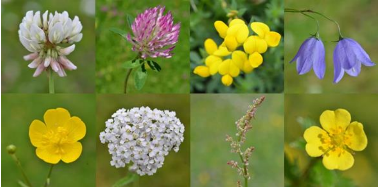
Fig. 27. Lyskrevende engarter (ubikvister) som er vanlige i de fleste kulturmarkstypene i Lærdal: hvitkløver, rødkløver, tiriltunge, blåklokke, engsoleie, ryllik, engsyre og tepperot.

Ved styvingen blir det er misforhold mellom krone og rotnett. Fotosyntesen blir i de første årene utilstrekkelig til å holde liv i et stort rotnett, og treets konkurransevne svekkes også de første årene etter høstingen, noe som feltsjiktet vet å gjøre seg nytte av, før treet på nytt bygger seg opp med kraftig krone og tilsvarende røtter. Sammen med god lystilgang stimuleres økologiske prosesser i jordsmonnet, noe som kan resultere i hurtigere omdanning, og være en pådriver for høy produksjon (Austad et al. 2003b). Tresatte jordbruksareal er ellers kjent som «agro-forestry system» blant annet beskrevet hos Daizy Rani Batish et al. 2008. De økologiske prosessene som følger med jevnlig høsting av tresjiktet i høstingsskoger, hagemarker og lauvenger og som påvirker både rotnett og mikro-organismer i jordsmonnet, er ennå ikke godt nok undersøkt. Prosessene er spesielle og annerledes enn i en skog og i et engsystem (Gulvik et al. 2003).