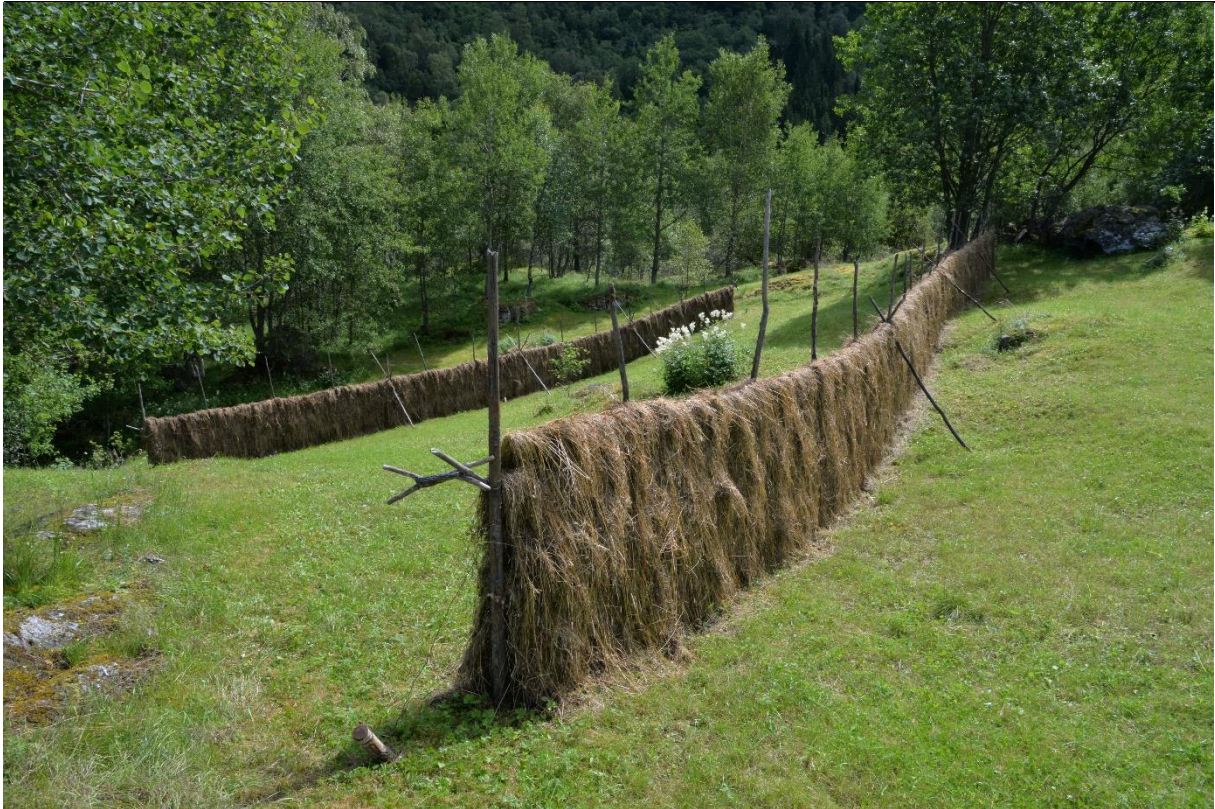
Fig. 6. Hesjer oppsatt til tørking av gras var tidligere et vanlig syn i Lærdal. Nå er det bare på enkelte gårdsbruk at vi ennå kan finne slike innslag.

Økologi: Stor næringskapital blir ført bort når vegetasjonen høstes og/eller beites. I bratte skråninger og lisdaler slik vi finner det i Lærdal vil imidlertid næringsstoffer kunne bli tilført med sige- og overflatevann. Husdyr omfordeler næringsstoffer. Dyr kan utnytte overskuddsproduksjonen i felt- og busksjiktet og gjødsle opp marka særlig på mye oppsøkte liggeplasser. På den annen side kan overbeite føre til utarming og stadig lavere produksjon. Særlig utover 1800-tallet vet vi at utnyttningen av naturressursene var særlig omfattende og intensiv. I åpne kulturmarker uten tresjikt blir det også mindre skygge, større solinnstråling og varmere og tørrere forhold om sommeren. På grunt jordsmonn og i nedbørfattige områder som i Lærdal kan tørre somre føre til svak produksjon på slåttemarken som ikke blir kunstig vannet.