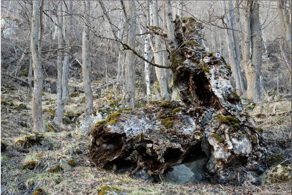
Fig. 38. Edellauvskogsreservatet på Husum har tidligere hatt innslag av gamle styvingstrær av alm. Nå ligger disse som døde kjemper på skogbunnen mens unge og upåvirkede almetrær gror opp. Slik endres skogsinteriør og artssammensetning i høstingsskogen ved opphør av bruk.

Skjøtselstiltak: Høstingsskogene «navskogene» utfordrer oss. Den omfattende og helst allsidige bruken er i dag stort sett opphørt, og det kan være vanskelig å finne spor etter strukturer, visuelle uttrykk og særpregede vegetasjonssammensetninger, inkl. epifyttvegetasjon, insekts- og fugleliv, som var typisk for høstingsskogene da de var i aktiv bruk. Det er generelt vanskelig å opprettholde slike skoger, og bare unntaksvis vil de kunne bli drevet tradisjonelt, da i tilknytning til kulturhistoriske helhetlige miljøer. Å restaurere gamle styvingskjemper er også et svært utfordrende arbeid. Størsteinet ut og blokkmark vanskeliggjør arbeidet. Styvingstrær av alm vil tåle hard tilbakeskjæring godt, mens gamle bjørkestuver tåler dårlig en kraftig restaureringsbeskjæring. Her vil det være bedre å forme nye styvingstrær av unge bjørker og sikre dem et tilfredsstillende vedlikehold. Imidlertid kan man delvis ta vare på høstingsskogene gjennom rydding av ung lauvskog slik at de gamle styvingstrærne får redusert konkurranse om lys, vann og næring. Også husdyrbeiting med sau og geit kan være et godt skjøtselstiltak der det er interesse for det.