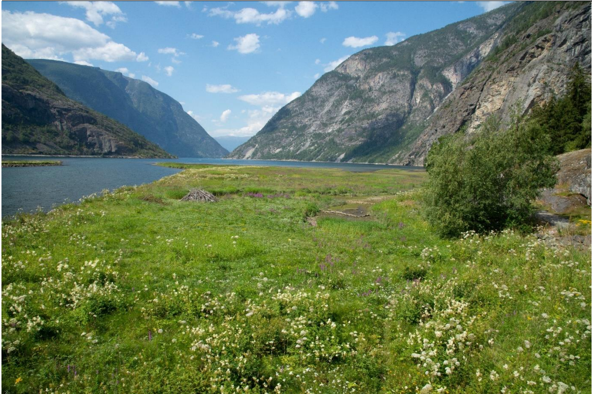
Fig. 13. Restene av strandengene ved munningen av Lærdalselvi.

Utbredelse/lokalisering: Det er ved munningen av Lærdalselvi og nord for Lærdalsøyri på Grandane at vi i dag finner restene etter de tidligere store strandengene i området. Strandengen i Hedler har bevart mye av sitt opprinnelige preg og vegetasjonssammensetning (fig. 13). Engen ble beitet av sau så sent som på slutten av 1980-talet og utgjorde den gangen det største arealet med denne kulturmarkstypen i Lærdal. Strandenga er moderat saltvannspåvirket. Denne enga ligger utenfor UKL området.