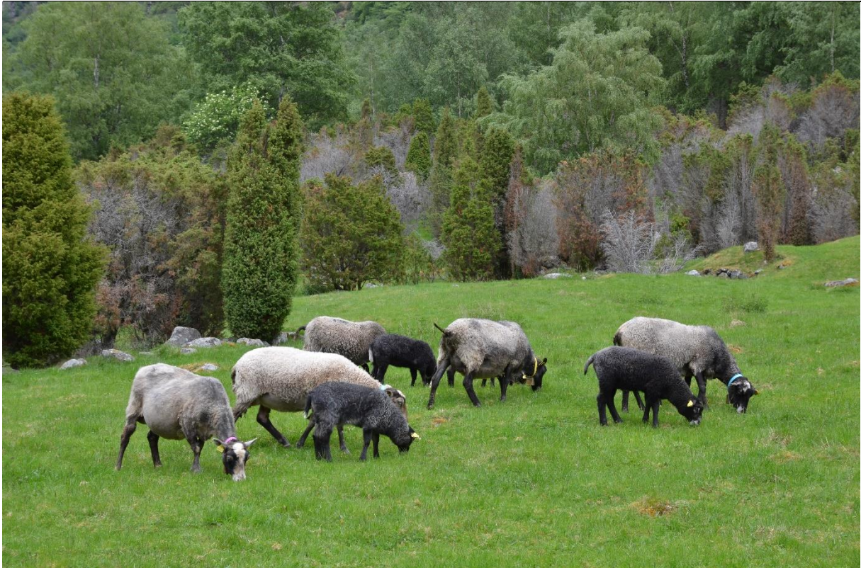
Fig. 34. Eineren kan komme til å vokse tett på beitemark om den ikke tynnes ut. Ved spesielle værforhold om vinteren slik det var i Lærdal i 2011 tørket store deler av einerbestanden ut. Det er viktig å fjerne død og gammel einer og å tynne ut i slike einerhager slik at produksjonsarealene kan utnyttes samtidig som en viktig kulturmarkstype blir tatt vare på.

Biologisk mangfold: Vi finner mange av de samme stresstolerente og lyskrevende grasartene og urtene i einerhagene som vi også finner i slåttemarker og naturbeitemarker. Plantene tåler avbeiting, og opptrækking med åpen jord er viktig for spiring av frø. I tillegg finnes mange planter som er beiteprefererende og beitetolerente. Et høgt innslag av nitrofile arter og planter som på grunn av spesielle egenskaper blir stående igjen etter beitingen, er også vanlige. Einerhagene kan være artsrike.