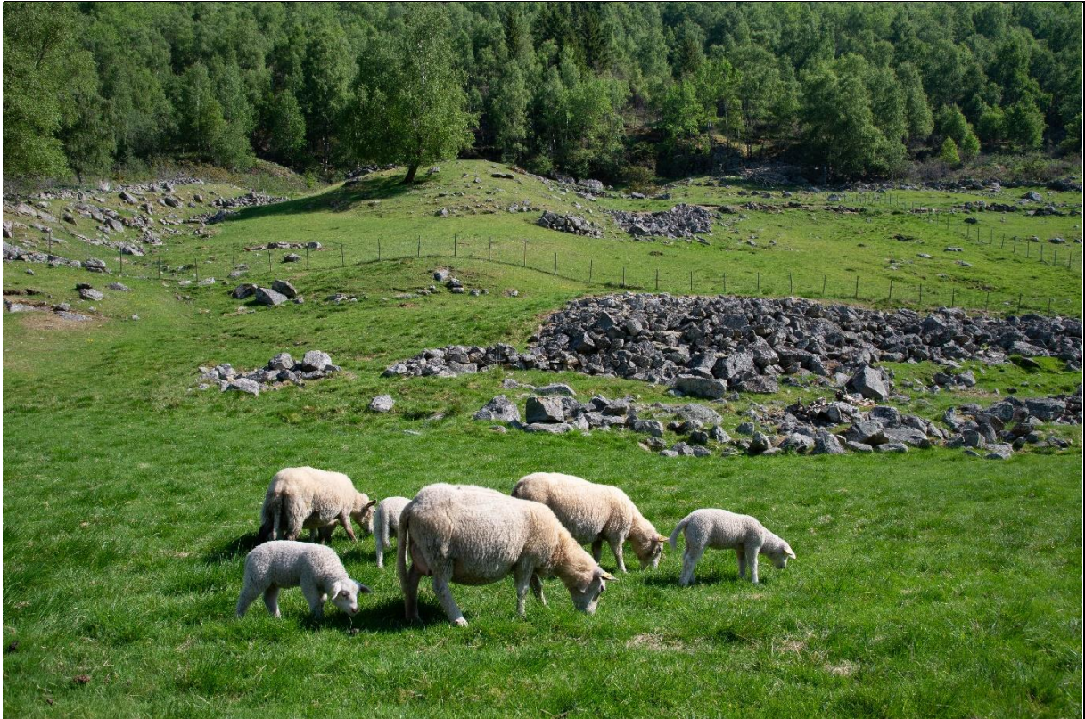
Fig. 17. Det finnes store og små fragmenter med naturbeitemark i Lærdal. Ofte ligger disse i utkanten av innmarksarealene. Stor stein, blokkmark, berghammer og grunnlendt mark karakteriserer naturbeitemarkene som kan ha et høgt arts mangfold.

dukker arter som foretrekker mye nitrogen og fosfor i jordsmonnet opp, som f.eks. brennesle og då-arter (nitrofile arter).