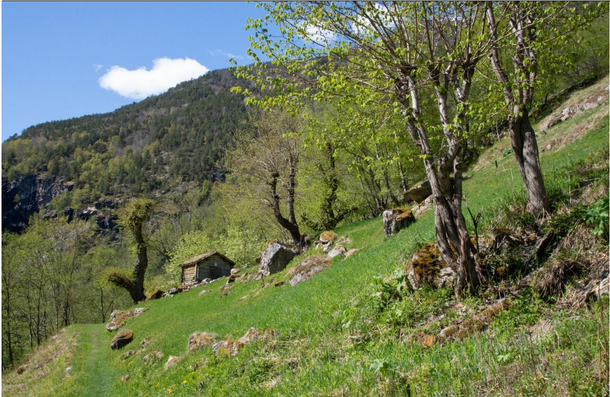
Fig. 23. Det er viktig å ta være på og skjøtte gamle styvingstrær for å ta vare på en viktig kulturtradisjon, men også for at kronen ikke blir for stor for stamme og røtter. I tillegg bør nye styvingstrær tillages. Her fra Galdane.

Utvikling og trusler: Styvingstrærne er i ferd med å forsvinne fra landskapet først og fremst pga. manglende behov for fôr og dermed aktiv drift. Tidligere var lauving, rising og skaving tilpasset annen gårdsdrift. En omlegging av en allsidig gårdsdrift med husdyrhold til mer arbeidskrevende og spesialiserte produksjonsformer som frukt-, bær- og grønnsaker slik som situasjonen er i Lærdal, er vanskelig å kombinere med lauving. Det er derfor få gårdbrukere som lauver og bruker lauv som husdyrfôr her i dag. Den status som lauvtrær tidligere hadde som mat- og fôrtre, er borte. Trærne blir gamle, de forynges ikke og nye rekrutteringstrær blir ikke tillaget. Innhule og råtne trær hogges ned og brukes til ved. Hensikten med styvingen var å øke antall greiner og treets kroneomfang for å øke lauvfôrproduksjonen. Dersom treet ikke høstes jevnlig vil kronen etter noen år kunne bli svært så omfangsrik, og treet vil, særlig dersom det står på grovsteinet substrat, på rasmarek eller i bratte skråninger, lett kunne utsettes for vindfall og rotvelt.