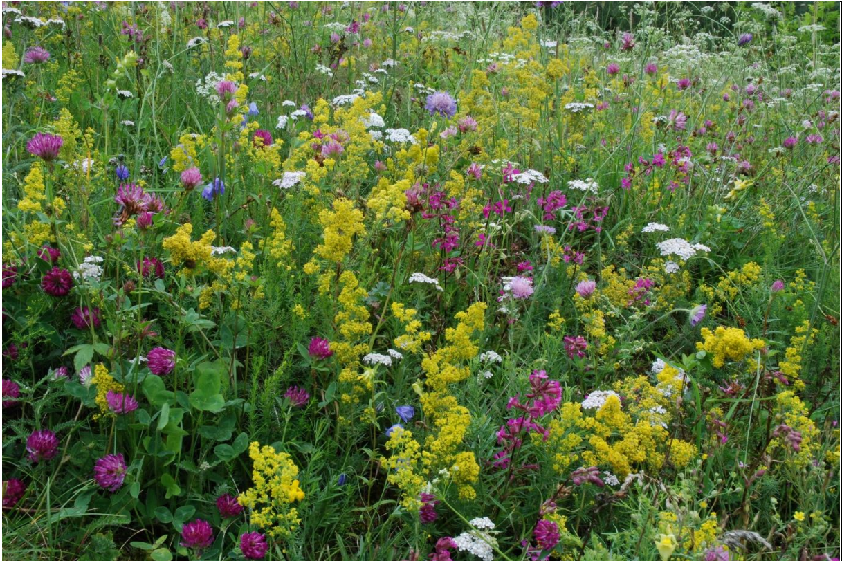
Fig. 8. Artsrik slåttemark finner vi blant annet på Molde. Gulmaure, engtjæreblom, rødkløver og ryllik er fargesterke innslag tidlig på sommeren.

Biologisk mangfold: Slåttemarkene hører til de mest artsrike naturtypene våre, og har stor betydning også for andre organismer enn karplanter. For eksempel har ca. 70 prosent av dagsommerfuglene tilholdssted i åpen engvegetasjon (særlig urterik slåttemark), og flere vadefugler bruker våtmarks- og fuktengområder (tidligere slått eller beitet) som hekkeområder og rasteplasser under trekket. I tillegg har slåttemarken stor betydning for mange truete arter av beitemarksopp. Også mange av våre rødlistede arter (planter og insekter) som nå står i fare for å forsvinne er knyttet til kulturlandskapet og til de slåttebetingete kulturmarkene (Kålås et al. 2010, Henriksen & Hilmo 2015).