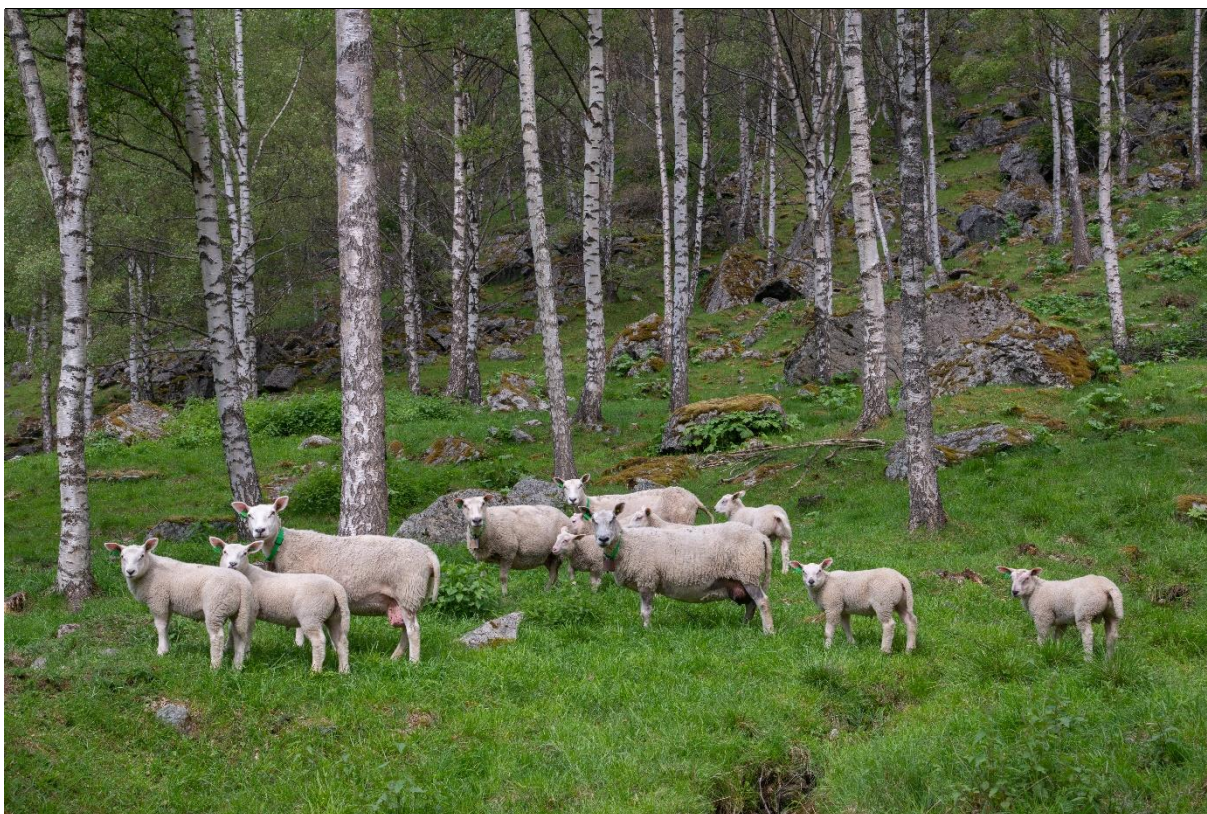
Fig. 28. Bjørkehage på Bjøraker med unge rettvekste bjørketrær.

Sammensetningen av vegetasjonen i feltsjiktet i hagemarkene avspeiler både naturgrunnet og beitetrykket over tid, men beiteprefererende og beitetolerante arter dominerer og er felles for flere typer hagemark. Vegetasjonen er gjerne en mosaikk av lyskrevende gras og urter, og skog- og kantarter. Då-arter, tistler, bringebær og nesle finnes gjerne i tilknytning til tråkk og hvileplasser for beitedyra. Busksjiktet er preget av beitetolerante arter som einer, stikkelsbær og nyperosearter, dvs. arter som enten har torner, brennhår eller som også kan ha kraftig lukt og smak. Karakteristisk for mange av plantene i feltsjiktet er at de har en vegetativ formeringsmåte som sikrer spredning, slik som de fleste grasartene, og urter som jordbær, ryllik og legeveronika, dvs. at de ikke er så avhengige av at frøene blir modne.