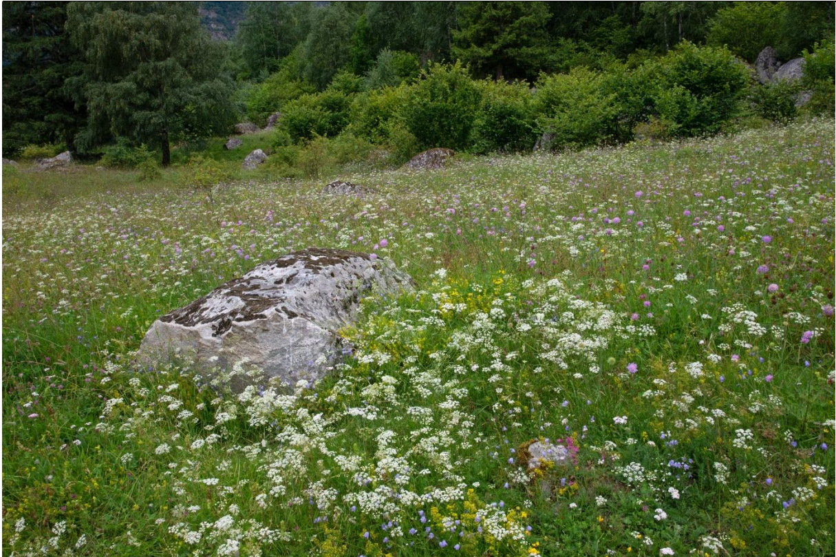
Fig. 11. Slåttemarker er gjerne overflatelyddet for stein, men bergknauser og større blokker kan bli liggende på marka. Det er viktig at det også blir slått inntil steiner og bergfrespring da det ellers lett kan etablere seg uønskede arter her som senere kan spre seg på slåttemarka.

På store deltaflater ble det gradvis utviklet strandenger (brakkvann-fukteng) på leire, silt og sandholdig materiale med en særpreget vegetasjonssammensetning. Ved elvegrandene vest for Lærdalsøyri vanskeliggjorde stadige oversvømmelser og endrete elveløp oppdyrking og bolig-bygging i lang tid.