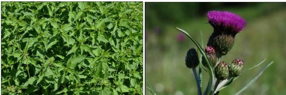
Fig. 46ab. Brennesle tv. og kvitbladtistel th. Brennesle er knyttet til høgt innhold av nitrogen og fosfor i jorden. Hvitbladtistel opptrer ofte på artsrike slåttemark.

Hundekjeks trives først og fremst på næringsrik jord, for eksempel på gammel, nedlagt åkermark, men også i randsoner og kanter rundt dyrka mark. Dette er en kraftig, høg, flerårig plante som først og fremst sprer seg med frø. Det dannes ca. 10 000 frø per plante (Korsmo 1954). Slått under blomstring før frøsetting vil være aktuelt for å begrense planten. Dette kan gjøres på mindre områder der planten dominerer. Ellers vil uttak av biomasse gjennom beiting og slått på sikt kunne redusere næringsinnholdet i jorden og gi muligheter for utvikling av et mer artsrikt feltsjikt.