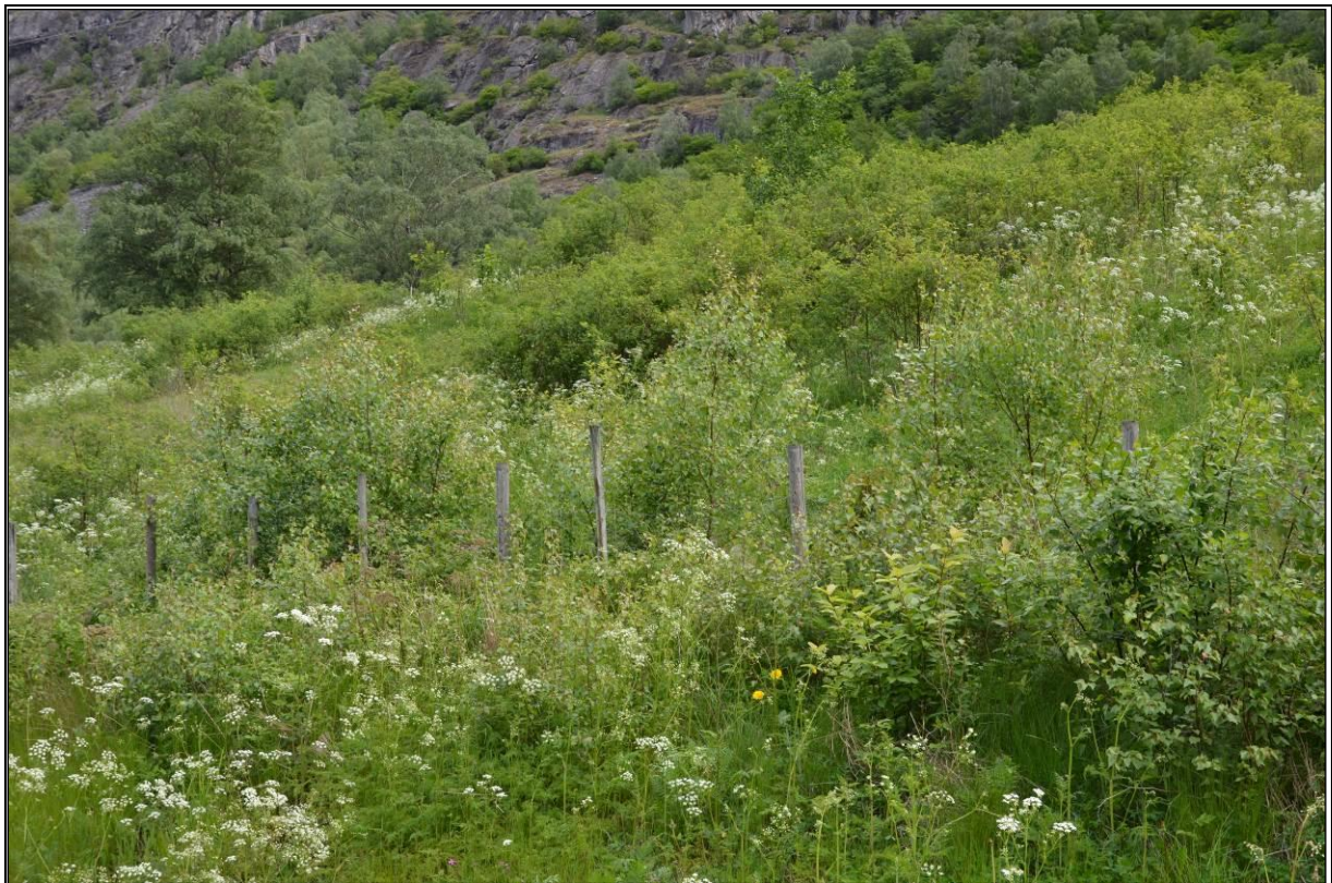
Fig. 10. Opphør av drift fører raskt til endringer i vegetasjonssammensetningen på gamle slåttemarkar og busker og trær etablerer seg raskt.

aktivt vil også spredte oppslag av små frøplanter av lauvtrær etter hvert etablere seg (fig. 10). Særlig bjørk er vanlig i Lærdal. Rotskudd av osp og gråor kan komme tidlig inn på en gammel slåttemark. Også lyngarter, skogkantarter og storbregner kan komme til å prege deler av slåttemarka. Vanligvis starter endringene fra kantene med gradvis inntrenging mot mer sentrale deler. Storbregner var tidligere viktige til husdyrfôr (blom) og ble sanket inn. Einstape ble også brukt som antiseptisk underlag under lammingen. I dag anses slike planter ikke lenger å ha noen verdi og kan spre seg svært raskt på lysåpne kulturmarker dersom de ikke ryddes vekk på et tidlig tidspunkt (Koller 2010). Arter som gjerne forsvinner ved gjengroing er de lyskrevende engartene som blant annet: ryllik, marikåpe, blåklokke, engknoppurt, forglemmegeiarter, prestekrage, føllblom, smalkjempe, engsyre, blåknapp, rødkløver, hvitkløver, hvitmaure, fuglevikke, engkvein, gulaks, hjertegras og blekstarr.