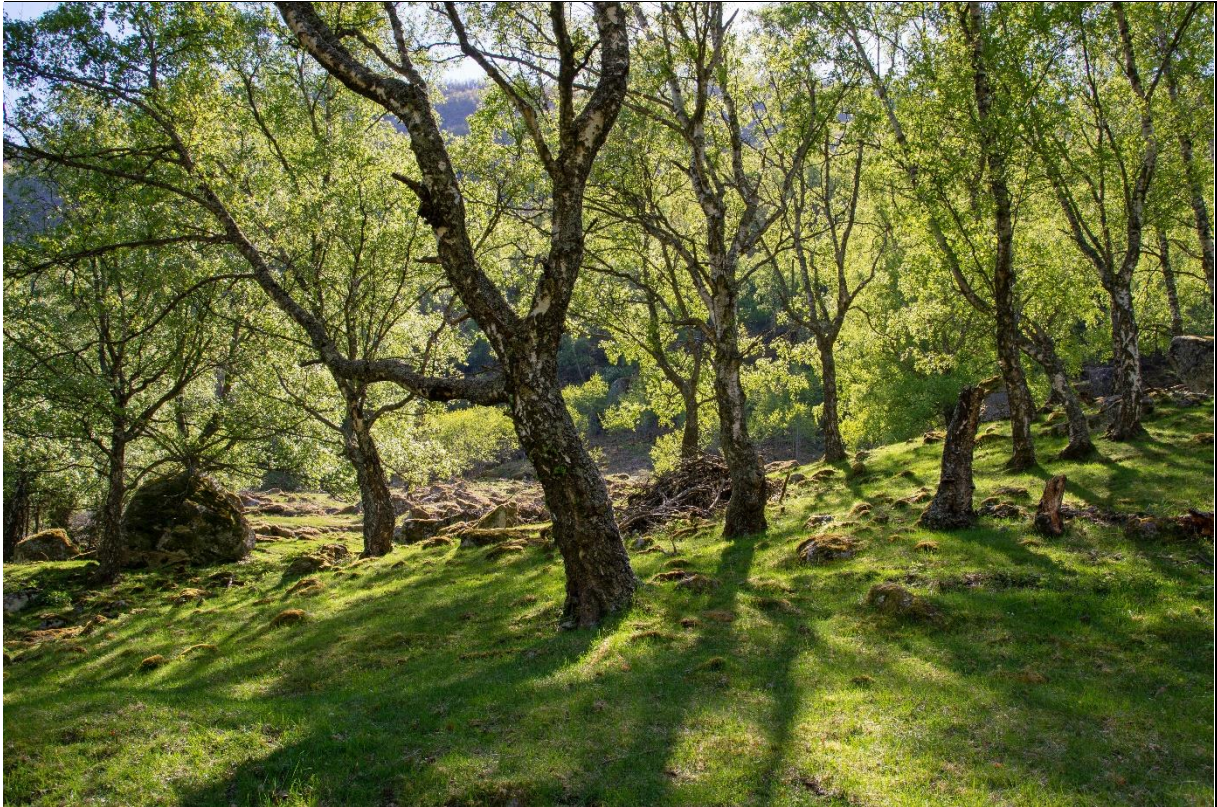
Fig. 29. Bjørkehage på Hønjum med gamle styvingstrær. Det er vanskelig å restaurere gamle styvingsbjørker. Det vil være bedre å forme unge trær og gradvis erstatte de gamle.

Definisjonen gjengitt ovenfor utelater den kulturhistoriske bruken av slike kulturmarker, dvs. aktiv bruk av tresjiktet gjennom fôr høsting slik vi blant annet finner det i hagemarkene i Lærdal. Gjennom jevnlig høsting ble trekronene på denne måten holdt små noe som vil påvirke tretettheten i de vestnorske hagemarkene (Austad & Hauge 2017). Tilsvarende vil feltsjiktvegetasjonen kunne utgjøre en mindre andel enn nevnt i NiN-beskrivelsen.