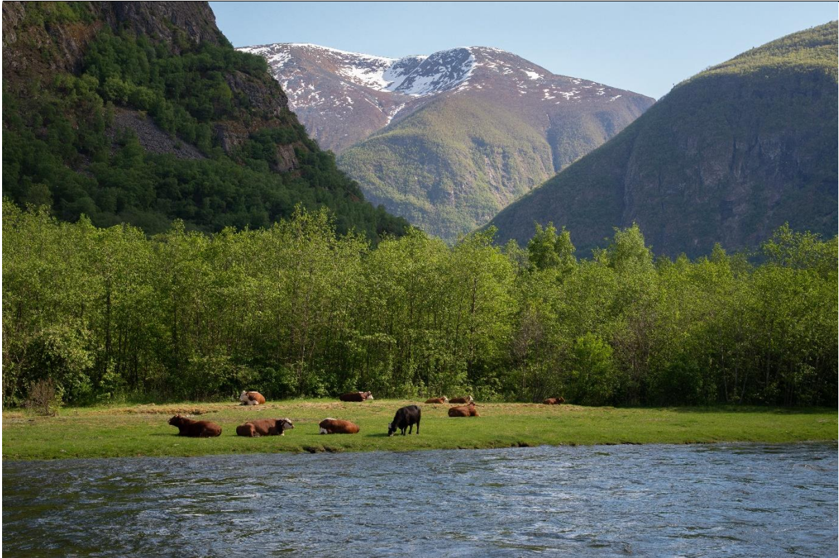
Fig. 15. Tidvis oversvømt mark ved Eri. Randsonene mot Lærdalselvi holdes ryddet for at elvefiskere skal ha så gode forhold som mulig ved fluefiske med stang, men dette gir også god beitemark.

rekke gråor vil invadere de tidligere åpne engflatene. Ideelt bør våtenger helst slås hvert år med ljà eller lett maskinelt utstyr for å unngå tuedanning og opphoping av biomasse. Alternativt bør de beites og etterryddes. Da de tidligere mest brukte områdene nå er oppdyrket, må fokus være å ta vare på randsonerester i tilknytning til dagens innmarksareal med forsiktig fjerning av tuene.