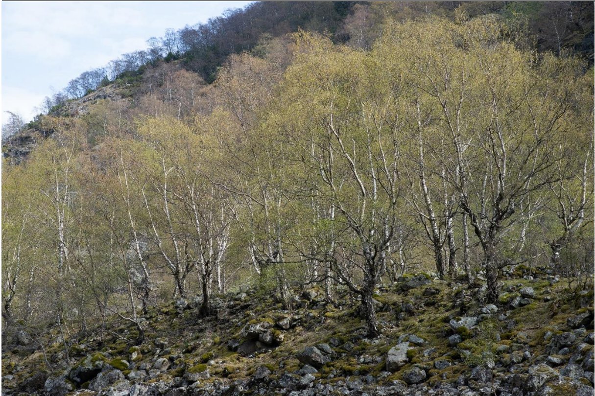
Fig. 37. Høstingsskog med bjørk på storsteinet og grov blokkmark med et sparsomt utviklet feltsjikt finner vi blant annet på Hønjum.

Høstingsskoger «navskoger» med dominans av bjørk: Slike høstingsskoger skiller seg fra hagemarkene først og fremst på grunn av substratet som består av berg, grovsteinet mark og ur og hvor feltsjiktet er sterkt fragmentert, delvis fraværende. Høstingsskoger av bjørk finnes gjerne på grusterrasser, urer og berg i ulendt terreng (fig. 37). Tresjiktet, som kan være bygget opp både av vanlig bjørk og hengebjørk, har tydelige spor etter langvarig høsting. Slike høstingsskoger har ofte innslag av einer og nyperose i busksjiktet (Austad & Hauge 2017). Vegetasjonen i feltsjiktet er dominert av tørketålende, lyskrevende og beiteprefererende arter.