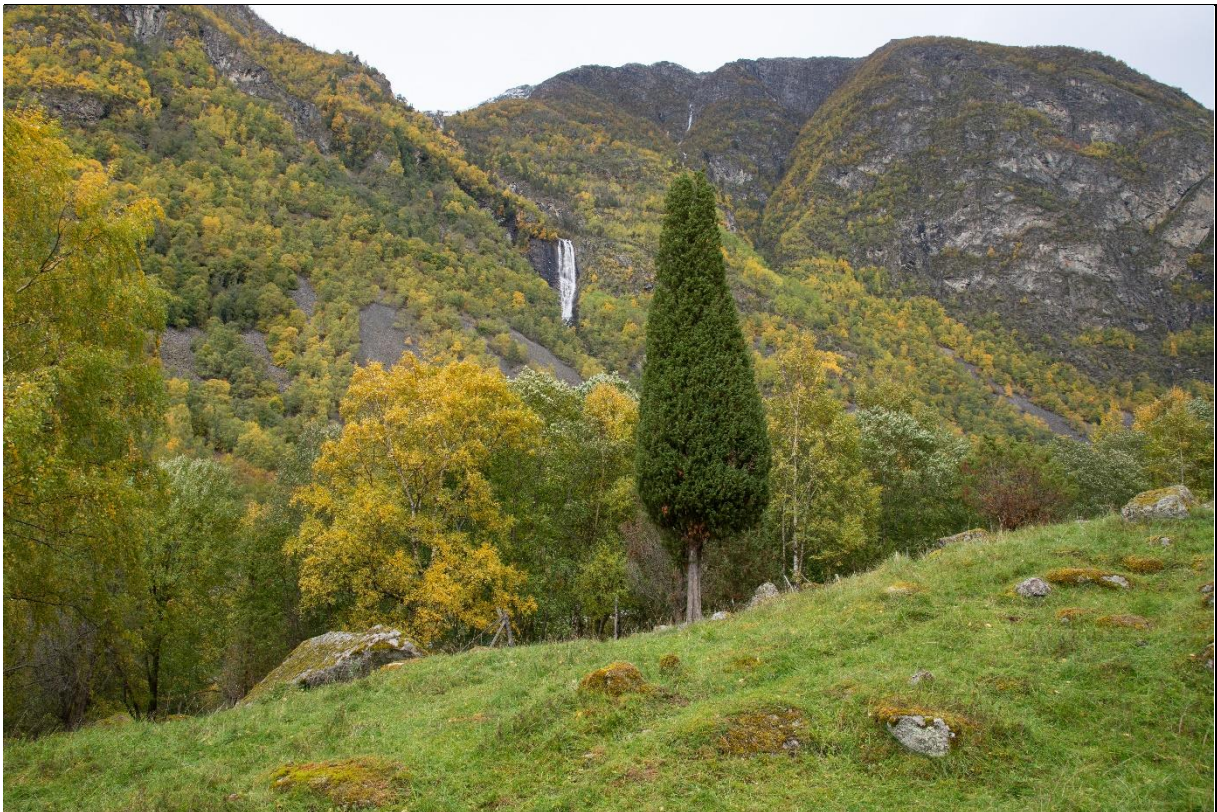
Fig. 32. Einerhager med søyleeiner har tidligere vært karakteristiske innslag i indre og midtre Sogn og Nordfjord. Einer er lyskrevende og trives ikke i tett skog.

Visuelle karaktertrekk: Vår viltvoksende einer kan fremvise en rekke ulike formvariasjoner. Ansamlinger med formfulle einere og den kombinerte bruken av husdyrbeiting og staurproduksjon er et særtrekk for Lærdal som for indre og midtre Sogn og for Nordfjord. Da eineren er et bartre med en særpreget form blir den visuelt svært tydelig på åpen naturbeitemark eller i randsonene mot lauvskog. Hvorvidt formvariasjonene skyldes genetiske variasjoner som historisk bruk med preferanse for søyleeineren gjennom generasjoner, klimaforhold eller jordbunnsforhold, eller en kombinasjon av disse, har vi foreløpig ikke nok kunnskap om. Restarealer og fragmenter av einerhager som fremdeles finnes i Lærdal er viktige innslag i kulturlandskapet og forteller om en spesiell bruk. I store deler av de karakteristiske utformingene er strukturen og feltsjiktvegetasjonen fortsatt intakt og slike einerhager kan få mye av sitt karaktertrekk tilbake ved skjøtselstiltak (rydding) og tradisjonell bruk (fig. 32).