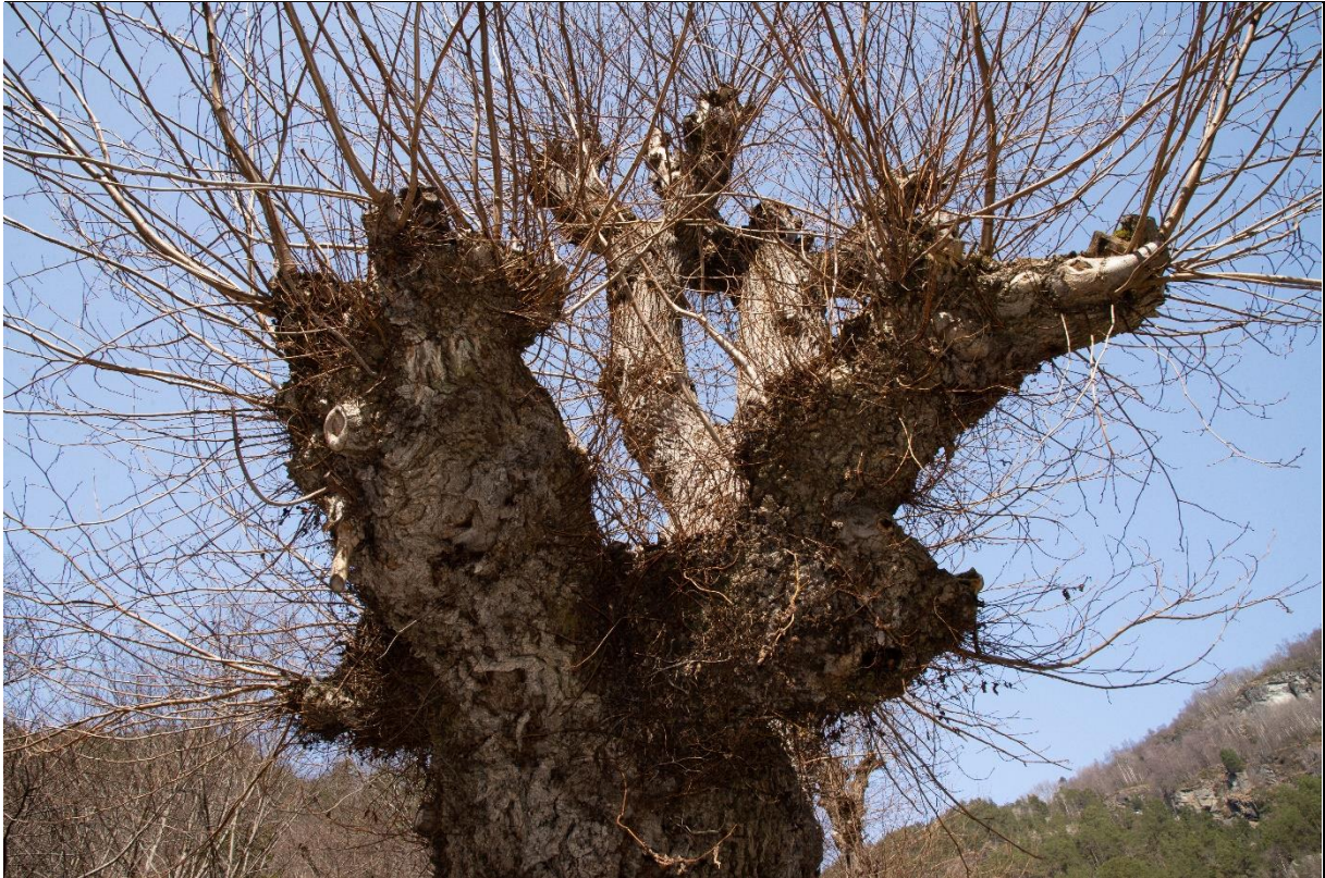
Fig. 36. Gamle styvingstrær av alm kan ha et tett dekke med lav og moser.

Naturtypen dekker en sentral økosystemfunksjon, men er ikke rødlistet. Nedenfor har vi skilt mellom høstingsskoger med et velutviklet tresjikt hvor de enkelte trærne har tydelige spor etter høsting, her beskrevet som «navskog», og lauvskog hvor det er tydelig at unge stammer har blitt kuttet ved basis, delvis til lauvfôr som gråor, her beskrevet som «snelskog», delvis som skav til husdyrfôr, her kalt «morkaskog» og høsting av hassel til tønnebånd, eller med lokalt navn «bandaskog». Når det gjelder snelskog er det stort sett bare etter «bandaskogen» vi kan finne spor etter den tidligere så omfattende høstingen i dag.