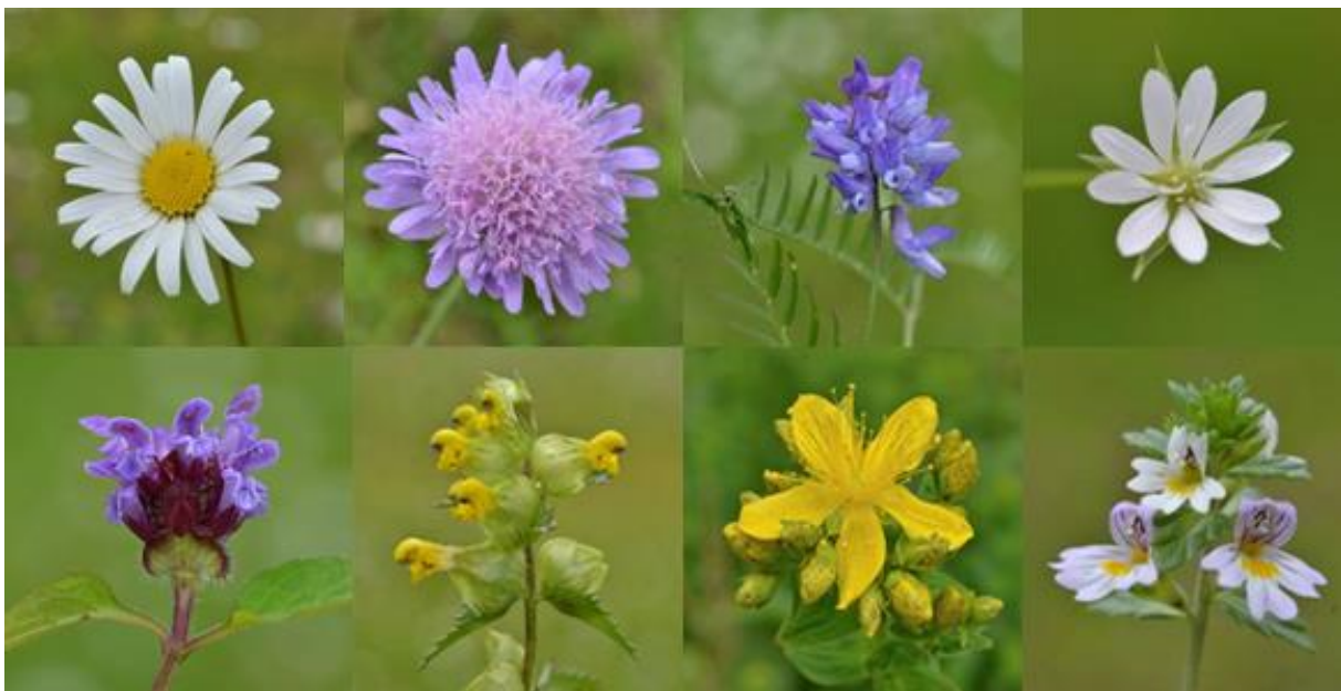
Fig. 7. Vanlig forekommende arter som inngår i flere slåttemarkstyper i Lærdal: prestekrage, rødknapp, fuglevikke, grasstjerneblom, blåkoll, småengkall, firkantperikum og øyentrøst.