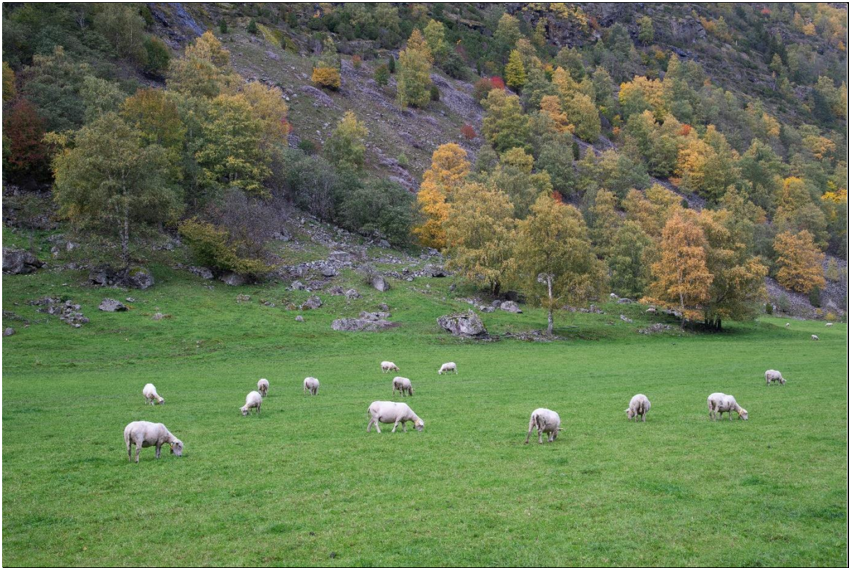
Fig. 18. Vår og høst beiter sau gjerne på innmarka. I randsonene er det naturbeitemark og hagemark som dominerer. Her fra Eri i oktober.

Vi finner også tørre, basefattige naturbeitemarker dominert av mer vanlige lyskrevende gras- og urter og frisk-frodige naturbeitemarker i Lærdalsdalen. Naturbeitemarkene har kontinuitet i bruken og stor grad av autensitet (Austad et al. 2004).