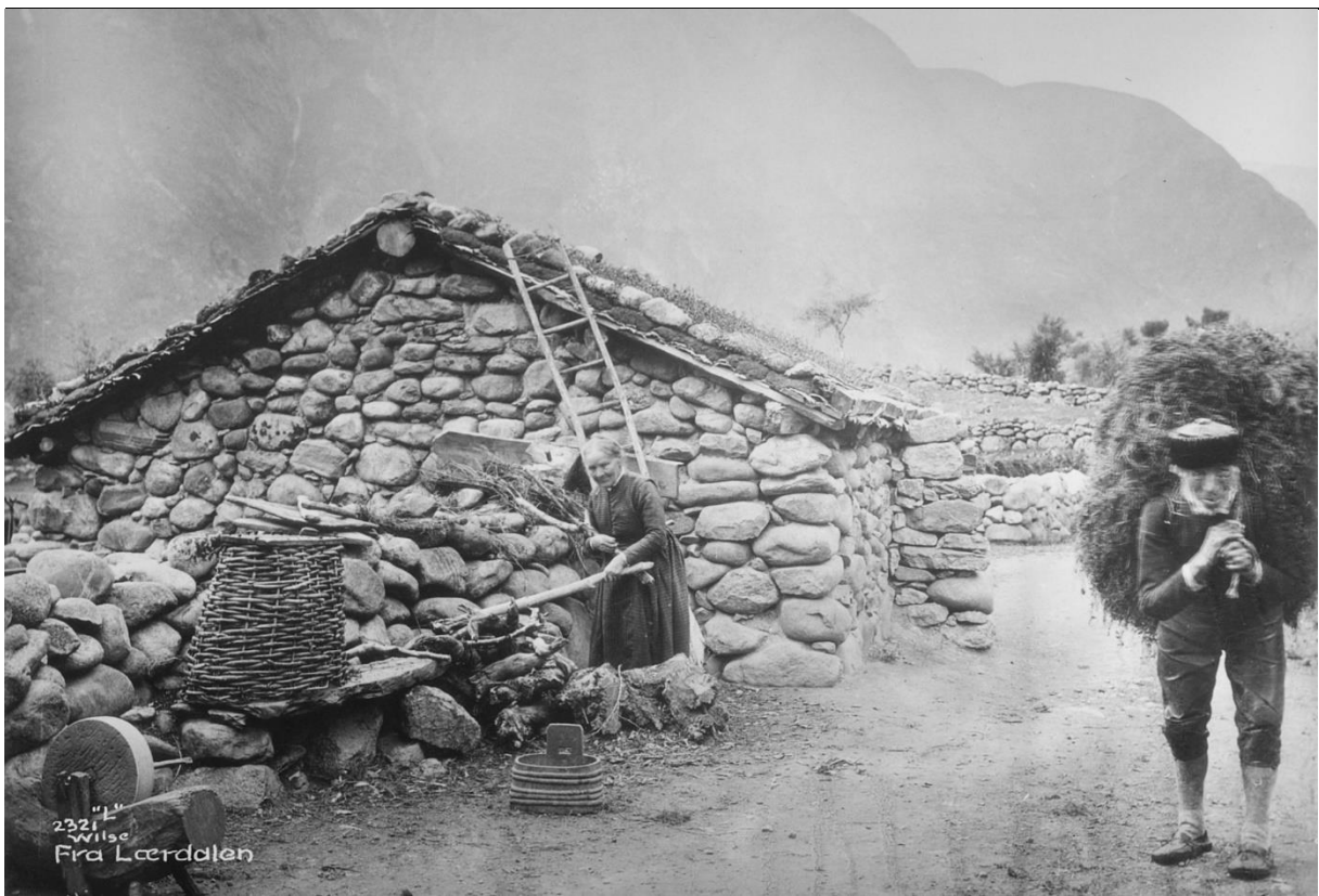
Fig. 1. Utnyttning av naturressursene var nødvendig i naturalhusholdningen. Høy fra utmarka utgjorde en vesentlig del av vinterfôret. ca. 1880.

Det viser seg at et høgt artsmangfold gjerne er knyttet til slike kulturmarker i tillegg til at mange sårbare og sjeldne (rødlistede) arter har sine viktigste vokseplasser her (Losvik 1988, Kull & Zobel 1991, Henriksen og Hilmo 2015). Norge har gjennom Konvensjonen om biologisk mangfold (Riokonvensjonen) i 1993 forpliktet seg til å gjennomføre en rekke forvaltningstiltak for å bevare biologisk mangfold og å stoppe tapet av arter.