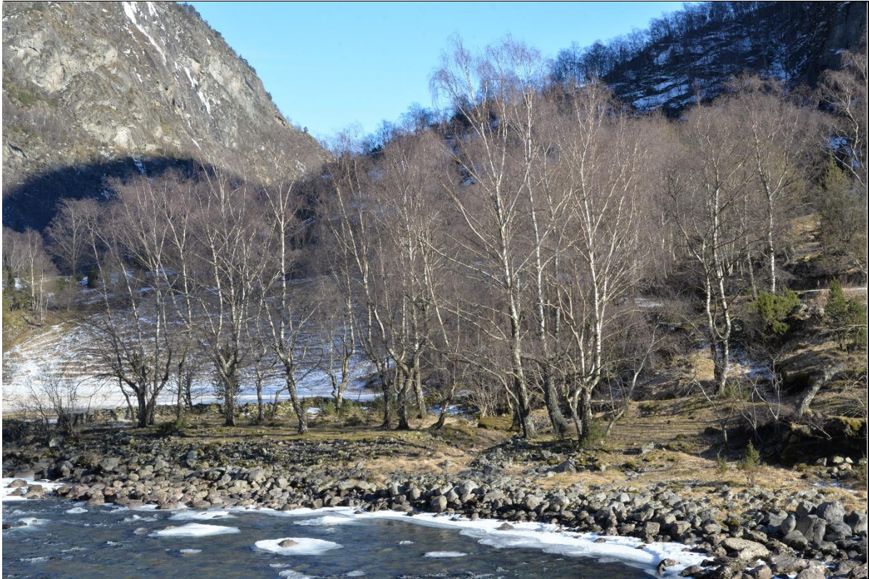
Fig. 30. Hagemark med styvingsbjørker på en grovsteinet elvebredd.

lystilgang til feltsjiktet har ført til en dominans av lyskrevende, stress-tilpassede gras- og urter. Uttrykket er parklignende og bjørkehagene skiller seg fra omgivende lauvskog som gjerne har et tettere busksjikt og også unge treoppslag.