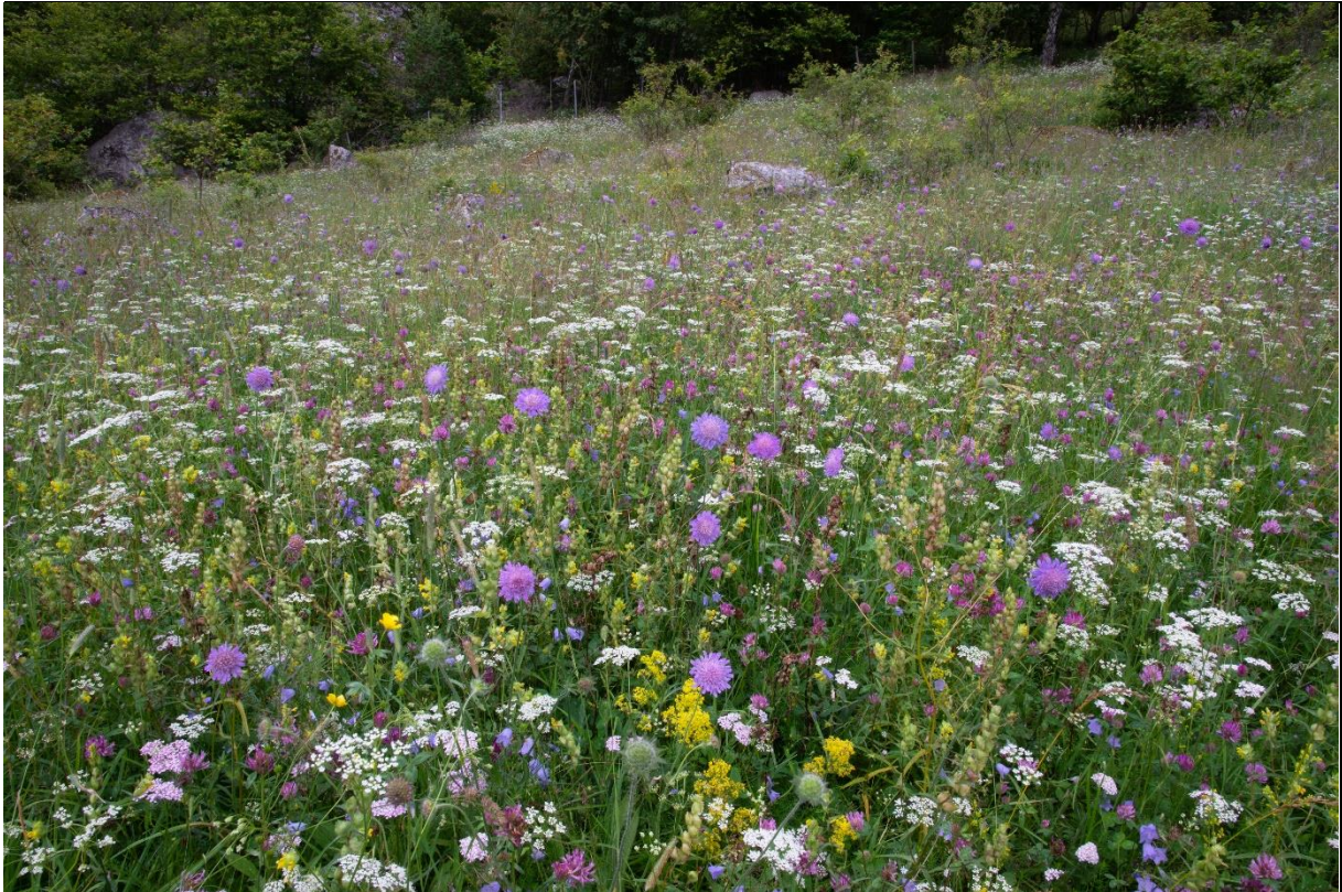
Fig. 43. Det er stor variasjon når det gjelder artssammensetningen i kulturmarkene. Kalkinnhold, fuktighet, tidligere og nåværende skjøtsel betyr mye for hvilke planter som vokser der

Flere engarter har også vegetativ formering enten ved utløpere og krypende vekst over bakken som legeveronika og markjordbær, eller under bakken som engtjæreblom og ryllik. Slik sikrer de vekst og formering selv om marka blir slått eller hardt nedbeitet. Kort tid til å utvikle seg på mellom høstingene gjør at noen arter sikrer seg med groknopper hvor frøet har utviklet seg til små individ før de slipper morplanten og etablerer seg i enga. Dette er en spesiell måte å formere seg raskt på som vi blant annet finner hos harerug og geitsvingel. Halvparasitter som småengkall, øyentrøst og marimjellearter snylter på røttene til andre planter. I Lærdal finner vi også nesle-snyltetråd, en plante som er hel-parasittisk og som ikke har egne blad med klorofyll, bare et lite blomsterhode. Produksjonen til vertsplantene reduseres på denne måten, mens lys, fuktighet og næringsforholdene til halv- og helparasittene blir bedre. Selv om de fleste slåttemarks-artene er flerårige, finnes det også ett- og toårige arter.