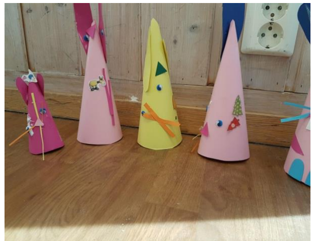
Figur 2 Abstrakt Påskekylling

Det jeg har observert i 1. klasse og 2. klasse i praksisen min er at mange barnehageansatte synes å ha glemt det viktigste. De har kun fokuset på at man skal lage den perfekte påskekyllingen, siden påsketradisjonen er å lage kylling pynt. I stedet for å la barna få utfolde seg og på den måten de trenger under den spesifikke aktiviteten. Det er med på å gjødsle barns kunnskap, stimulere læring som ikke er basert på fakta gitt fra oss voksne. Sammenhengene av dette og tilknytningen mellom ulike elementer at nye kreative prosesser utvikles. Dette vil si at estetikken betraktes som en viktig igangsetter for læring (Vecchi & Støyva, 2012, s.33).