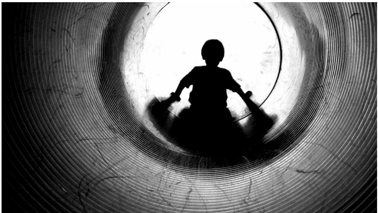
Figur 1: En reform for et bedre barnevern.(Fotografi) Hentet fra:

«Hvilke faktorer kan belyse at barnehagene er blant de som melder minst ifra til barnevernet ved mistanke om seksuelle overgrep og vold»