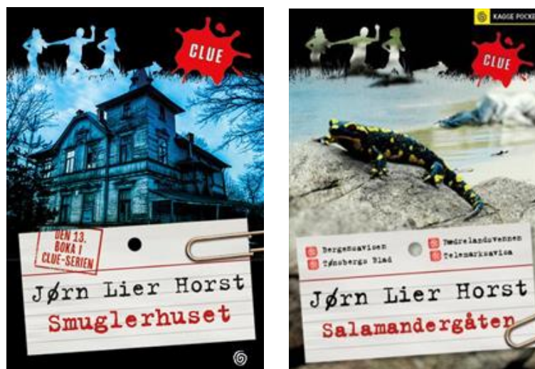
Figur 3. Clue-serien

Forsidens layout og overskrift, sammen med det illustrerte undrende barnet er denne faktabokseriens kjennetegn.