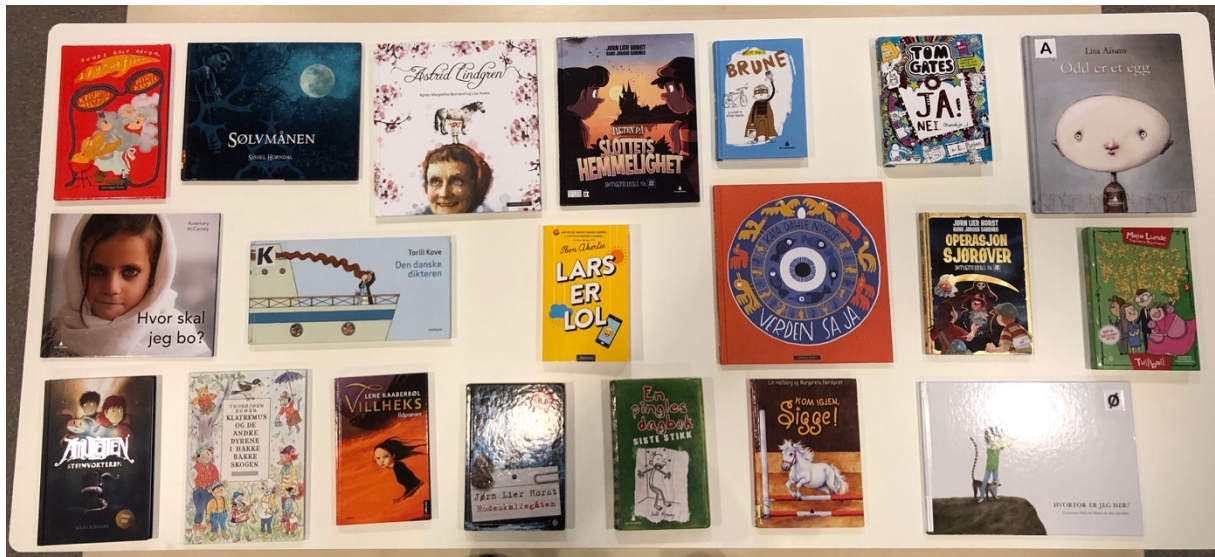
Figur 6. Oppstilling av bøkene slik de ble presentert for elevene.