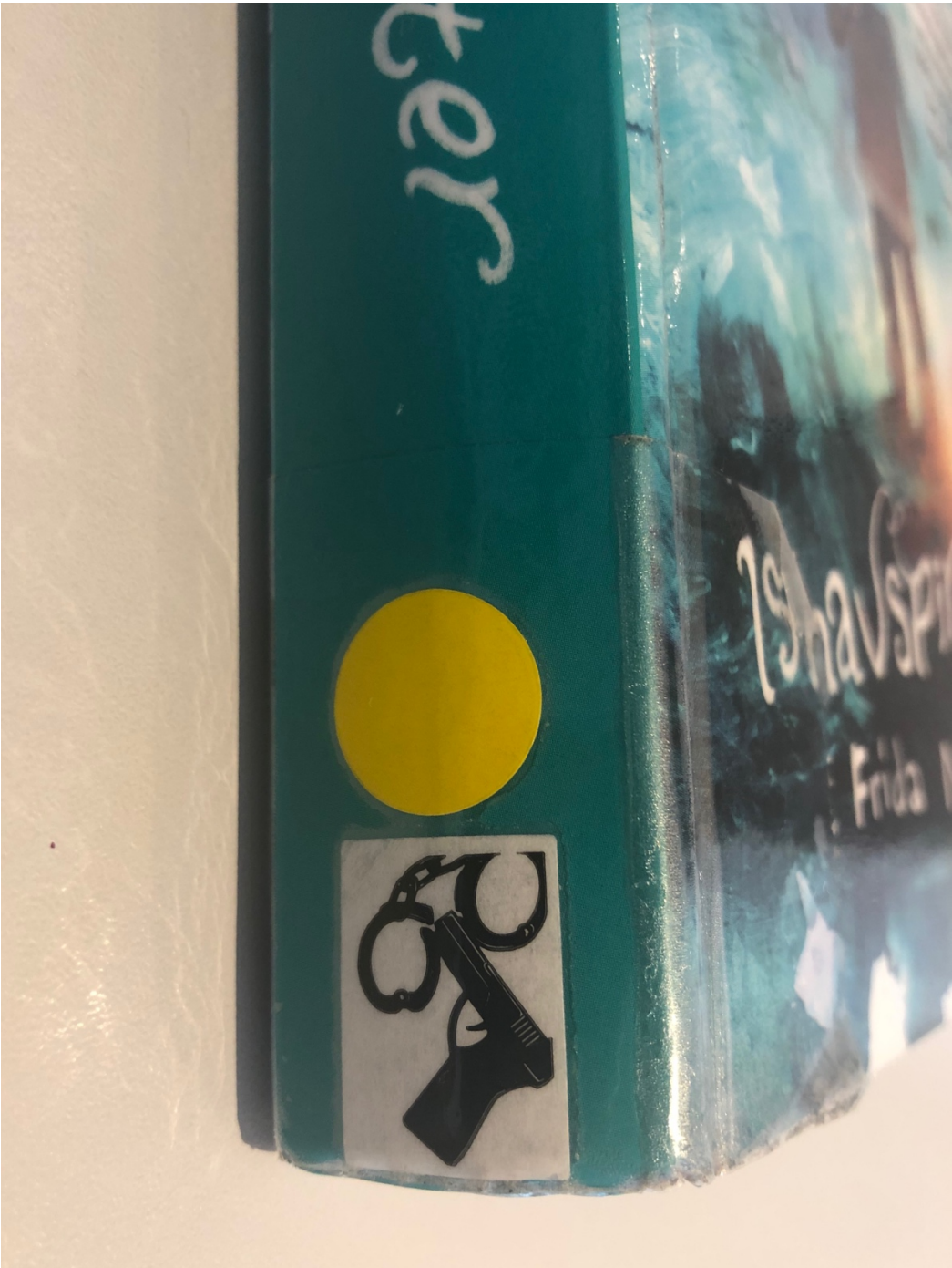
Vedlegg 3. Bibliotekets merke for kategorien «spenning»