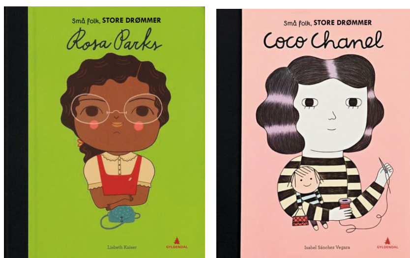
Figur 5. Små folk, STORE DRØMMER

Her er det forskjell i både illustrasjonstype, titteltekstens utforming og tema, men det gule løvemerket nederst i høyre hjørnet gjør serien meget lett gjenkjennelig.