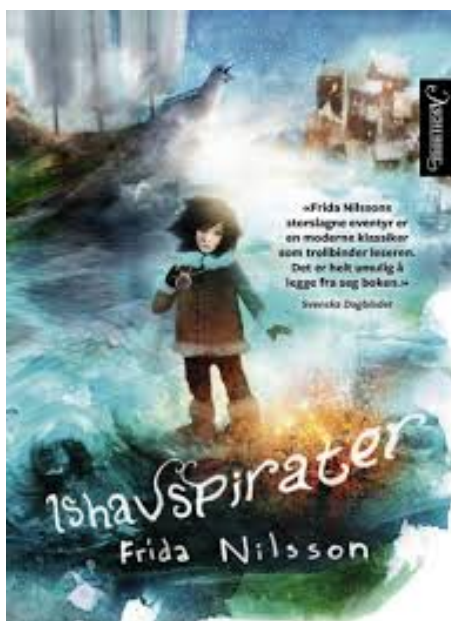
Figur 9. Ishavspirater

Hver elev ble spurt om de ønsket å lese boken eller bli lest høyt for, og her er resultatene: