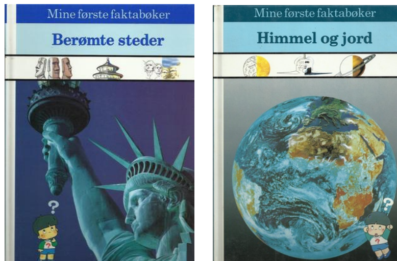
Figur 2. Mine første faktabøker

( https://bokelskere.no/bok/mine-foerste-faktaboeker-himmel-og-jord/131659/ )