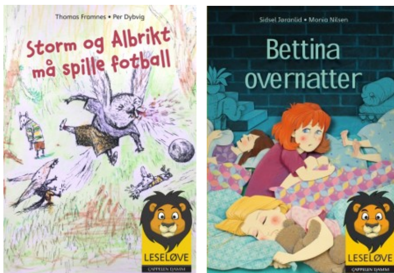
Figur 4. Leseløve

( https://www.cappelendamm.no/cappelendamm/barneboker/article.action?contentId=141729 )