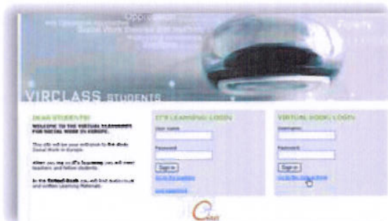
Illustrasjon 1: Påloggingside til SSS og Virtuell læringsmateriale.

Utviklingen av stadig bedre nettbaserte studiestøttesystem (SSS) har etter hvert gitt mulighet for å skape gode læringsarenaer via Internett. Da vi startet de internasjonale nettbaserte kursene i 2004, var det ingen partnerinstitusjoner som brukte det samme SSS. Av praktiske grunner ble derfor It's learning som Høgskolen i Bergen