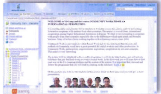
Illustrasjon 2: Bildet viser strukturen i SSS og opplagstavlen i kurset.

benyttet, valgt. Studenter og lærere kommer inn i kursene gjennom en egen Internettadresse.