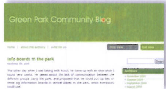
Illustrasjon 6: The Green Park Community blog – tekst format