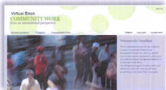
Illustrasjon 4: Virtual Book – Community Work from an international perspective.