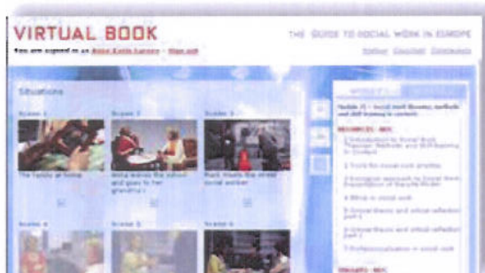
Illustrasjon 5: Tolv kasus scener for modul 2.

«I think the Green Park Community Blog provides a chance to put into practice the theories we learn. It also give us access to people thoughts, feelings and impressions about their community and this is really important information for community workers» (Midtevaluering, CW 2010).