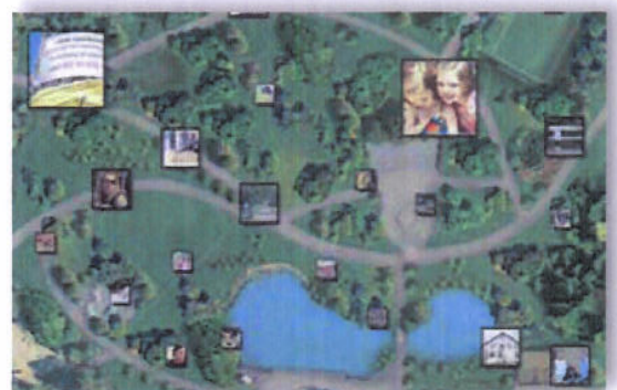
Illustrasjon 7: The Green Park Community – kart format

Disse tre modulene inngår i det vi har kalt en internasjonal fordypning i bachelorprogrammene. Til sammen har studentene mulighet for å ta 30 studiepoeng (et halvt år) som nettstudent. I tillegg har studentene tilbud om å ha praksis utenlands og gjennomføre kortere studier hos en av partnerinstitusjonene (inntil 30 studiepoeng). En slik internasjonal fordypning kan om ønskelig avsluttes med at studentene skriver sin bacheloroppgave på engelsk med et komparativt internasjonalt perspektiv på sosialt arbeid. Alle studenter gjennomfører det første studieåret ved sin nasjonale høgskole før de begynner på fordypning, og de tar sin avsluttende eksamen ved sin hjemmeinstitusjon.