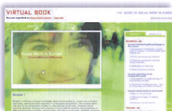
Illustrasjon 3: Virtual Book – The Guide to Social Work in Europe