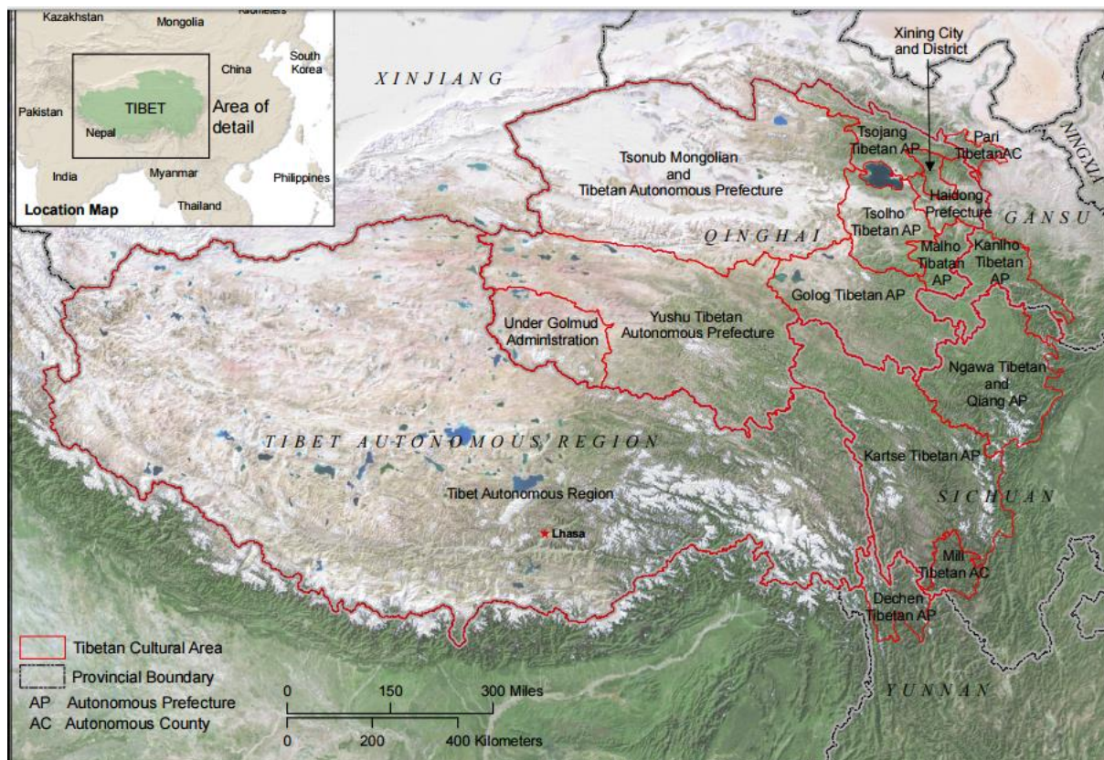
Kart 1: Området som i dag er TAR, og det som før har vore Tibet (International Campaign for Tibet, 2016)