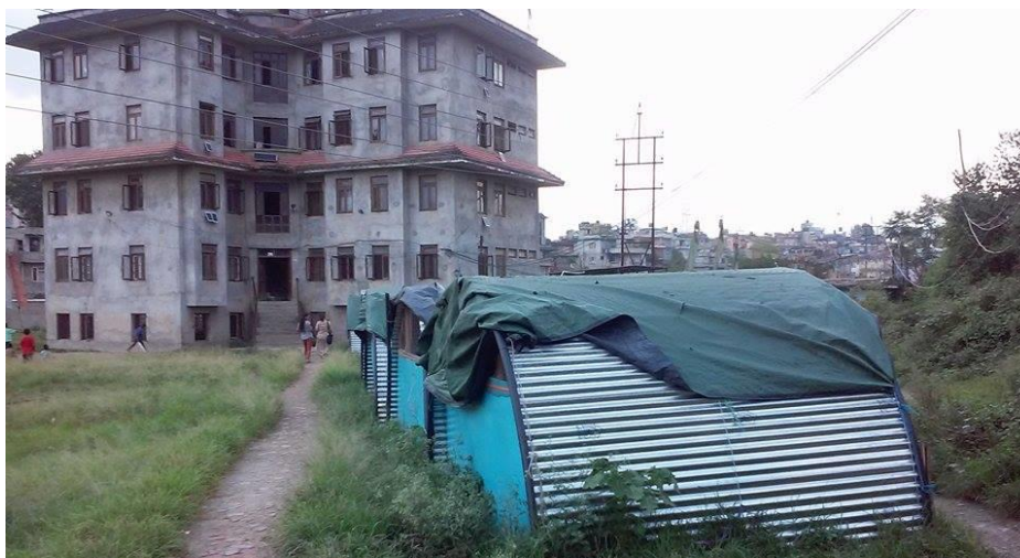
Bilete 1: bilete av dei midlertidige klasseromma til tibetansk barneskule og bustadar i bakgrunnen

dei nytta bølgeblekk for å lage små rom som kan nyttast til klasserom. Eg brukte litt tid på denne skulen og fekk vere med på