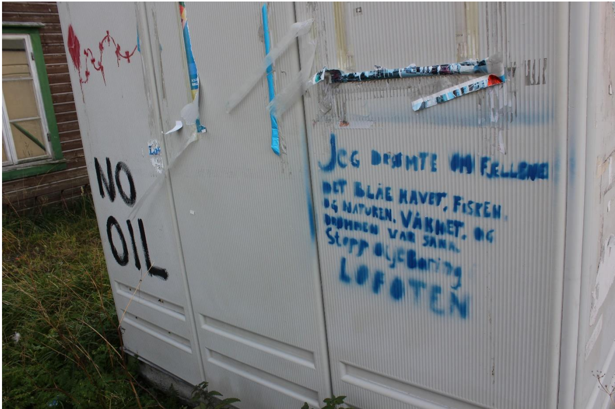
Bilde 2: Tagging i Lofoten

Det er mange i Norge som vil si at de har et sterkt forhold til naturen. De fleste trenger ikke å gå mange generasjoner tilbake for å finne slekt som sanker ressursene fra havet og landjorda. I beskrivelsen av Nord-Norge blir naturen sett på som enda viktigere enn i resten av landet: