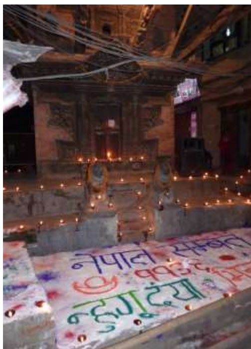
Foto 4.3: Festival. Nepal er kjend for sine mange festivalar året rundt. For nepalarar inneberer desse høgtidene fri og feiring.

Eit døme på at ting ikkje alltid gjekk etter planen, var utfordringane eg møtte med å få kontakt med volontørar som underviste i offentleg skule i Nepal i tidsrommet feltarbeidet varte. Mitt opphald i Nepal var samstundes som fleire høgtider og festivalar, noko som gjorde til at skulane var stengte, ettersom elevane hadde ferie. Politisk uro, mangel på drivstoff og handelsblokade i landet var også ein medverk-