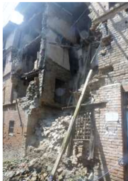
Foto 2.2: Jordskjelv. Spora etter dei øydeleggande jordskjelva våren 2015 er framleis synlege.