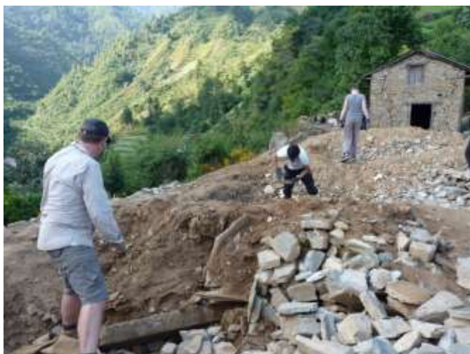
Foto 2.4: Konstruksjonsarbeid. Volontørar som deltek i oppbygging av ein skule som vart øydelagd under jordskjelvet.

Jordskjelvet våren 2015 skapte ei enorm interesse blant volontørar til å involvere seg i