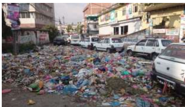
Foto 2.3: Taxikøar. Taxikøane vart stadig lengre etter kvart som streiken og handelsblokaden haldt fram. Rykte sa at taxisjåførar måtte stå heile åtte dagar i bensinkø på eit tidspunkt, og då berre for å få fylle nokre få liter.

Misnøye med delar av innhaldet, spesielt blant grupper i låglandet på grensa mot India, førte til stor politisk uro i landet. Etniske grupper i Terai, i sør-Nepal, protesterte mot det dei meinte var ei urettferdig grunnlov. Også India var misnøgd med den nye grunnlova, og meinte at Nepal burde kome innbyggjarane i låglandet i møte (NORAD,