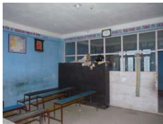
Foto 5.5: Klasserom. Både klasseromma og undervisninga i Nepal var noko annleis enn klasseromma volontørane var vande med. Bilete syner eit klasserom på ein offentlig skule på landsbygda der mange volontørar har vore innom.