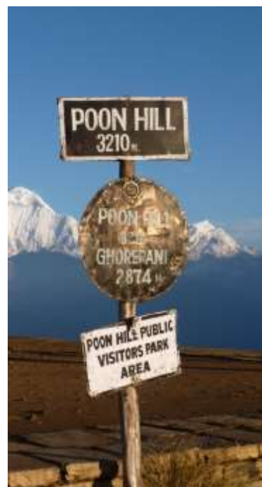
Foto 2.1: Poon Hill. Dei mektige Himalayafjella er den største turistattraksjonen i Nepal, og lokkar mange turistar til landet.

Nepal har sidan 1951 vore offisielt open for internasjonal turisme. Sidan då, har Nepal vore eit attraktivt reisemål for turistar som søker opplevingar knytt til landet sin storslåtte natur og kultur (Ministry of Culture, 2014, s. 1). Fjellvandrarar frå heile verda kjem til Nepal for å gå i dei mektige fjella i