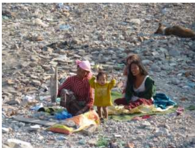
Foto 5.1: Fattigdom. Fattigdommen i Nepal er synleg overalt. For nokre av volontørane var det viktig å få kunne oppleve nettopp fattigdommen.