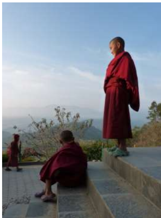
Foto 5.2: Unge munkar. Unge buddhistiske munkar med Himalayafjella i det fjerne.