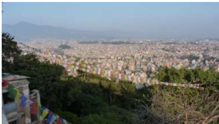
Foto 5.3: Monkey Temple. Utsikt frå den populære turistattraksjonen "Monkey Temple" i Kathmandu. For volontørane som arbeidde gjennom "Red Panther" var tur opp til dette tempelet og andre kjende turistattraksjonar ein del av introduksjonsveka.

Likevel hevda dei fleste av informantane at det var viktig for dei å kunne kombinere frivillig arbeid med turistaktivitetar som fjelltur i Himalaya, rafting, tempelbesøk, shopping osv.