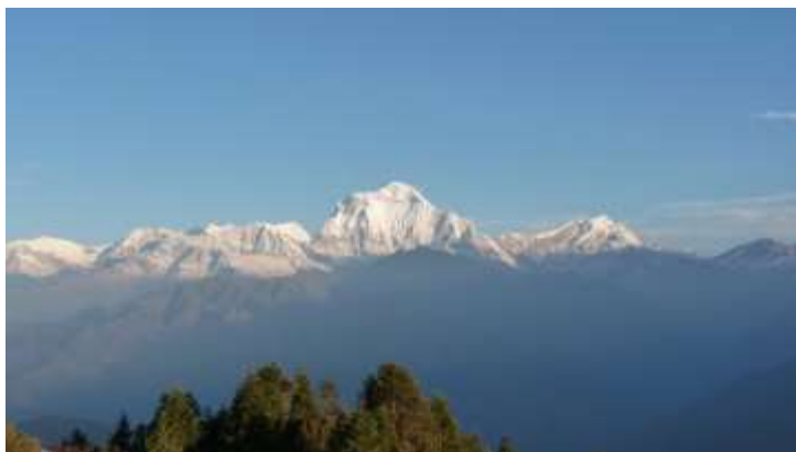
Foto 2.6: Himalaya. "Globetrottar reisebyrå" er eit av mange reisebyrå som legg til rette for fjellvandring i Himalaya. Reisebyrået tenkjer no nytt, og arrangerer turar med frivillig arbeid som ein del av reisa.

Mine to siste informantar skilde seg frå dei andre volontørane. Desse informantane såg seg sjølv i større grad som turistar i Nepal. Edward og