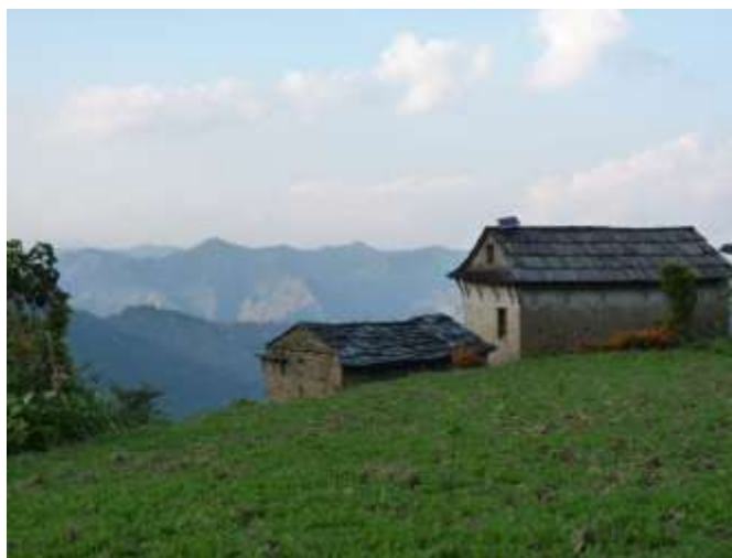
Foto 4.2: Landsbygda. Utsikta frå landsbyen der volontørane som arbeidde med konstruksjonsarbeid budde hos vertfamiliar.