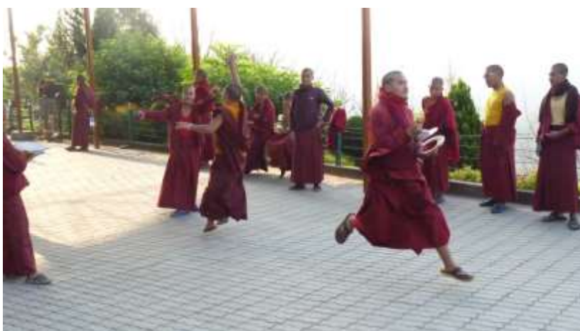
Foto 5.4: Tradisjonsdans. Festivalar, høgtider og eksamensavvikling gjorde at munkane var opptekne med andre ting enn undervisning. Her øver munkane til "Lama-fest".