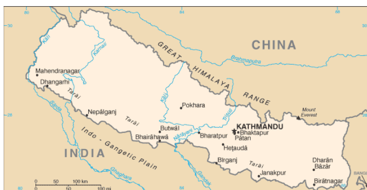
Figur 2: Kart over Nepal.

Den tronge økonomien i Nepal kan forklarast med eit vedvarande stort underskot på handelsbalansen, grunna låg produksjon og import frå India. Nepalarar som arbeider i Gulfstatane sender heim pengar, noko som utgjer størstedelen av kapitaloverføringar frå