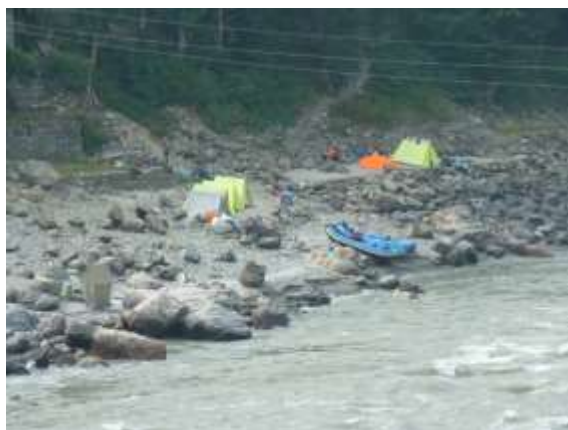
Foto 4.1: Raftingtur. Helgetur med rafting og overnatting i telt saman med volontørar frå Red Panther.

Som forskar greip eg kvar ein moglegheit til å vere ilag med volontørane. Eg fekk observere og ta del i to introduksjonsveker, der volontørar fekk innføring i nepalsk kultur og skulle