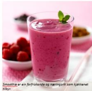
Smoothie er ein forfriskande og næringsrik som kjekketilbyr.

Vi kan for eksempel tilby ønskekost, hyppige appetittvekkande måltid, smoothie, frukt og grønt osv. I somme tilfeller vere viktig å Det er viktig å ha eit tverrfagleg samarbeid alt etter pasientens behov.