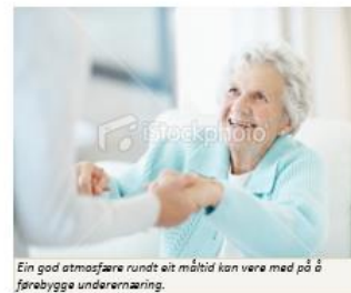
Ein god atmosfære rundt eit måltid kan vere med på å forebygge underernæring.