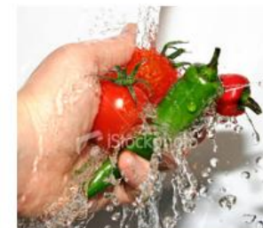
Presentasjon av mat er ein av mange faktorar som kan ha betydning for appetitt og matinntak.

Som studenter skal vi delta i ett prosjekt i samarbeid med Helse Førde, der vi skal sortere alle pasienter over 75 år. Formålet blir då å kartlegge om det foreligger ernæringsmessig risiko og eventuelt sette i verk tiltak.