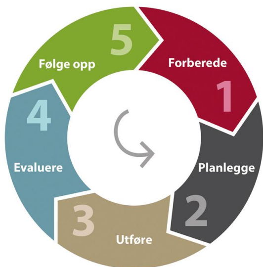
fig. Forbetningssirkelen, henta frå Kunnskapscenteret (2015)

I Kunnskapscenteret (2015) sin forbetnings sirkel startar ein i fase ein med å erkjenne behovet for forbetring. Her klargjer ein kunnskapsgrunnlaget knytt til område som skal forbetrast. Dette grunnlaget er knytt både til utfordringar med system, kva som er god praksis på feltet som til dømes forskning og retningslinjer, erfaringar og brukarkunnskap. I denne fasen er det viktig å forankre arbeidet i avdelinga/ organisasjonen og organisere gjennomføringa av arbeidet, dette skjer gjennom god informasjon og opplæring av personalet. I fase to kartlegg ein noverande praksis, dvs. korleis arbeidet som skal forbetrast vert utført. Ein set i fellesskap mål for arbeidet, vel måleverktøy og planlegg korleis forbetningsarbeidet skal gjennomførast. I fase tre skal ein prøve ut og legge til rette for ny praksis. Det er sentralt at alle i avdelinga/ praksisfeltet tar del i dette arbeidet. I den fjerde fasa målar og analyserar ein data i forhold til det som er mål for prosjektet. Eit sentralt moment her er om endringane er tilstrekkelege og om dei har ført til forbetring av praksis. I denne fasa kan det vere naudsynt å korrigere nokre av tiltaka som er sett i verk. I fase fem standardiserer ein den nye praksisen for å sikre ei vidareføring av forbetringane, og ein deler denne kunnskapen med andre til dømes avdelingar.