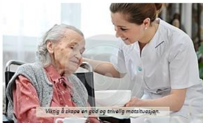
Viktig å skape en god og trivselssituasjon.