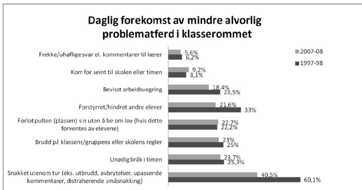
Figur 1.

I figur 1 ser me omfanget av mindre alvorleg problemåtferd i klasserommet, og her viser undersøkinga at omfanget har gått ned i løpet av denne tiårs-perioden. Ut frå samanlikninga av dei to undersøkingane ser ein at den hyppigaste førekomsten av problemåtferd i klasserommet, med 60,1% i 1998 og 40,5% i 2008 handla om at elevane dagleg snakka utanom tur, til dømes i form av utbrot, avbryting, upassande kommentarar og distraherande småsnakking (Sørli & Ogden, 2014, s. 196). Til tross for ein markant nedgang, kan ein sjå at førekomsten av denne typen åtferd framleis er relativt høg i 2008.