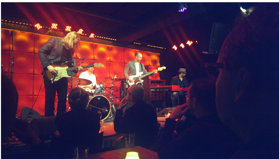
Matt Schofield Band, live i Amsterdam, november 2013

"You are what you listen to. Your ears are your most important piece of equipment as a musician." (Intervju Matt Schofield, s. 3)