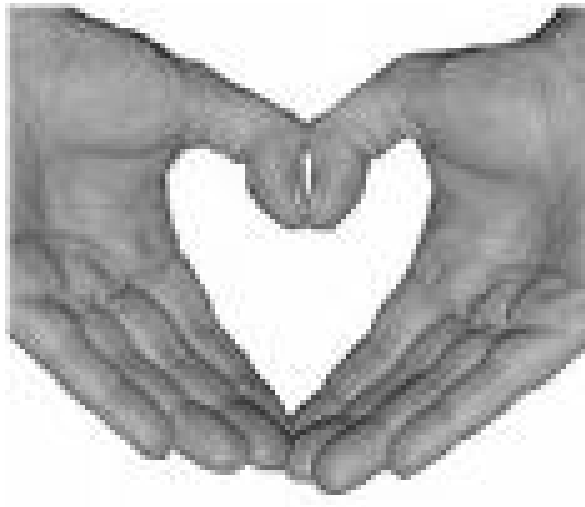
Ukjent fotograf (u.år.).

Innlegg ved Demensdagene (2009). Dikt av Haldis Moren Vesaas.