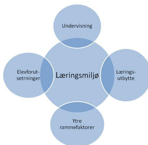
Figur1: Læringsmiljø (Utdanningsdirektoratet, udatert, s. 8) 1 .

For å få ei klarare avgrensing av omgrepet læringsmiljø, kan ein ta utgangspunkt i denne figuren henta frå Utdanningsdirektoratet: