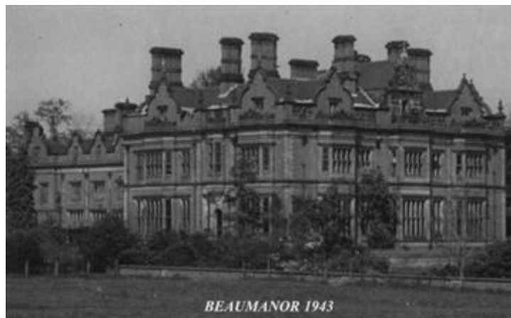
Bilete av Beaumanor 24