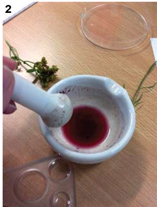
Figur 2. Bilde frå elevøving om uttrekk av hypericin frå firkantperikum hausten 2009, ved student Cathrine Løvliv Hagaseth.

i oljekjertlane (figur 3) (Borrelli & Izzo 2009). Det gjev forklaringa på kvifor det i praksis berre er prikkperikum som har blitt brukt som medisinske plante gjennom tidene. Dei raudte fargestoffa hypericin og pseudohypericin hos t.d. firkantperikum er likevel i dag av stor medisinsk interesse då dei synest å hemme forplantinga hos ei rekkje virusstypar i dyreceller (Miskovsky 2002). Hos beitedyr kan