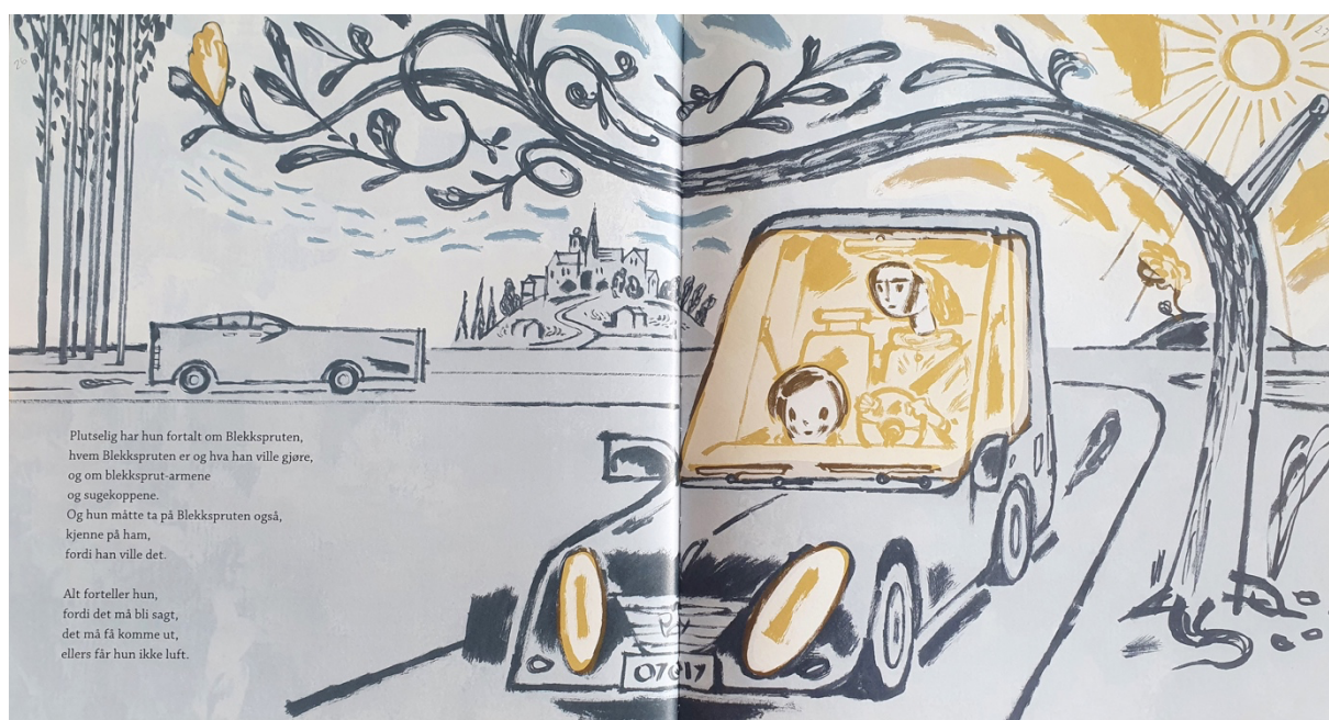
Figur 3 Dahle, 2016, oppslag 14

Under kjøreturen til moren og Gullet på oppslag 14 (figur 3) spiller også gulfargen en stor rolle. På dette oppslaget forteller Gullet «hvem blekkspruten er og hva han vil gjøre [...] Alt forteller hun [...] ellers får hun ikke luft». Igjen får man redundans med at blåfargen er vannet som Gullet er i og ikke får puste. Inne i bilen er det heldekket med gulfarge, trygghet. På forrige oppslag kunne man lese «bilen er trygg, helt uten blekksprutblekk.», som er med på å støtte min tolkning om at det er trygt inne i bilen. Sola stråler også gulfarge ned på bilen, som en lettelse og en friskluft-følelse. En annen interessant detalj på dette oppslaget er den gule blomsten i toppen av treet som ellers er blått. Jeg tolker det som at det er følelsen Gullet nå har, at det vokser frem trygghet igjen når hun nå endelig kan dele og få hjelp av en trygg voksen.