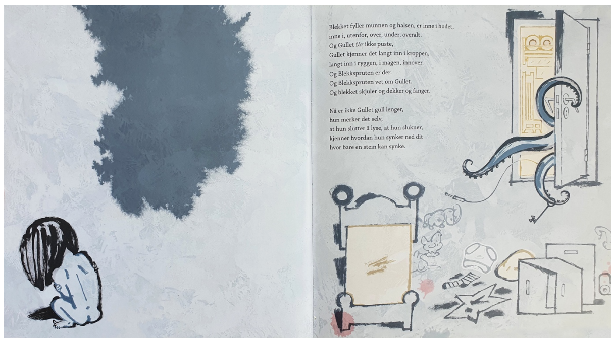
Figur 5 Dahle, 2016a, oppslag 9