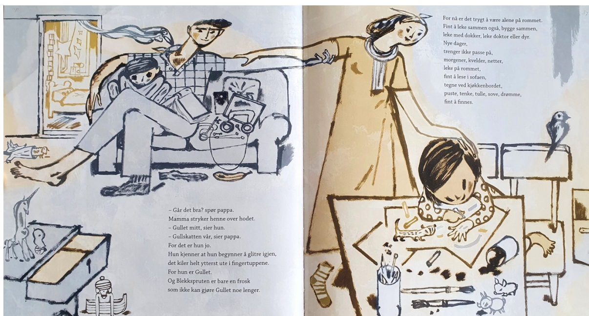
Figur 15 Dahle, 2016, oppslag 19

Det siste oppslaget jeg vil analysere nærmere, er det siste oppslaget i bildeboka, oppslag 19 (figur 15). Familien til Gullet er samlet. Faren og broren sitter i sofaen i stua og mora står og ser ned på at Gullet tegner. I verbalteksten får jeg informasjon om at Gullet og mora er på kjøkkenet. På dette oppslaget er det flere av nøkkeltegnene jeg videre vil se nærmere på, blant annet lås/nøkkel og farger. Oppslaget har også mye interessant for meningsinnholdet og fortellingens utvikling som jeg kjenner igjen fra oppslag 11 som jeg vil sammenligne.