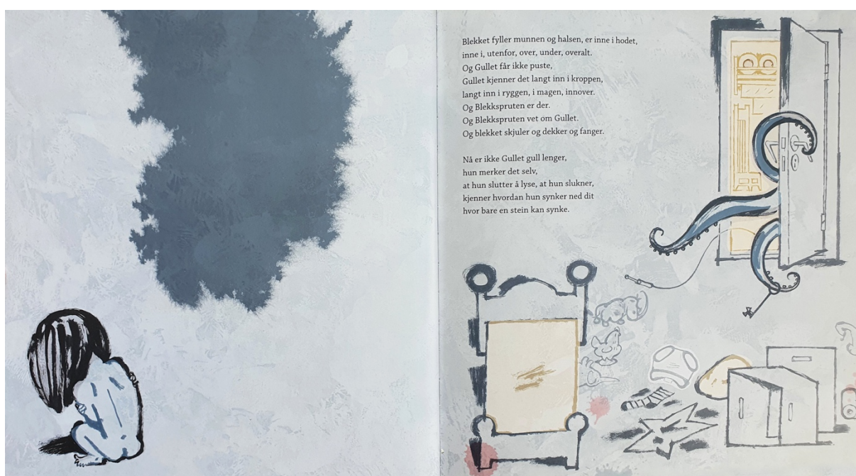
Figur 2 Dahle, 2016, oppslag 9

På oppslag ni (figur 2), rett etter overgrepet har skjedd, er også fargen rød sammen med blå og gul. Rundt sengen til Gullet er det tre røde og ujevne flekker, sammen med en skadet stjerne, en veltet eske og en skadet svane. Rødfargen assosieres ofte med blod og det mener jeg det kan tolkes som her.