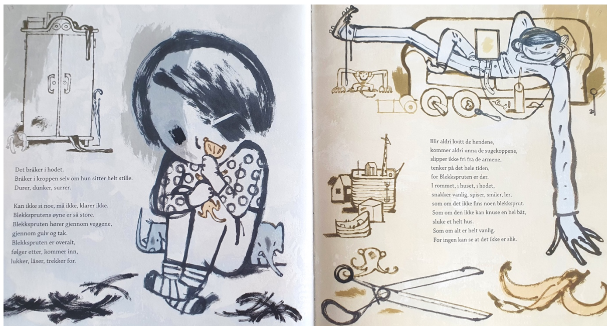
Figur 10 Dahle, 2016, oppslag 10

det. I verbalteksten blir det bekreftet «Men gullet finnes ikke lenger. For Gullet er ikke lenger Gullet [...]». Det meste på venstresiden av oppslaget er farget i blått, men leoparden er gul, som jeg mener igjen antyder trygghetsfargen. Under kjøreturen når Gullet forteller om overgrepet til moren, er ikke Leoparden med i illustrasjonene, men ut ifra illustrasjonen på oppslag 12 ligger den i lomma til Gullet. Gullet holder leoparden som nå fremstår som mindre, tett inntil brystet når moren stormer inn i huset til broren etter kjøreturen. Nå er hele Gullet i en gulere fargetone, sammen med genseren man kan se under jakka og leoparden. Min tolkning er at siden hele Gullet nå er i en gul farge, er tryggheten i Gullet på vei tilbake og hun er ikke like avhengig av leoparden lenger.