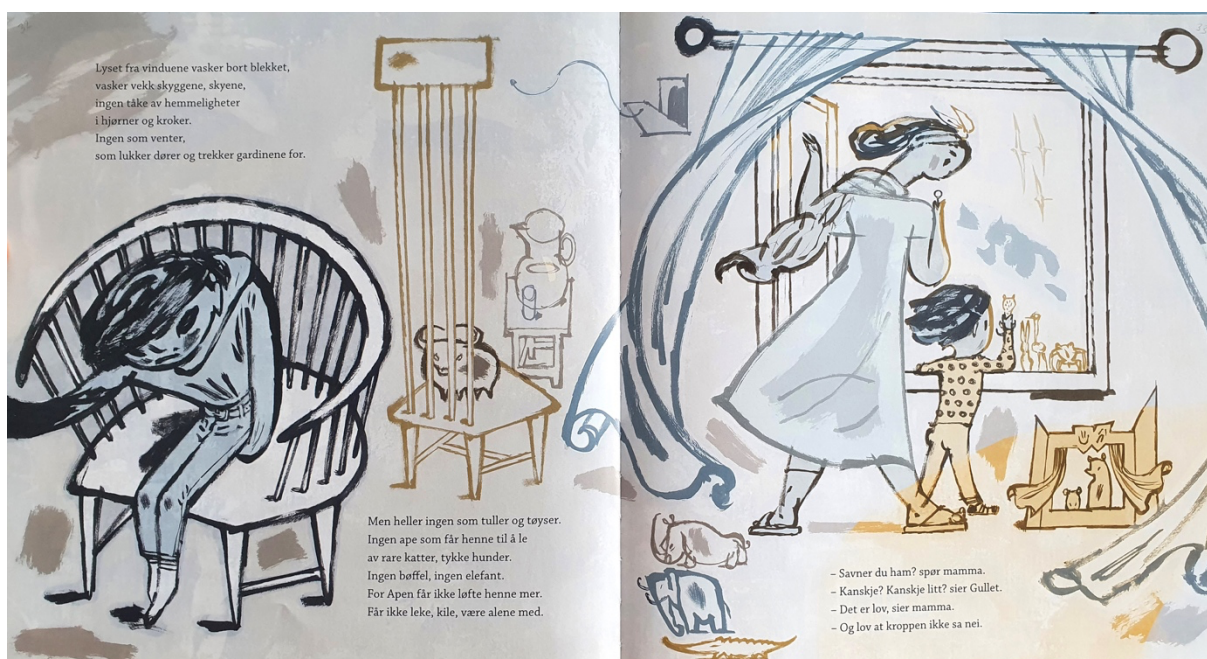
Figur 12 Dahle, 2016, oppslag 17

På oppslag 16 er det elefanten, en av lekebamsene til Gullet som holder nøkkelen. Elefanten står og ser opp på Gullet som sitter på armen til mora, og på mora som snakker i telefonen. Nøkkelen har ikke lenger mørke konturer slik som før hemmeligheten kom frem i lyset. Det virker som at makten til broren er borte. På høyre side av oppslaget er det fire vinduer. Alle er helt åpne og det vokser en høy blomst utenfor som strekker seg inn gjennom de åpne vinduene. Assosiasjonene jeg får på dette oppslaget er at alle dører og vinduer er åpne. Alle hemmeligheter er sluppet frem i lyset, og nå kan Gullet få den hjelpen hun trenger. Verbalteksten bekrefter assosiasjonene med oppmuntrende ord til Gullet om at det var godt gjort og at alt skal ordne seg. Også på det neste oppslaget, oppslag 17 (Figur 12) kan man se et stort og åpent vindu med lette gardiner som blafrer. Jeg kan nesten kjenne den friske