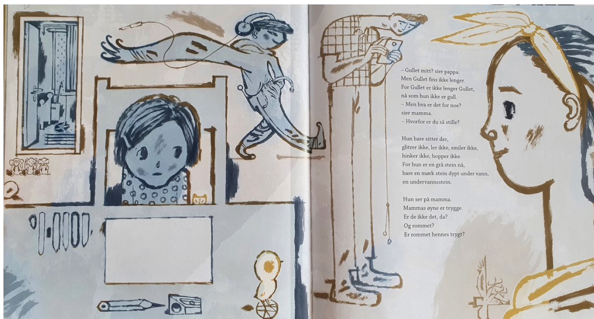
Figur 13 Dahle, 2016, oppslag 11

Jeg har valgt ut tre oppslag fra bildeboka som jeg ønsker å se nærmere på i detalj. Disse tre oppslagene har i likhet med resten av boka innholdsrike illustrasjoner og flere av nøkkeltegnene jeg tidligere har nevnt. Jeg vil analysere fargebruken på oppslagene, bruken av dyr og nøkkel. På oppslagene vil jeg sammen med nøkkeltegnene også se på blant annet bildeutsnitt, kroppsspråk, mimikk, blick og relasjoner.