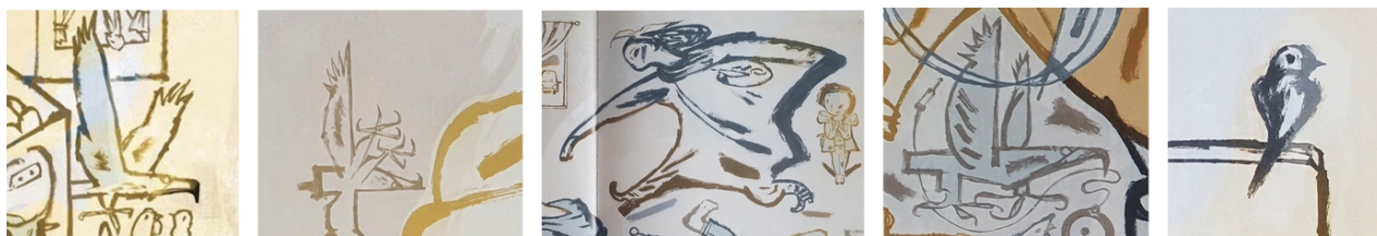
Figur 6 Dahle, 2016a, utklipp fra oppslag 2, 11, 15, 16, 19