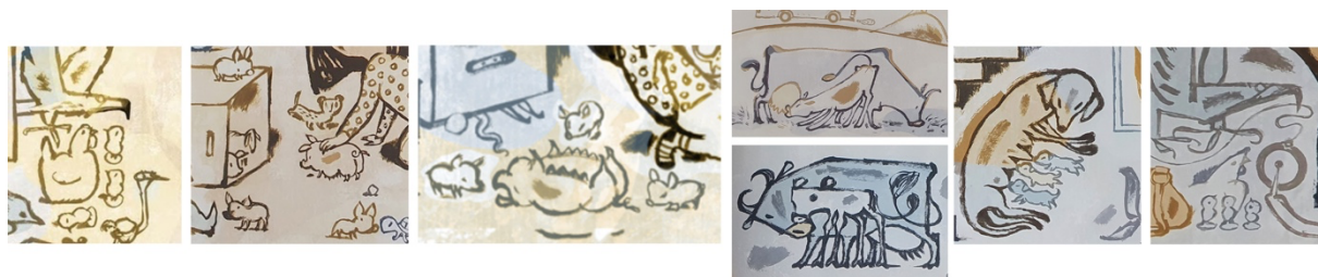
Figur 7 Dahle, 2016a, plukket fra oppslag 2, 4, 5, 13, 16

På flere av illustrasjonene er det et mammadyr sammen med barna sine. Det er en høne med tre kyllinger, en grisemor med tre grisunger, en ku sammen med kalven sin og en hund med tre valper. Den ene kyllingen til høna ligger på gulvet, den andre titter opp på høna og den siste kan se ut som at ser opp på ørna over seg. Som tidligere beskrevet tolker jeg det som at ørna er mora som beskytter. Denne kyllingen er å se på flere av oppslagene, på oppslag fire står den og titter opp på en lekescene. På oppslag seks, like før overgrepet svømmer den bort fra en stor hval. På oppslag 11 står den på bordet fremfor Gullet. På oppslag 15 er den tilbake sammen med hønemor og de to andre, og på det siste oppslaget står den og ser opp på en enhjørning. Jeg tolker det som at den lille kyllingen har vært ute på en egen reise, uten mora si, slik som Gullet. Kyllingen er nysgjerrig, men blir jaget av noe stort og skremmende, før den er trygt tilbake hos mora si. Siden den på siste oppslag er alene igjen, vil jeg tolke det som at Gullet er modig og tørr å være alene. Verbalteksten forteller det samme; «for nå er det trygt å være alene på rommet.».