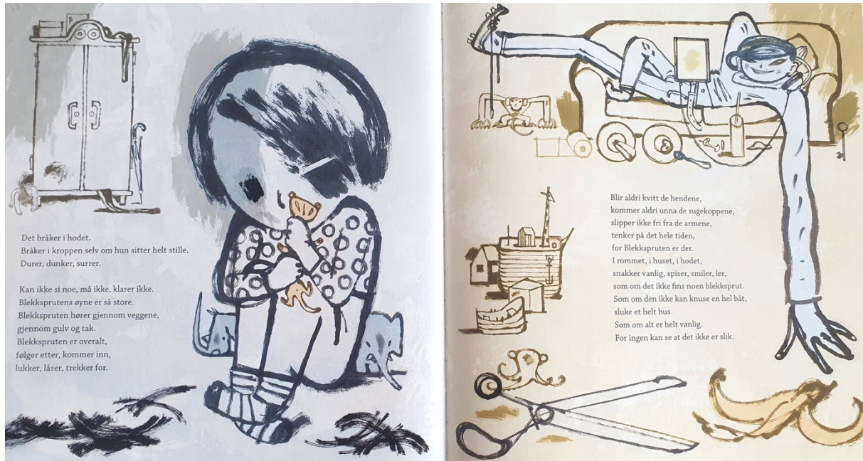
Figur 4 Dahle, 2016, oppslag 10

På oppslag 10 (figur 4) står det i verbalteksten at «Blekkspruten hører gjennom veggene, gjennom gulv og tak. Blekkspruten er overalt.». Broren er dekket av en blåfarge, min følelse er at Gullet nå er redd for ham, eller Blekkspruten som hun kaller han, som finnes overalt og hun ikke slipper unna. På