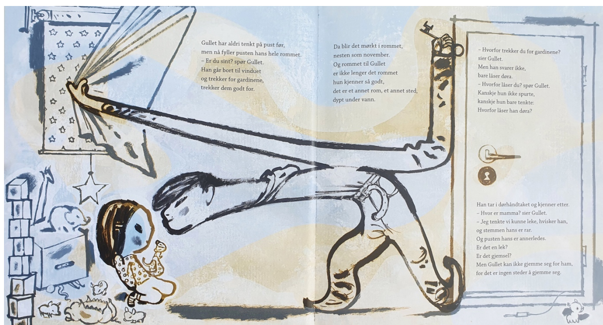
Figur 1 Dahle, 2016a, oppslag 5

Det første jeg tenkte på da jeg skrev gul og blå er begrepet «slått gul og blå». Fargene i kombinasjon gir meg assosiasjoner til blåmerker. Etter å ha studert fargebruken i boka tolker jeg det som at blå er vannet Blekkspruten lever i, og som Gullet sier på oppslag ni at hun synker til bunns i. Vannet ser jeg på som nifst, fordi det er dypt, uforutsigbart, massivt og kan reelt være farlig. Siden jenta heter Gullet, og gull som kjent skinner, tolker jeg det som at gulfargen gjenspeiler Gullet. Gullet blir omtalt som gullklump. Gull får man om man vinner, altså det gjeveste. På oppslag to bekreftes min tolkning i verbalteksten; «Som oftest er Gullet som gull. For Gullet glitrer [...] lyser hun, for det sier mamma, mamma ser henne lyse.». Slik jeg tolker det, er blåfargen i boka ofte fargelagt på noe Gullet kanskje føler er skummelt og usikkert, i motsetning til Gulfargen. Gulfargen er omkranset de elementene som jeg tolker fremstår som kjente og trygge for Gullet. Blåfargen er ofte å se på broren, som alltid har det jeg tolker som et skummelt blikk bort på Gullet. Gulfargen er å se på blant annet rommet til Gullet, på leopardbamsen hun alltid har med seg, på klærne til Gullet og på moren til Gullet. På de første