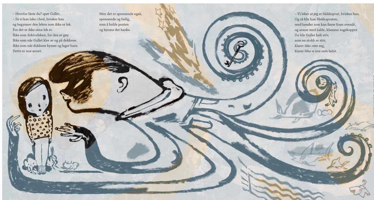
Figur 9 Dahle, 2016, oppslag 6

Når overgrepet er i ferd med å skje på oppslag seks (figur 9) og broren forvandles til en blekksprut, har broren tatt leoparden fra Gullet. Leoparden henger i en av tentakkene til broren i noe som kan minnes som et kvelertak. Jeg tolker det som at broren tar tryggheten fra Gullet, det trygge er nå langt