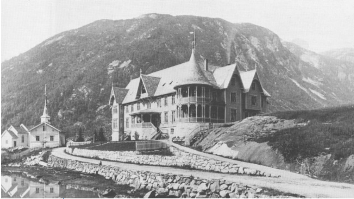
Hotel Mundal i 1895. 1