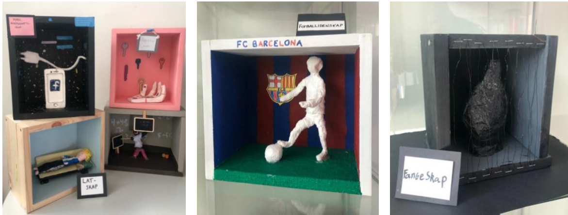
Figur 1, 2 & 3 Elevarbeid

«Embla» gjennomførte ei portrett-oppgåve. Elevane skulle teikne eit halvt portrett med blyant og på den andre halvdelan skulle dei bruke mosaikk-teknikk med utklipp frå vekeblad som ressurs. Oppgåveteksten inneheldt framgangsmåtar elevane kunne bruke.