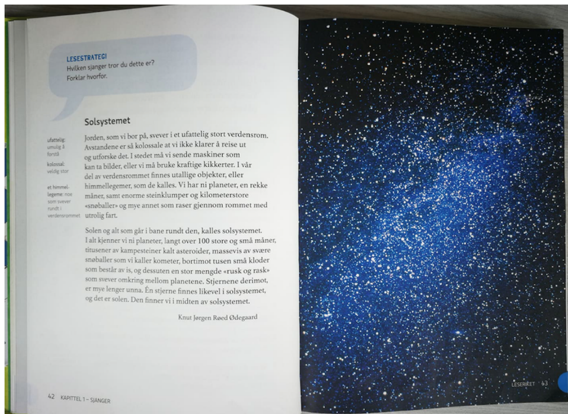
Figur 1: Oppslaget til teksten Solsystemet . Henta frå Ordriket 5A , (s. 42-43), av Bjerke et al (2014).

Frå Ordriket 5A har eg vald ut oppslaget med Solsystemet , sjå figur 1 (Bjerke et al, 2014, s. 42). Oppslaget består av ei side med verbaltekst og ei side med eit fotografi. Eg har også vald å sjå på oppgåvesida som høyrer med til teksten for å kunne sjå på kva ferdigheiter ved leseforståinga dei vekter i forhold til denne teksten. Oppgåvene finn vi på side 44.