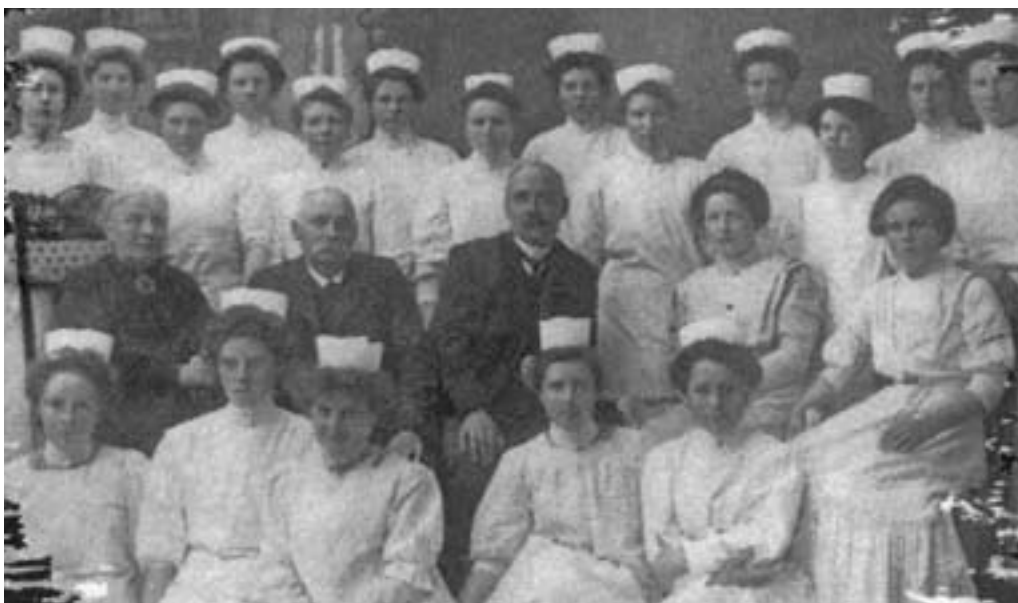
Jordmorelever utdannet ved Bergen Jordmorskole 1910.