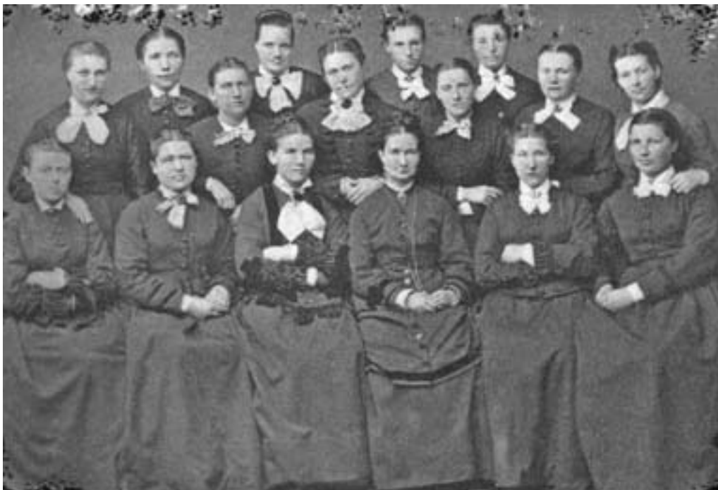
Jordmorelever utdannet ved Bergen Jordmorskole 1877.