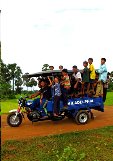
Figur 4: Skolebuss.