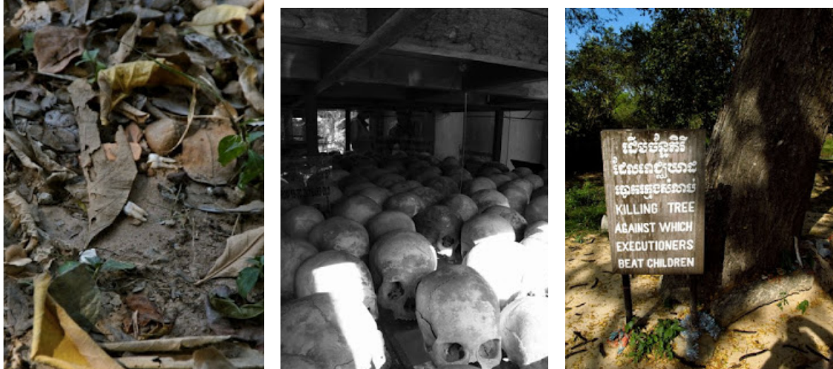
Figur 9, 10 og 11: Choeung Ek Killing Fields utenfor Phnom Penh hvor 8895 døde har blitt funnet. 43

gråte, vise kjærlichkeit eller medfølelse. Regimet kunne plutselig bestemme at du måtte gifte deg med en parter av deres valg, uavhengig av alder eller om du var gift fra før. De nygifte fikk kanskje så en uke sammen hvor de ble forventet å skape nye borgere som skulle være med på å drive revolusjonen fremover. Alle ble tvunget til å gå i sorte Røde Khmer-uniformer.