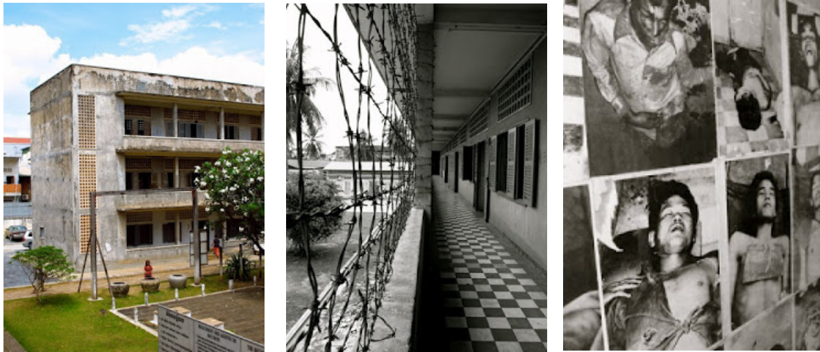
Figur 6, 7 og 8: Bilder fra S-21/Toul Sleng, et av Røde Khmers viktigste torturfengsler. 40

stor skala. 38 Et par av Røde Khmers effektive slagord var ”intet å tape på å fjerne dem, intet å tjene på å beholde dem” og ”bedre å drepe en uskyldig enn å la en skyldig være i live”. 39