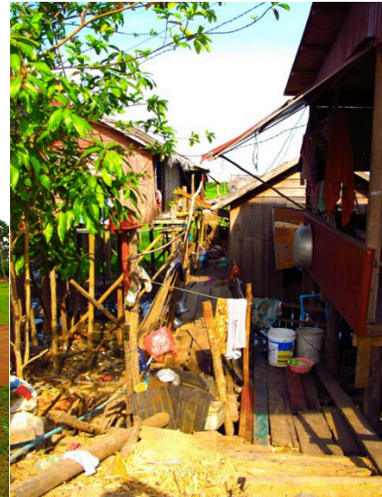
Figur 5: Kambodsjansk stolpehus. 18

I Kambodsja lever man typisk i såkalte stolpehus, enkelt konstruerte trehus som er bygget på stolper for å forhindre at man får vann i huset i regntiden. Husene er omgitt av rismarker, og de fleste har kanskje et par husdyr og en liten fiskedam utenfor huset sitt. På landsbygda lever mange uten elektrisitet og infrastrukturen er i størsteparten av landet relativt dårlig. Unntatt i