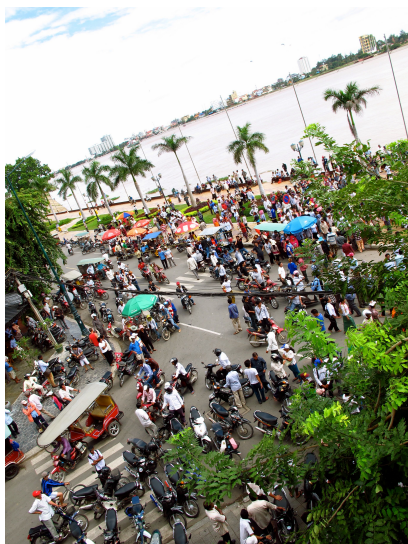
Figur 3: Et typisk veikryss i Phnom Penh.

På en verdensomspennende korrupsjonsindex fra 2013 ligger Kambodsja på 160ende plass av 177 land, noe som plasserer landet i verdens korrupsjonsmessige bunnsjikt sammen med land som Nord-Korea, Sudan, Somalia og Libya. 16 I en spørreundersøkelse fra 2013 svarer majoriteten av kambodsjanere at de har betalt minst en bestikkelse i løpet av det foregående året, og 75% hevdet at det var nødvendig å ha personlige kontakter når man skulle forholde seg til myndighetene. 17