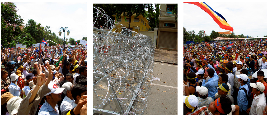
Figur 12, 13 og 14: Demonstrasjon i Phnom Penh september 2013. 63

Samtidig som denne situasjonen for mange er skremmende med tanke på den lange og voldelige historien landet har, mener de fleste at det er et sunnhetstegn at folket endelig begynner å ta til motmæle mot myndighetene. I flere tiår var mange lamslåtte av frykt for hva autoritetene ville gjøre med dem om de protesterte på grunn av sine erfaringer fra Røde Khmer-tiden. Mange hevder at generasjonen med unge menn og kvinner som er i ferd med å bli voksne i dag ikke har den samme frykten for autoriteter, fordi de er født etter Røde Khmers fall. Dette sier også noe om at samfunnet endelig ser ut til å være i endring. Fra en svært dystert situasjon i 1979 med fullstendig raserte byer, en enorm mangel på mat og ressurser, en traumatisert befolkning og enorme tap av menneskeliv, via en svært turbulent og politisk ustabil periode med borgerkrig på 80- og 90-tallet, ser det ut til at samfunnet er i ferd med å endre seg. De skyldige fra 70-tallet blir nå omsider stilt for retten, befolkningen begynner å kreve sine rettigheter og kunnskapen om hva som hendte på 70-tallet kan endelig graves frem fra mørke arkiver og deles med befolkningen ledet an av dokumentasjonssenterets Genocide Education Project.