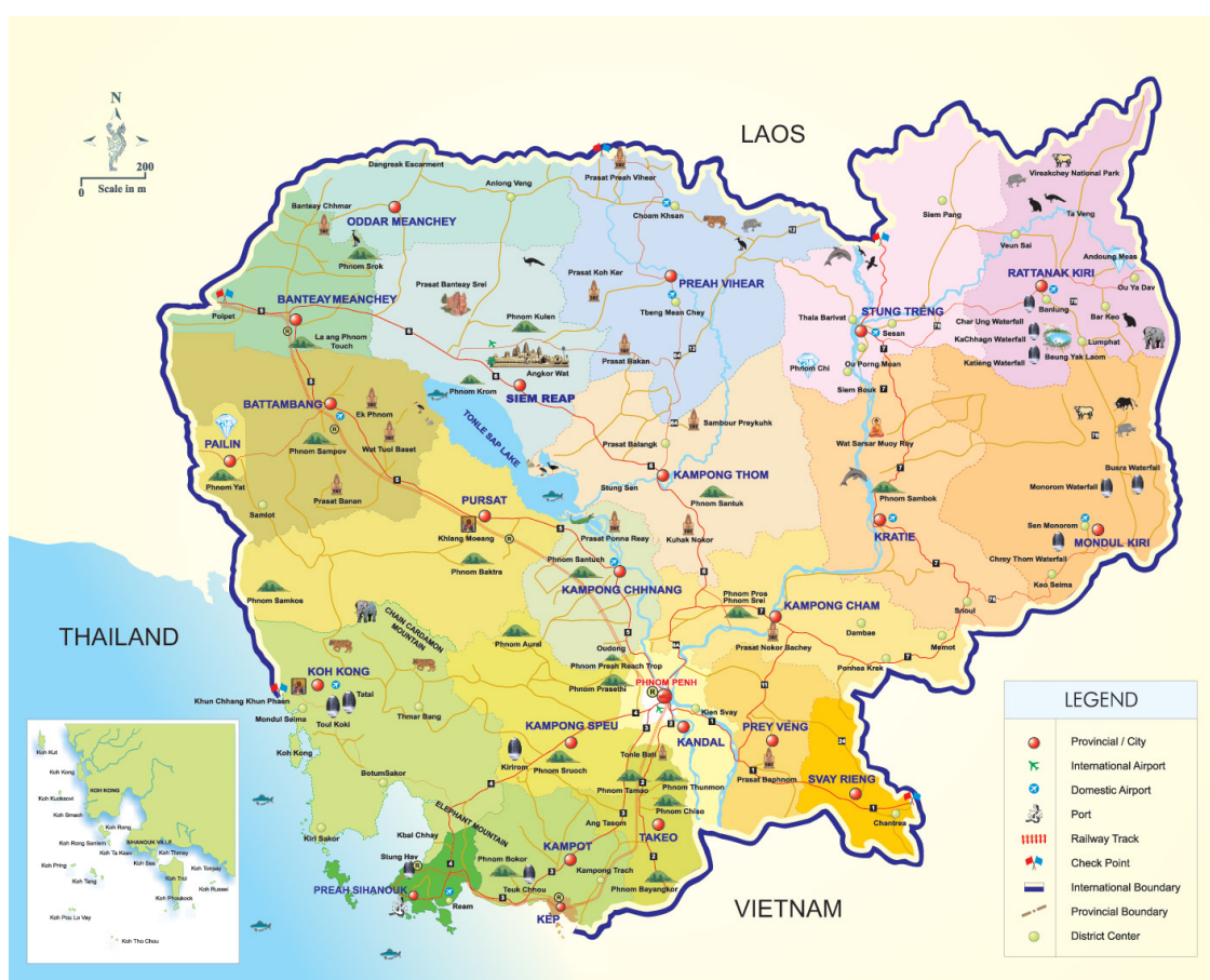
Figur 1: Kart over Kambodsja. 4

Kambodsja er et land i Sørøst-Asia med Phnom Penh i sør som hovedstad. Landet er inndelt i 24 provinser. Det har kystlinje til Thailandbukten i vest og befinner seg mellom Thailand, Laos og Vietnam. Størrelsen på landet er ca. 176.000 kvadratkilometer og det har i overkant