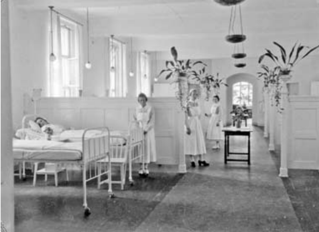
Det var en lettelse for sykepleiere og elever da de flyttet til sykehuset på Haukeland. Da var det slutt på vedfyring og klargjøring av oljelamper. På de fleste avdelinger var det åpne saler med plass til 16-18 pasienter, mens noen få fikk gleden av de dekorative og skjermende skilleveggene.

umenneskelige arbeidspresset for oversøstrene, men etter hvert som sykehuset ble bygget ut, ble det stadig mer å gjøre og man fant ut at avdelingssøstrene ikke kunne greie seg med bare elever. Fra 1916 fikk sykehuset assistentsøstre, og det ble ansatt en utdannet sykepleier som hadde ansvar om natten.