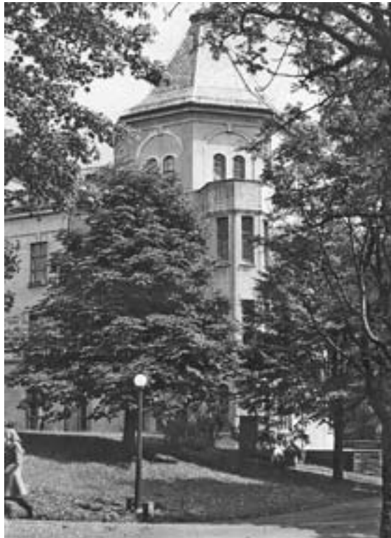
«Paraplyen», den åttekantete dagligstuen, var et naturlig samlingspunkt for elever og sykepleiere som hadde sitt hjem på «søsterloftet».