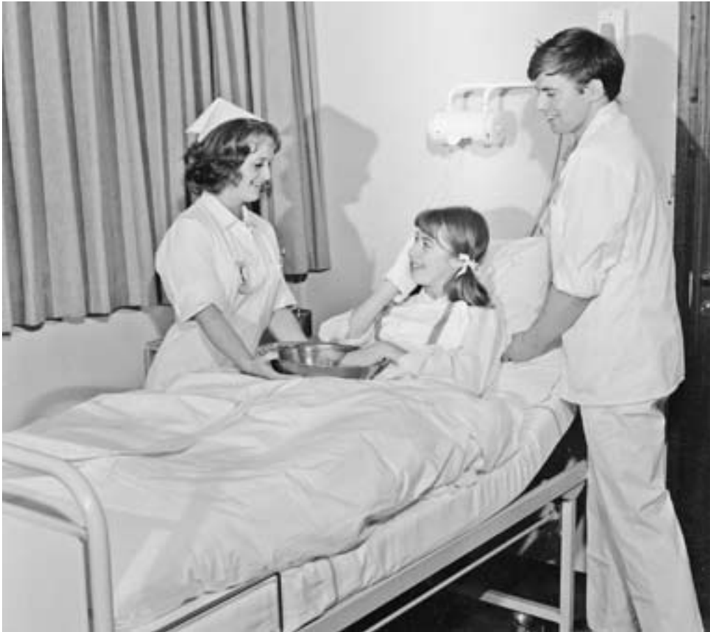
«Tror du at du bare kan stå å se på fordi du er mann?»

skulle levere en større fordypningsoppgave innen sykepleiefaget i tillegg til statseksamen. Dette var en ny eksamensform som skulle teste elevenes evner til å anvende sine kunnskaper. Mens tidligere eksamener i stor grad hadde bestått av kunnskapsspørsmål, skulle elevene nå belyse praktiske problemstillinger, skriftlig redegjøre for valg av løsninger og tiltak og begrunne disse. Denne oppgaven ble en forløper til det som senere ble kalt hovedoppgave og som i dag er videreutviklet til studiets avsluttende bacheloroppgave.