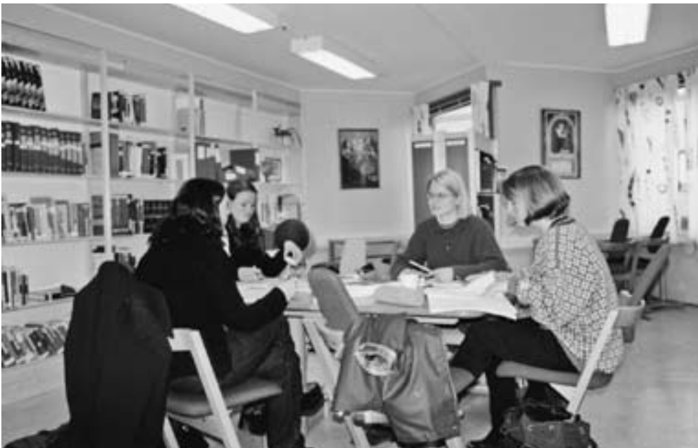
Biblioteket blir flittig brukt både til studiegrupper og til lesing og søk etter det aller nyeste av kunnskap på nettet. Bibliotekarene er alltid klar til å bistå med råd og hjelp.

Virksomheten ved Institutt for Sykepleie har blitt betydelig utvidet siden år 2000. I tillegg til treårig Bachelorstudium i sykepleie gjennomfører Institutt for sykepleie en fireårig desentralisert utdanning som gir samme kvalifikasjoner. Videre har det vokst frem en rekke videreutdanninger i sykepleie i instituttets regi. Det tilbys en 30 studiepoengs tverrfaglig videreutdanning i veiledningspedagogikk over 1 år, og 45 studiepoengs videreutdanning i sykepleie fordelt på 11/2 års studium i følgende spesialfelt: