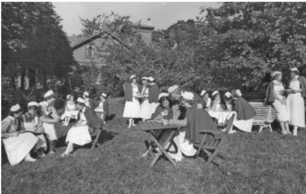
En solskinsdag i den vakre hagen på Ulriksdal. Elevene nytter fritiden til lesing. Uniform var obligatorisk selv om de hadde fri.