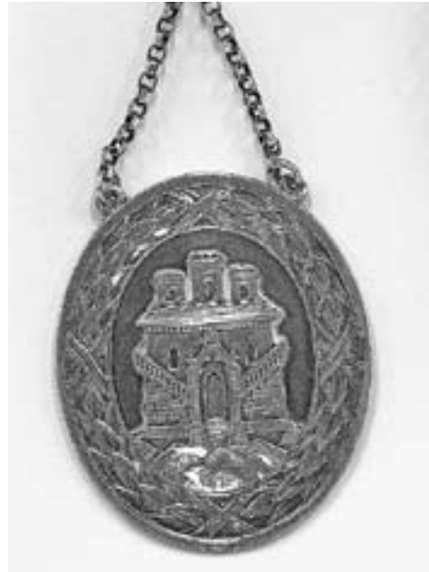
Sykepleierskolens viktigste symbol var sølvmedaljongen og det blå st. Georgskorset. Medaljongen bar Bergens byvåpen omkranset av ekeløv. Da skolen i 1986 ble statseid, ga Bergen kommune dispensasjon til å beholde motivet, men da sykepleierutdanningen ble en del av Høgskolen i Bergen, ble den erstattet av en nydesignet nål.

Sykepleierskolen fikk allerede fra begynnelsen av et visst selvstyre gjennom dannelsen av et sykepleiefond som dekket utgifter til lønninger og internat. Videre ble det bestemt at i tillegg til at fondet skulle dekke faste utgifter, kunne styret, med direktørens godkjenning, anvende midler fra fondet i medlemmenes interesse eller til fremme av den kommunale sykepleie.