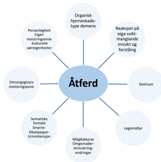
Figur 1- Oversikt over multifaktorielle årsakssamanheng ved utfordrande åtferd hos pasientar med demens (Nygaard, 2003).

fellesskapet og dette behovet forsvinn ikkje sjølv om ein får ein demensdiagnose, og symptom som kan opplevast som utfordrande for dei rundt. Behova vert gjerne uttrykt på ein annan måte (Mjørud, Engedal, & Røsvik, 2013). Målet med personsentrert omsorg er anerkjenning av personverdet i alle deler av behandlinga. Det vil seie at omsorgsgivaren må prøve å forstå utfordrande åtferd som ei form for kommunikasjon frå pasienten si side og at åtferda har ein intensjon. Ein kan sjå det som eit forsøk på å protestere og at ein prøver å få kontroll (Testad, Aasland, & Aarsland, 2007). Det er og viktig å hugse at all åtferd er individuell og at det gjer det vanskeleg å bruke generelle tiltak (Algase & Beattie, 1996; Cohen-Mansfield, 2003; Kitwood, 2006). Omsorga og omsorgsmiljøet må bli personleggjort for å møte behovet til kvar enkelt pasient (Edvardsson, Varrailhon, & Edvardsson, 2014).