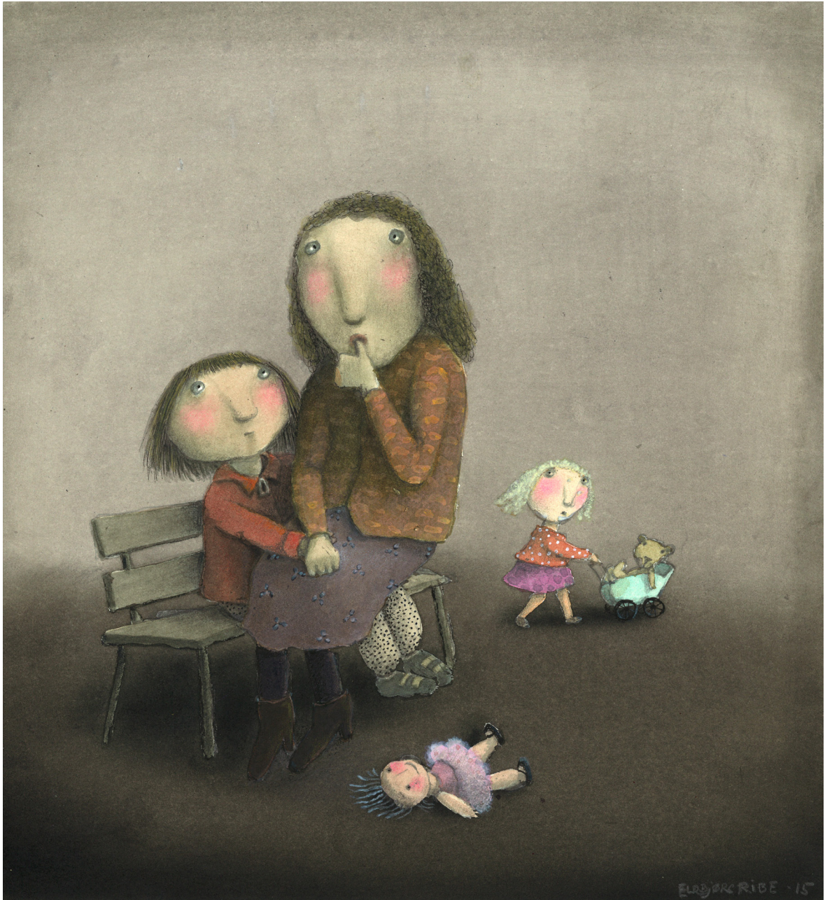
Illustrasjon: Eldbjørg Ribe