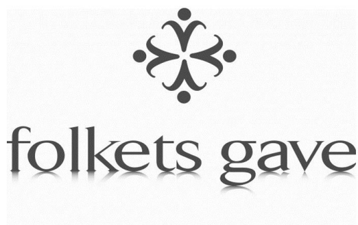
Figur 1. BH logo folketsgave skygge-WEB.