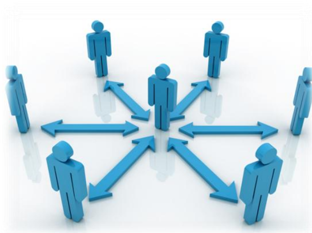
Illustrasjon 4: "Tverrfaglig samarbeid med barnet i fokus"

De vanligste samarbeidsmåtene er samarbeid i faste fora, samarbeid ved bekymring omkring barns omsorgssituasjon, samarbeid der barnevernet har tiltak og samarbeid rundt barn som er plassert i institusjon. Tverrfaglig samarbeid vil være ulikt alt etter hvilket nivå samarbeidet skjer på (Postholm et al., 2012). I tilfeller der samarbeidet ikke fungerer godt kan det utvikles konflikter. Ofte vil det da være barnet som rammes hardest (Eriksen & Germeten, 2012).