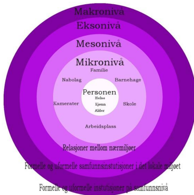
Illustrasjon 3: "Bronfenbrenners økologiske modell"

Psykologen Urie Bronfenbrenner (1917-2005) er en av de som mener at barns utvikling må oppfattes som en helhetlig sammenheng. I sin økologiske modell peker han på at miljøet og det sosiale samspillet barnet er en del av, må tas i betraktning i barns utvikling. Et barn hører til flere miljø som familie og hjem, skole, venner, naboer, bygd eller bydel, kommune og nasjon. Miljøene kan formidle ulike budskap som er motstridene til hverandre, og dermed føre til forvirring hos barn (Imsen, 2005).