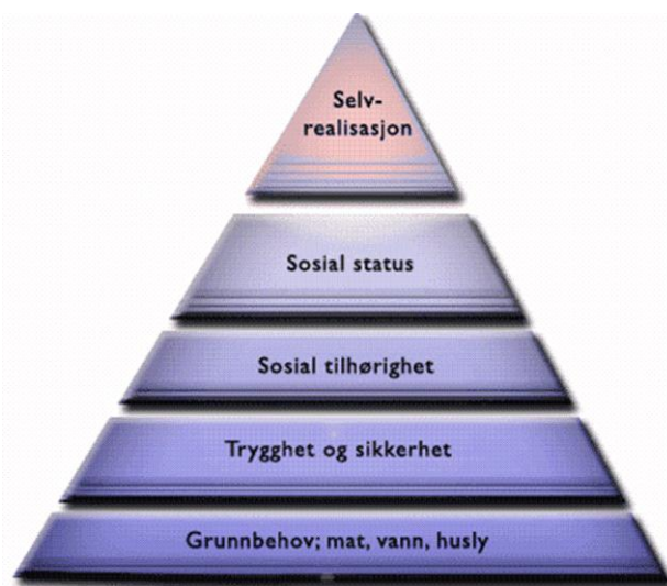
Illustrasjon 2: "Abraham Maslows behovspyramide"